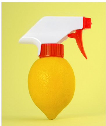
Sítróna er náttúrulegt hreinsiefni.

Ódýrasti Symfonisk hátalarinn kostar um 12 þúsund krónur en ekki er vitað hvað hann kostar lentur í Garðabæ. Hann ku smellpassa í IKEA hillulínuna og getur einnig orðið hilla og borið um þrjú kíló.