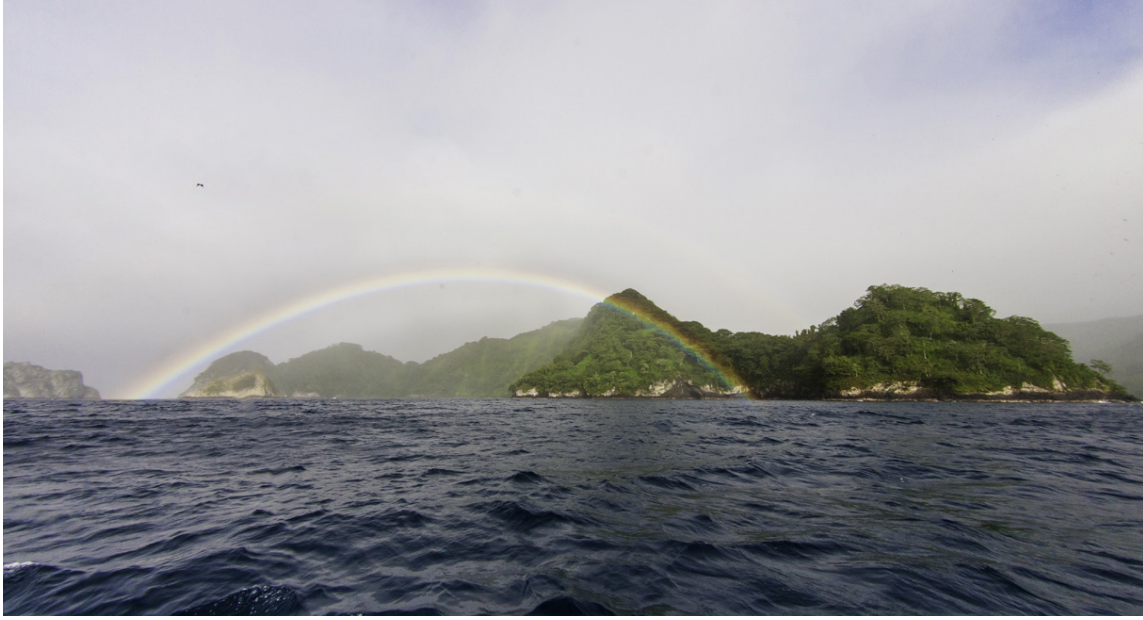
Gulleyja Roberts Louis Stevenson er talin hafa átt sér fyrirmynd í Kókoseyju undan strönd Kosta Ríka.