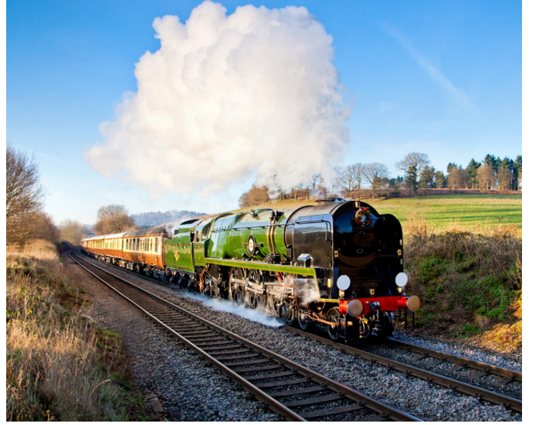
Austurlandahraðlestin var lögð niður 2009.

Hugmyndin að þessari klassísku hryllingssögu um dr. Frankenstein og skrimslíð hans vaknaði hjá höfundinum þegar hún ferðaðist um Evrópu. Bókin segir ekki klassíska ferðasögu en fylgjast má með ferðum doktorsins frá hinum glæsilega bæ Landshut í