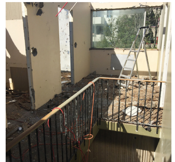
Til vinstri má sjá borðstofuna og stofuna fyrir breytinguna. Til hægri er efri hæðin eftir brunann.