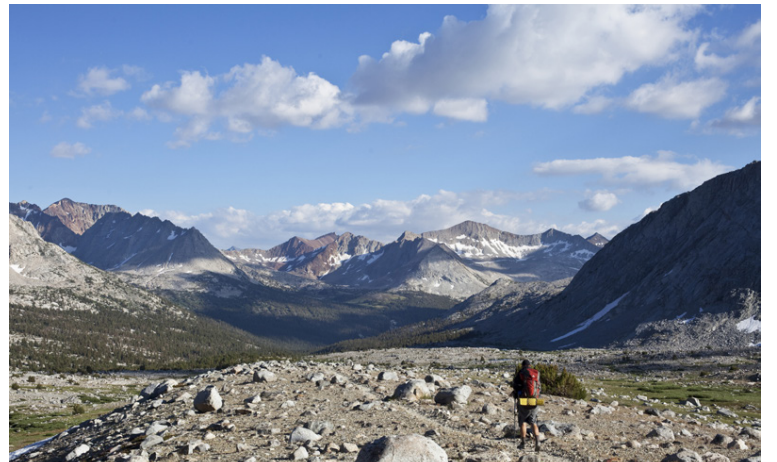
Cheryl Strayed gekk um 1.500 km leið eftir Pacific Crest Trail.

Bæjaralandi þar sem skrimslíð verður til og upp í fjöll Genf í Sviss þar sem þeir hittast á ný og loks