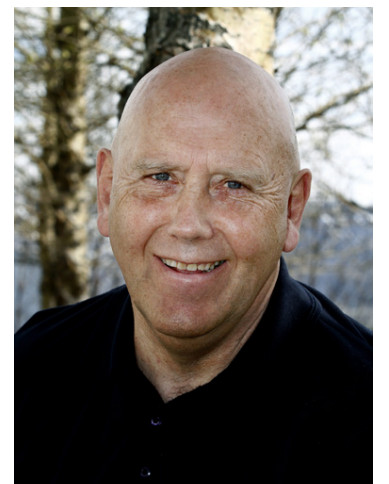
Magnús er betri í hnjám og finnur minna fyrir liðverkjum eftir að hann fór að taka sæbjúgnahylkin.

Framleiðandi sæbjúgna er Arctic Star ehf. Allar nánari upplýsingar fást á arcticstar.is. Arctic Star sæbjúgnahylki fást í flestum apótekum og heilsuþúðum og í Hagkaupum.