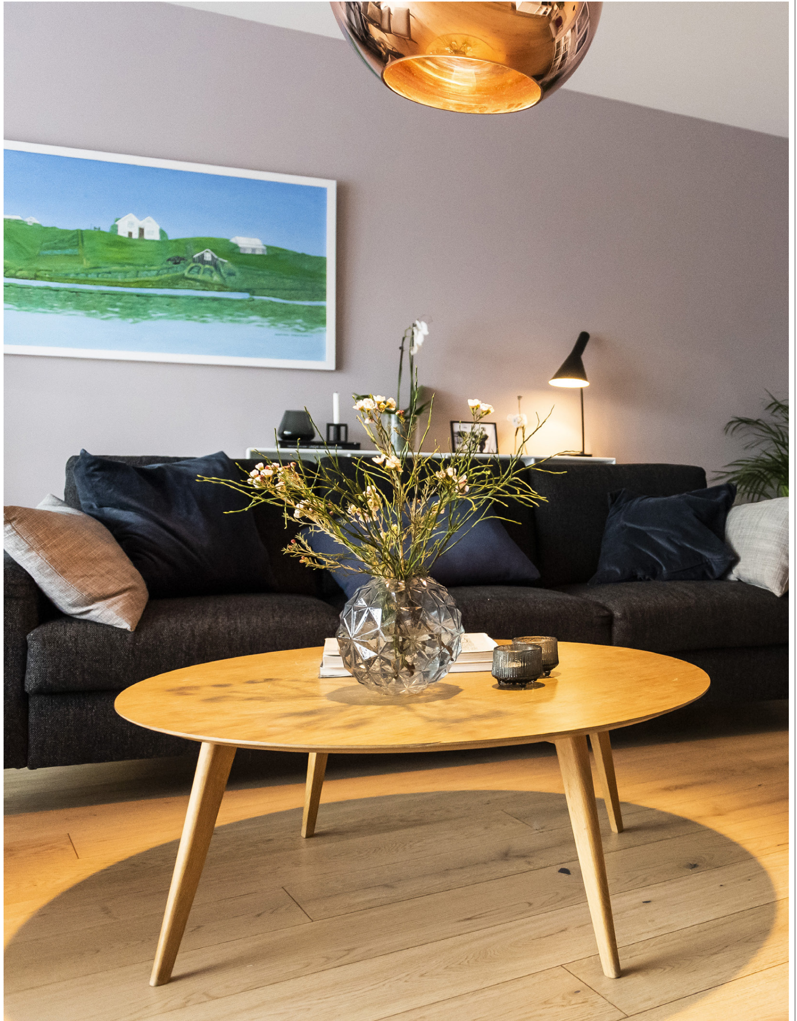
Gulllitað ljósið frá Tom Dixon gerir mikið fyrir bjarta og fallega stofuna. Ljósir litir eru á flestum veggjum heimilisins.

Páskarnir nálgast og þá getur verið skemmtilegt að skreyta og baka, til dæmis að búa til páska-legalar múffur. ➔6