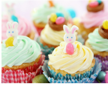
Það er hægt að skreyta páskamúffur á margvislegan hátt.

Hrærið saman öllum þurrefnum í múffurnar. Bætið smjörinu saman