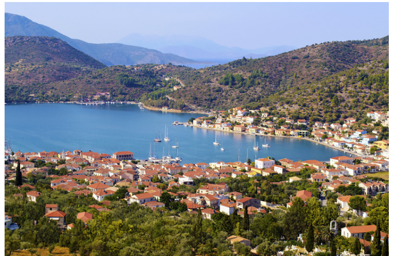
Vathy á Íþöku en þangað komst Ódysseifur eftir tíu löng löng ár á ferðalagi.