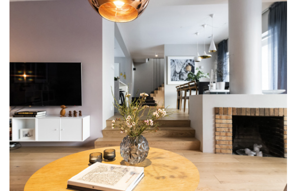
Horft úr stofunni inn í borðstofu. Arinninn setur skemmtilegan svip á rýmið.