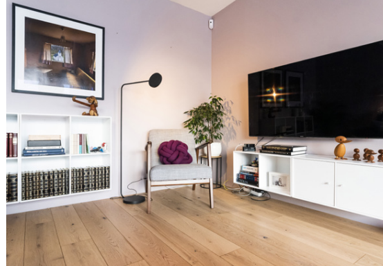
Sjónvarpsrímið er bjart og fallegt. Á veggnum hangir mynd eftir Sigurgeir Sigurjónsson.

Falleg lýsing getur breytt öllu og þarf ekki að kosta mikið.