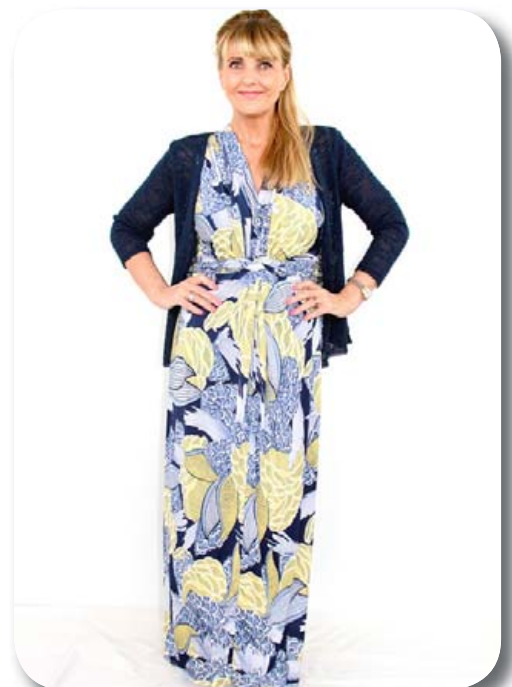
Síður kjöll ein st. passar á 38-44 verð nú 7990 Golla ein st. passar á 38-42 verð nú 5590