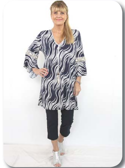
Túnika ein st. passar á 38-44 verð nú 6390 Kvartbuxur st. 36-48 verð nú 7190