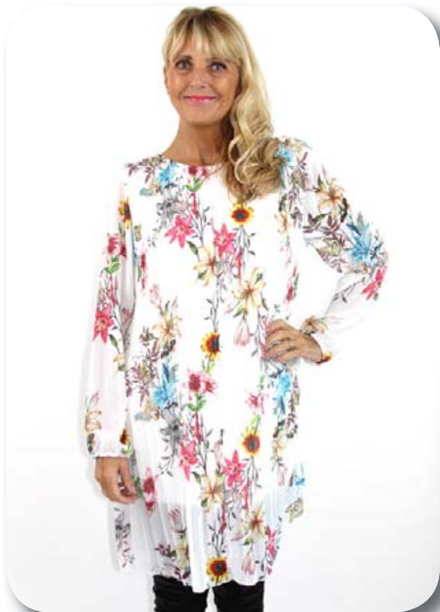
Túnika ein st. passar á 38-44 verð nú 6390