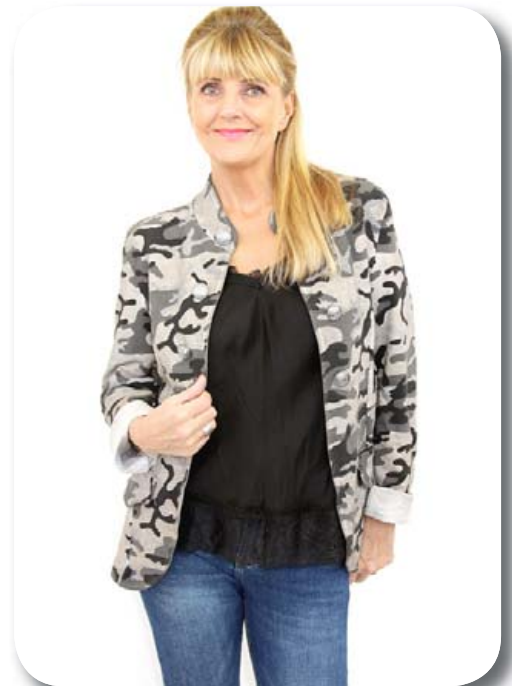
Jakki Eins st. passar á 38-44 verð nú 7990 Blúndutoppur ein at. passar á 38-42 verð nú 3990