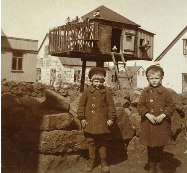
Hér má sjá nokkuð stóran dúfnakofa við Kárastíg í Reykjavík á þriðja áratug síðustu aldar.

Ýmislegt kom Tuma á óvart við gerð bókarinnar, t.d. hversu víða, hversu mikið og hversu lengi mannkynið hefur hagnýtt dúfur.