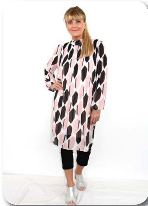
Kjöll ein st. passar á 38-44 verð nú 7990 , Kvartbuxur st. 36-48 verð nú 7190