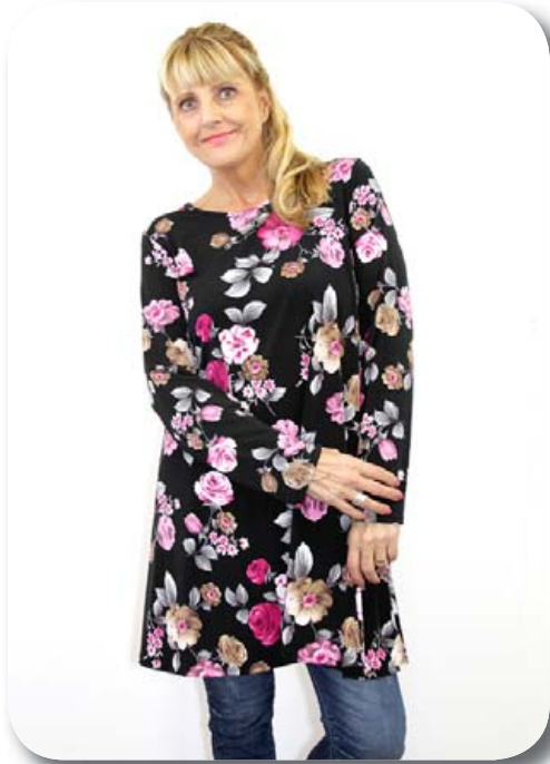
Kjöll st. 40-44, 44-48 verð nú 6390