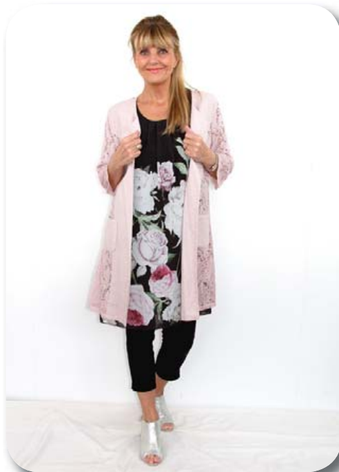
Túnika ein st. passar á 38-44 verð nú 6390 , Kvartbuxur st. 36-48 verð nú 7190 , Jakki st. 38-48 verð nú 7190