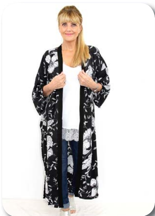
Kimano ein st. passar á 38-48 verð nú 6390 , Blúndutoppur ein st. passar á 38-42 verð 3990