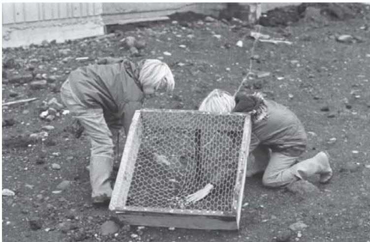
Tveir strákar veiða dúfur í efra Breiðholti árið 1973 og nota til þess sérstaka dúfnagildru.

„Heimildirnar eru mjög margbreytilegar og höfuðverkur að velja úr. Það kom mér sérstaklega á óvart hversu snemma farið var að rækta dúfur hérlendis. Fyrstu öruggu heimildirnar eru frá miðri sautjándu öld og vísbendingar um að það hafi verið ennþá fyrr. Margir vita ekki að breska hernámsliðið var með stórtæka bréfdúfurækt í Öskjuhlíð en bréfdúfur voru hluti af staðalöryggisbúnaði flugsveitanna. Þá þótti dúfnakjöt dálítið finn matar í upphafi