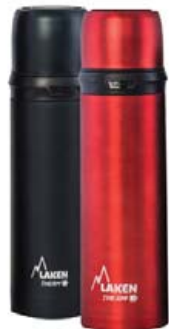
Laken Hitabrúsi 0,75 ltr. verð 5.995,- fermingartilboð 5.095,-