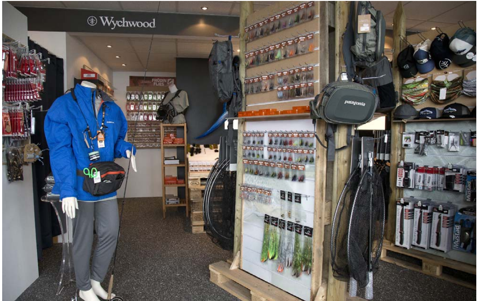
Flugubúllan í Kópavogi hefur boðið upp á gott úrval af stangaveiðibúnaði frá traustum og góðum vörumerkjum frá árinu 2016.

Hann segir bæði Patagonia og Costa vera fyrirtæki sem sé annt um umhverfið og náttúruna. „Patagonia lætur til að mynda