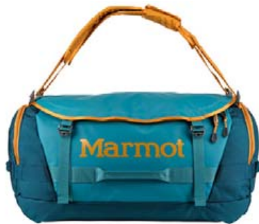
Marmot Long Hauler duffle bag 75 ltr. verð 22.995,- fermingartilboð 19.545,- mikið úrval að öðrum stærðum