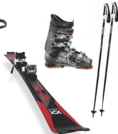
Skíðabúnaður í miklu úrvali