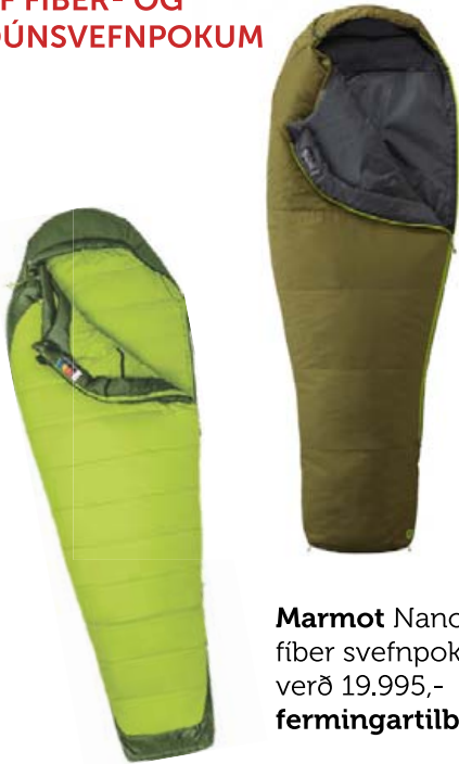
Marmot NanoWave 35 fiber svefnpoki verð 19.995,- fermingartilboð 16.995,-