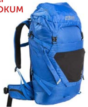
Helsport Lilfell 45 ltr. verð 36.995,- fermingartilboð 31.445,-