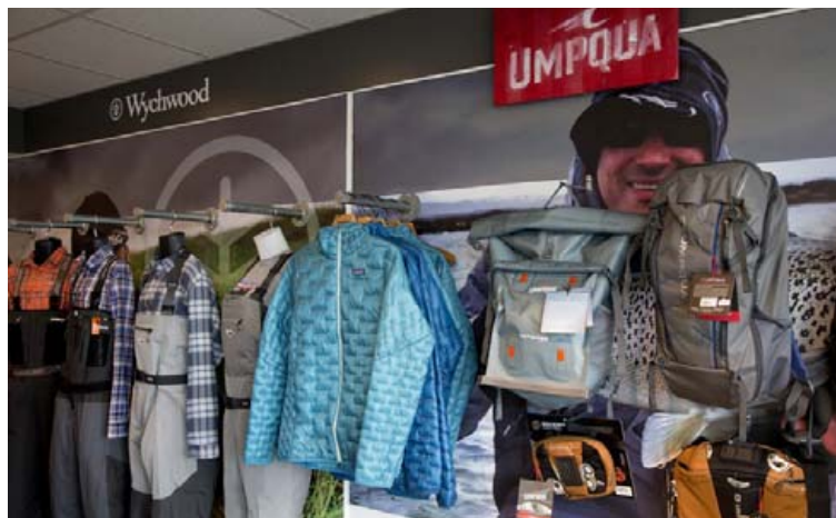
Í Flugubúllunni má finna flott úrval af vöðlum, tösukum og fatnaði.