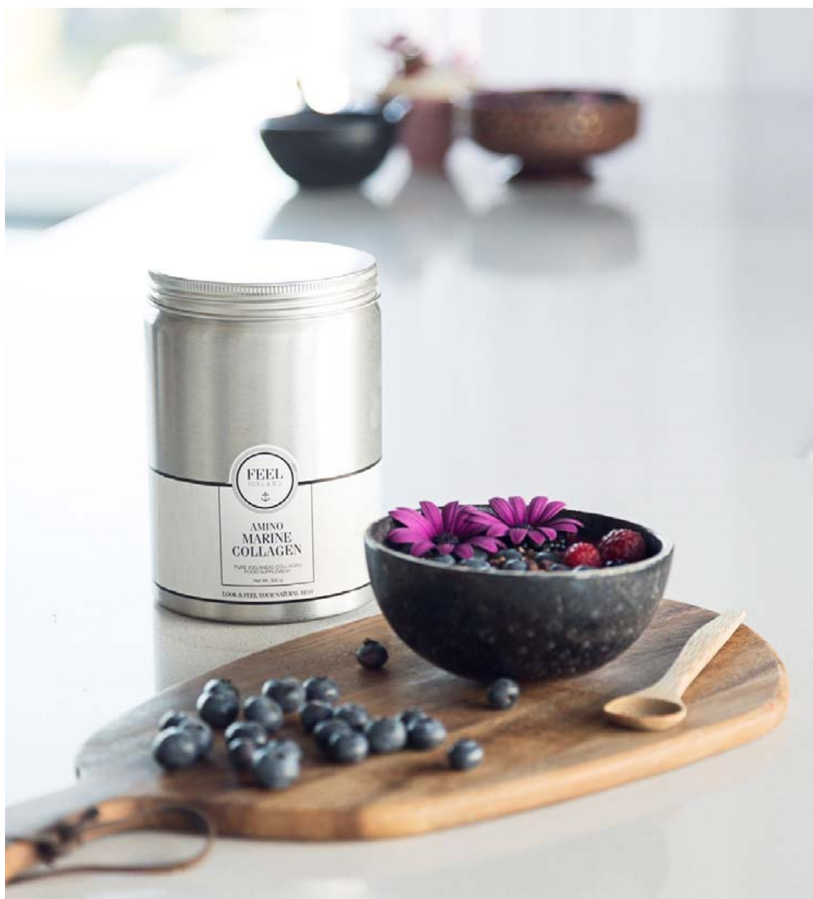
Amino Marine Collagen frá Feel Iceland heldur húðinni ungrri og heilbrigðri og mýkir upp liði.