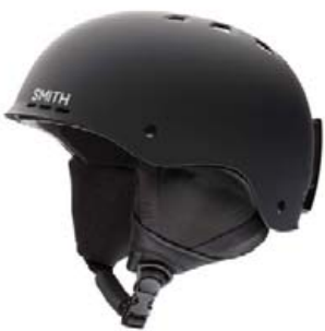
Smith Holt skíðahjálmar verð 9.995,- fermingartilboð 8.495,-