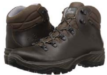
Scarpa Terra Gtx. skór verð 29.995,- fermingartilboð 25.495,-