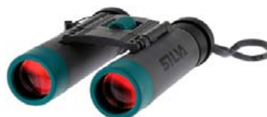
Silva sjónaukar pocket 10 10x25 verð 7.995,- fermingartilboð 6.795,-