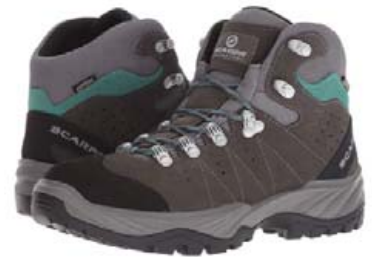
Scarpa Mistral Gtx. skór verð 28.995,- fermingartilboð 24.645,-