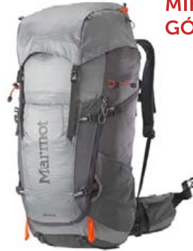
Marmot Graviton 48 ltr. verð 33.995,- fermingartilboð 28.895,-