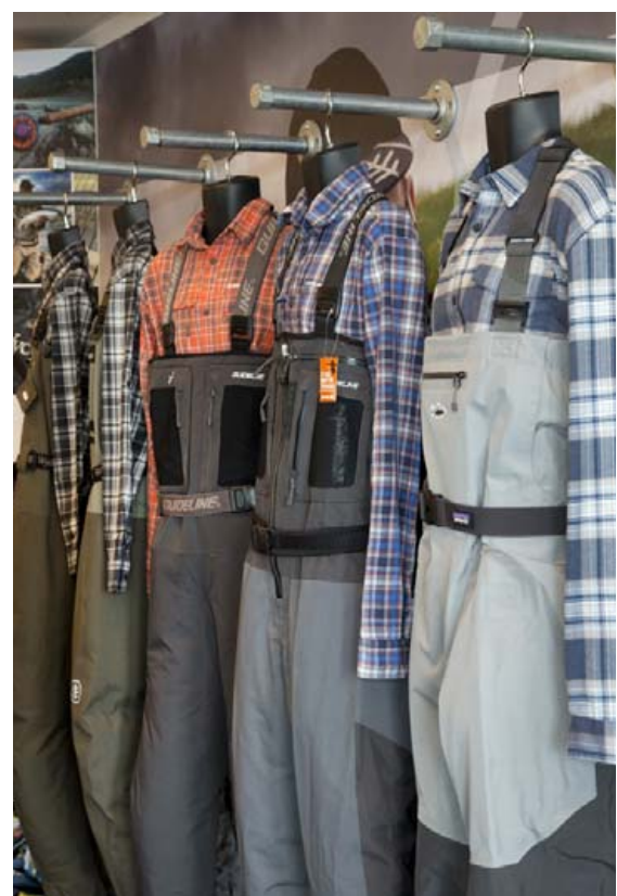
Vöðlur og vöðluskór frá Wychwood, Guideline og Patagonia.