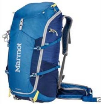
Marmot Graviton 34 ltr. verð 31.995,- fermingartilboð 27.195,-