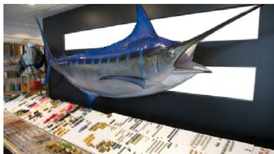
400 punda Blue Marlin trónir yfir flugubarnum.

lágmark 1% af söluhagnaði fyrirtækisins renna til ýmissa umhverfisamtaka. COSTA framleiðir einnig umgjardir gleraugna sinna úr endurunum netum sem falla frá skipum á hafi úti. Þannig að með kaupum á vörum frá COSTA og Patagonia ertu einnig að styrkja gott málefni.“