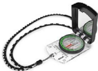
Silva Ranger S áttaviti verð 6.995,- fermingartilboð 5.945,-