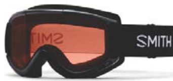
Smith Cascade skíðagleraugu verð 5.995,- fermingartilboð 5.095,-