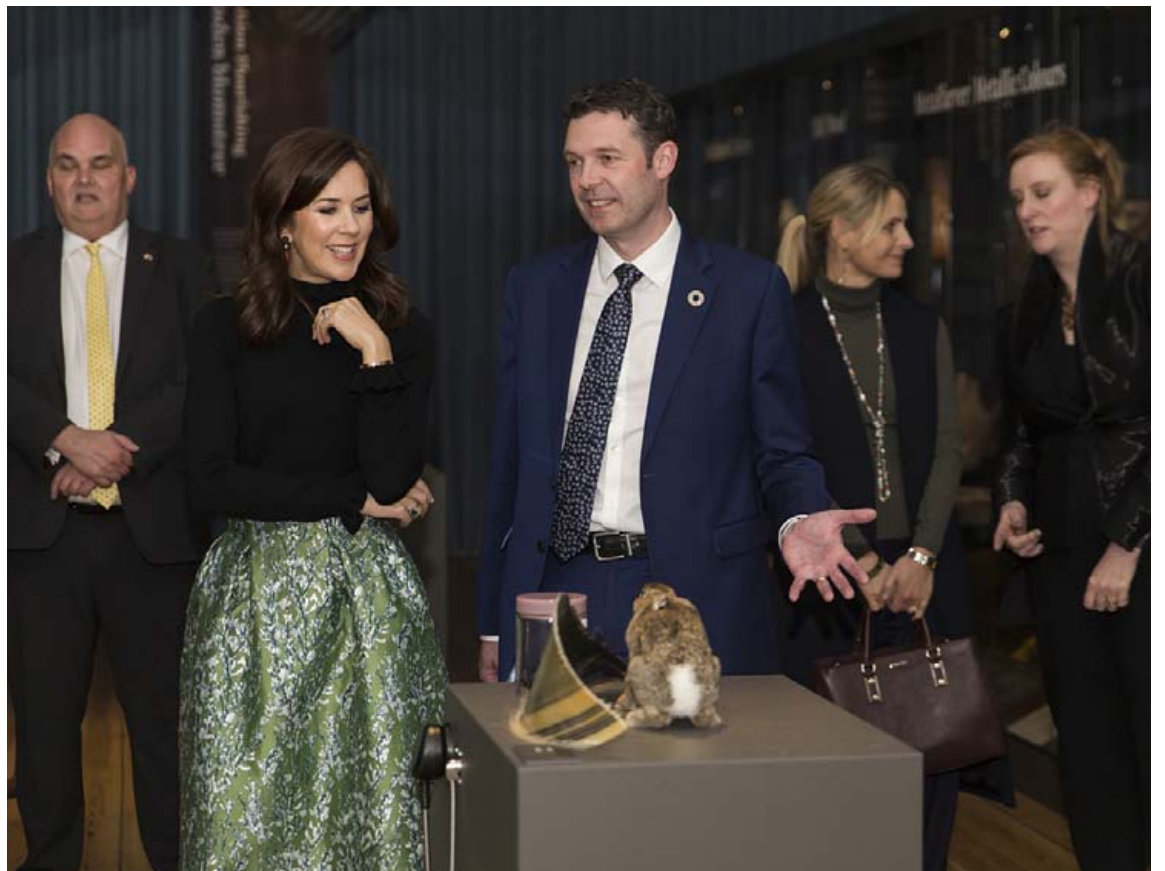
Krónprinsshjónin við opnun sýningarinnar í Náttúruminjasafninu í Kaupmannahöfn.

Á sýningunni er lögð áhersla á notkun náttúrulegra efna í tiskuíðnaði en einnig afleiðingar framleiðsluferla á umhverfið. Neysluvenjur okkar hafa sömuleiðis