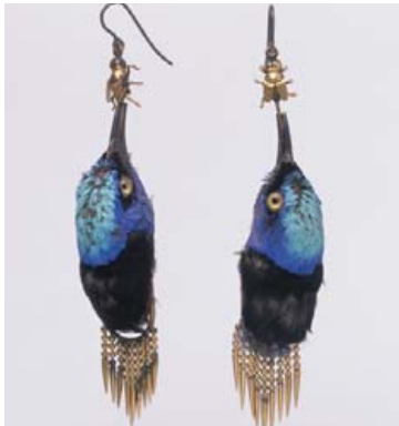
Eyrnalokkar með fuglshöfði frá um það bil 1875.

Erfingjar dönsku krúnunnar, þau Mary prinsessa og Friðrik prins, voru viðstödd opnun sýningarinnar í Naturhistorisk Museum í Kaupmannahöfn þann 13. apríl. Sýningin er byggð á sýningu í Victoria and Albert Museum í Lundúnum sem lauk í janúar og er í fyrsta skipti sýnd utan Bretlands. Glæsilegur og einstakur fatnaður frá helstu söfnum heims er sýndur á sýningunni, meðal annars frá Victoria and Albert Museum. Þá eru til sýnis alls kyns dýr úr náttúruvísindasöfnum sem notuð voru í tiskuskraut eða edalskartgripi. Á sýningunni sem stendur fram í september geta gestir virt fyrir sér meira en 400 ára tiskusögu. Það er því upplagt fyrir Íslendinga sem verða á ferðinni í Köben í sumar að