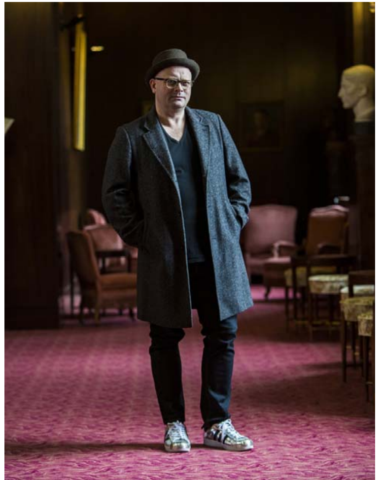
Sand-frakkinn er úr Herragarðinum og silfurskórnir frá Adidas. Hatturinn er fyrsti pork pie-hattur Karls, keyptur í London fyrir nokkrum árum.

Ég er nýbúinn að fá mér geggjúð gleraugu frá Barton Perreira sem gera mig að betri manni. Svo hef ég hugsað mér að ganga með hring eftir brúðkaupið í sumar!