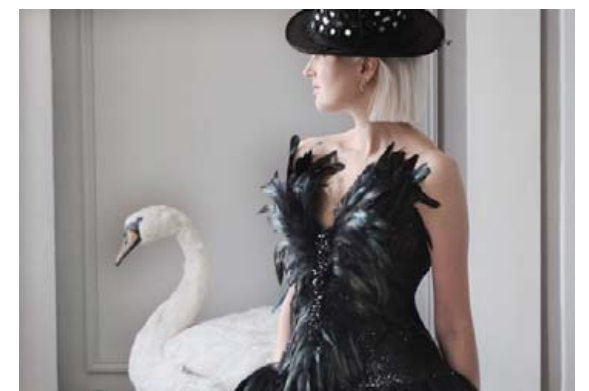
Black Moon eftir Ann Wiberg. MYND/ANDERS DRUD JORDAN, STATENS NATURHISTORISKE MUSEUM Í KAUPMANNAHÖFN

afleiðingar fyrir fjölbreytni dýra- og plöntutegunda á jörðinni. Á sama tíma er fagnað hvernig tiskuhönnuðir notfæra sér innblástur fyrir myndur, form og liti í hönnun sinni. Sýningin gefur sömuleiðis tóninn fyrir sjálfbærari framtíð með nýstárlegum hugmyndum. Samband tísku og náttúru er flókið. Gestir eru beðnir um að skoða vel fataskápin sinn og hvatt er til þess að huga að uppruna fatnaðarins.