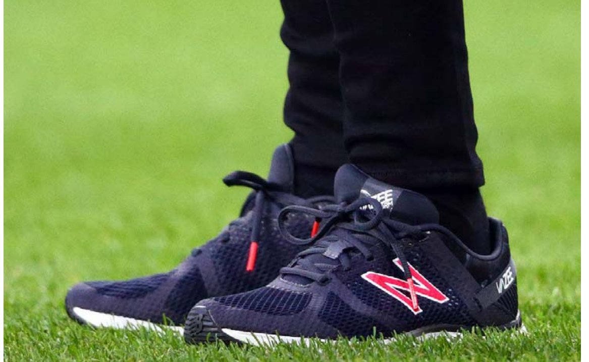
Katrín, hertogaynja af Cambridge, birtist í New Balance-skóm þegar hún lék knattspyrnu við börn á Windsor Park-vellinum í lok mars. Katrín er hrifin af merkinu enda eru skórnir þægilegir og svalir.