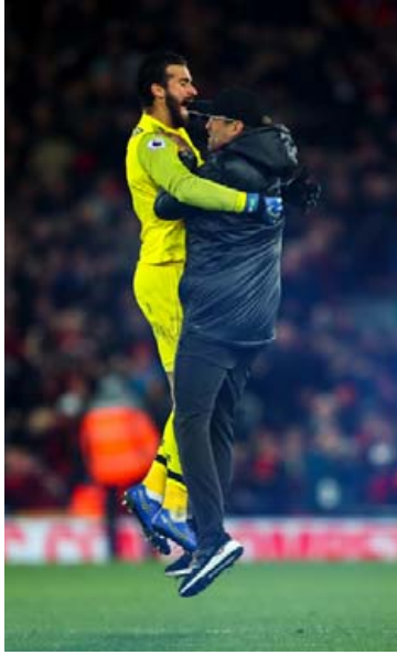
Eitt rosalegasta fagn í ensku deildinni kom þegar Klopp og Allisson markvörður fögnuðu sigurmarki Divock Origi gegn Everton í desember. Hvort skórnir hafi hjálpað til skal ósagt látið.