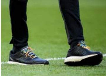
Jurgen Klopp með regnbogareimar gegn Watford í mars.