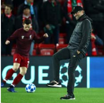
Klopp kikur aðeins út á völlum til að sparka tuðrunni í svörtum skóm.