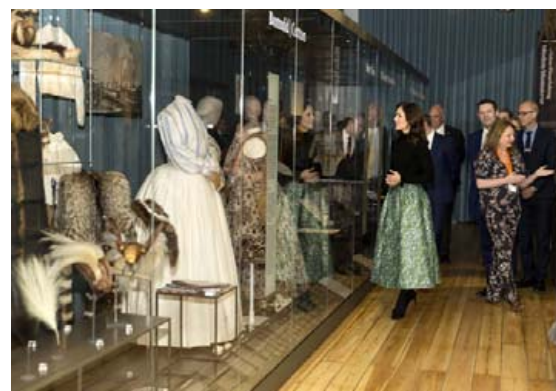
Mary Krónprinsessa virðir fyrir sér safnið þar sem getur að líta sögufræga kjóla og annað skraut.