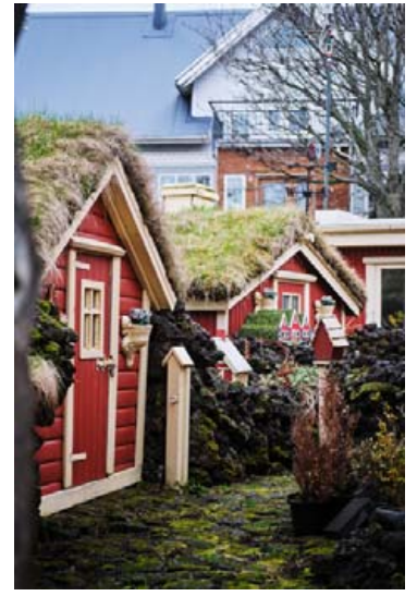
Dagbjartur segir að mikil natni hafi verið lögð í allt húsið og lóðina.

Fólk er kynningarblað sem býður auglýsendum að kynna vörur og þjónustu í forni viðtala og umfjallana. Í blaðinu er einnig hefðbundin ritstjórnarefni. Blaðið fylgir Fréttablaðinu daglega.