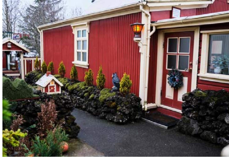
Það er lítið um tilviljanir í garðinum við Austurgötu 31. Hús og annað í stíl.

Dagbjartur bendir á að eignin sé hluti af dánarbúi og að seljandi hafi ekki búið í húsinu og þekki ekki ástand þess um fram það sem kemur fram í opinberum gögnum. Væntanlegir kaupendur eru því hvattir til að skoða eignina vel.