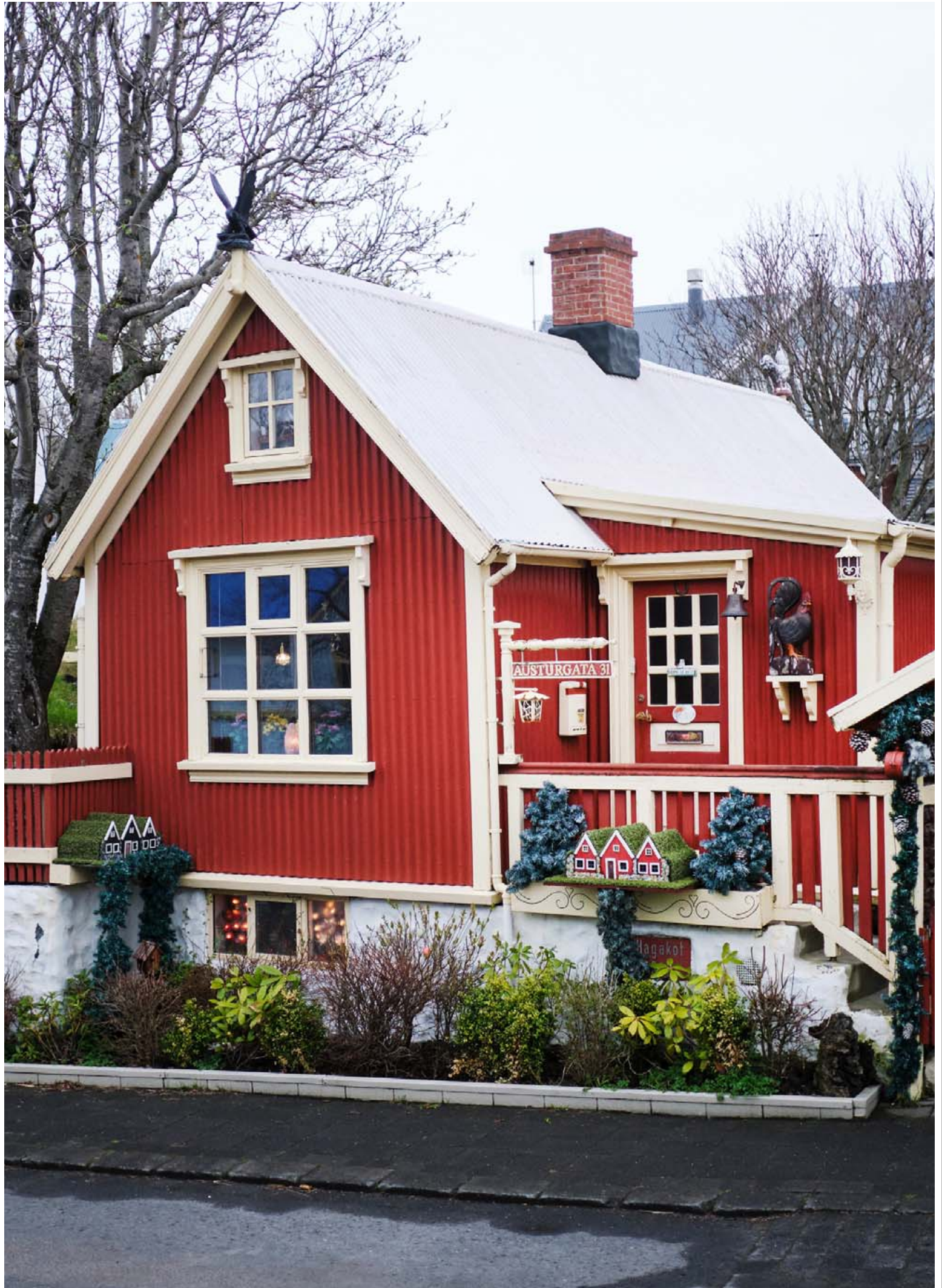
Við Austurgötuna skemmtilegu í Hafnarfirði stendur þetta krúttlega hús sem kemur brosi á hvern þann sem gengur þar fram hjá.