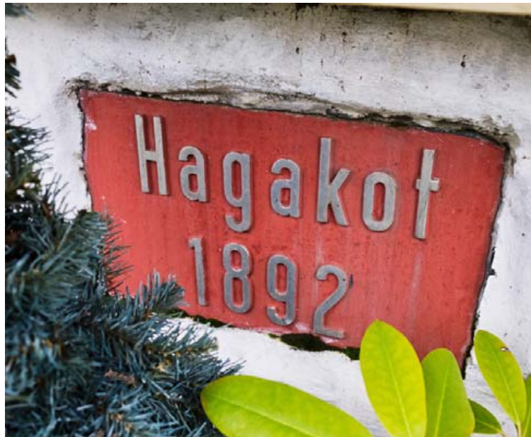
Húsið er byggt árið 1892 og hét þá Hagakot en viðbyggingin kom árið 1997.