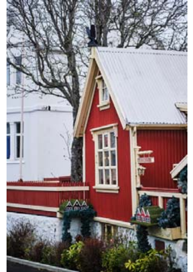
Stíllinn heldur sér meira að segja langt út á götu.