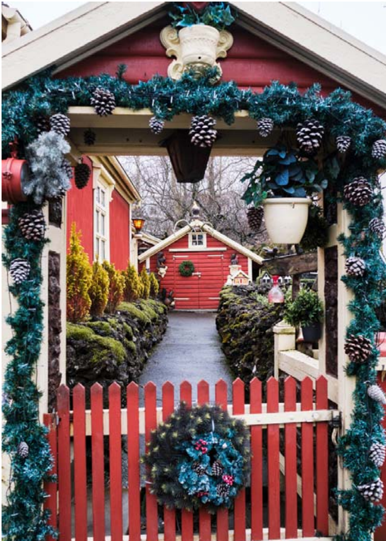
Á lóð hússins eru hraungrýtisveggir sem fyrri eigandi hlóð úr grjóti sem hann flutti heim á kerru. Í garðinum er tjörn og yfirbyggður heitur pottur.