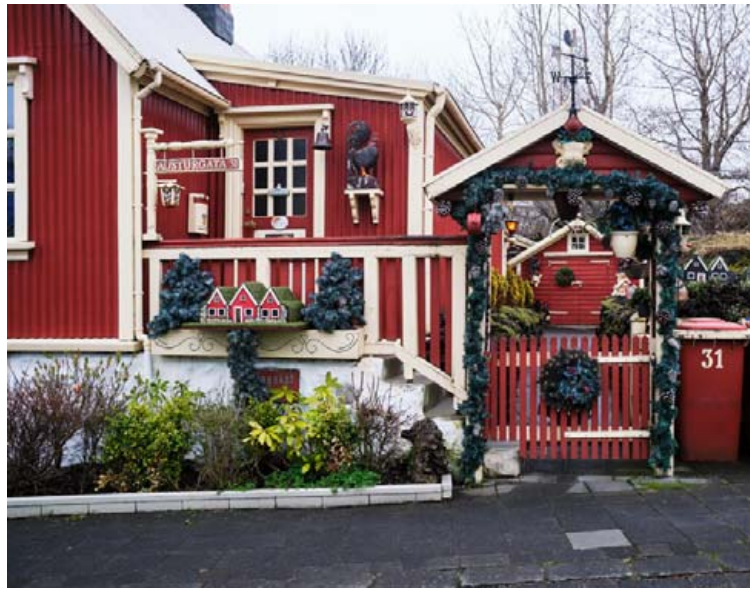
Hlíðið sem svo marga hefur dreymt um að kíkja inn fyrir og skoða.