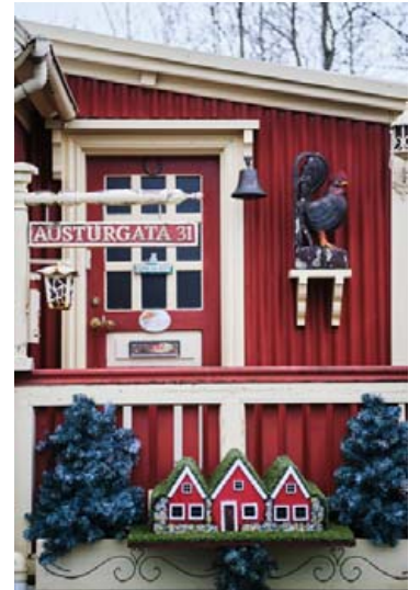
Haninn hefur trúlega séð nokkuð marga morgna á þessum fallega stað sem hann stendur á.