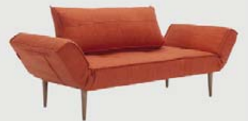
Zeal Svefnbekkur 70x200 cm kr. 79.900