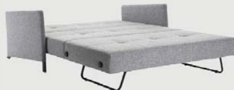
CUBED SVEFNSÓFI MEÐ ÖRMUM STÆRÐ: 154x104/207 CM SVEFNFLÖTUR 140x200 CM KR. 199.800