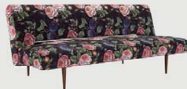
Unfurl 120x200 cm kr. 109.900