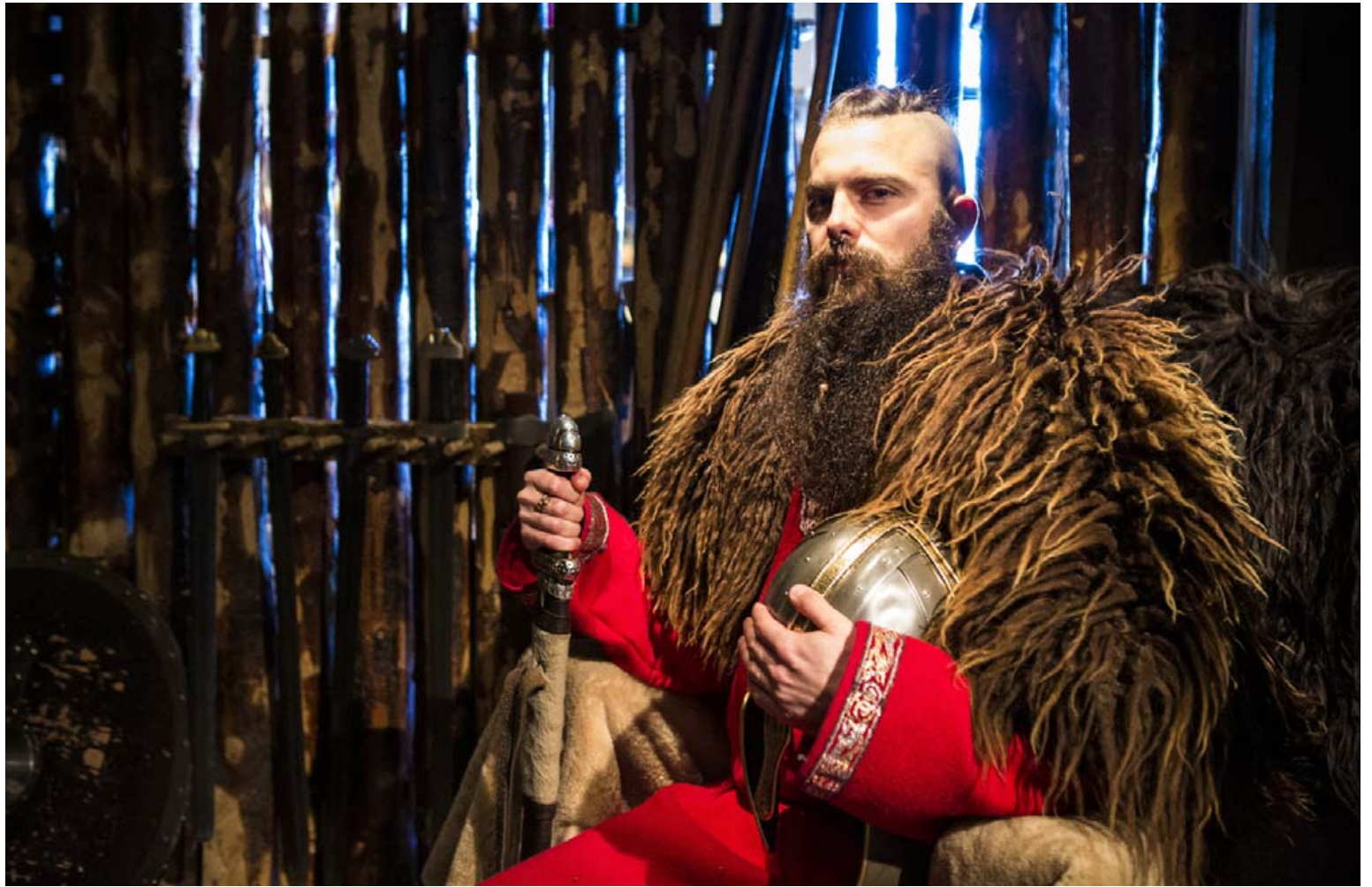
Sögusafnið á Granda blæs í víkingapartýlúðurinn á morgun þegar alþjóðlegi víkingadagurinn verður haldinn hátíðlegur.

„Vikingafélagið Rimmugýgur, sem við erum í góðu samstarfi við, kemur og verður með litinn handverksmarkað þar sem verður hægt að kaupa víkingahandverk. Það verður sérstakt leikjastæði fyrir krakka þannig að börnin geta farið í víkingaleiki eins og börnin á víkingatímanum gerðu. Félagar í Rimmugýgi verða líka með allt dótíð sitt og spila víkingaskák sem kallast hnefatafl sem þeir munu kenna fólki hvernig virkar. Síðan