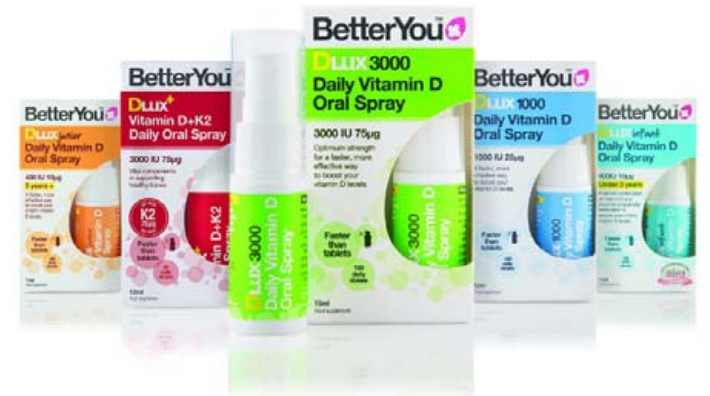
DLúx munnsprey tryggir hámarksupptöku.

eða lifa á norðlægum slóðum þjáist oftast af skorti en aðrir. Í framhaldi af þessu var skoðað hvað það þyrfti mikið magn í daglegri inntöku af D-vítamíni til að hækka gildin hjá þeim börnum sem mældust með skorti. Í ljós kom að stærstur hluti barnanna þurfti að taka 2000 a.e. (alþjóðlegar einingar) af D-vítamíni í 6 mánuði til að ná ásættanlegum gildum en hámarksskammtur fyrir 9 ára og eldri er 4000 a.e. á dag. Þetta segir okkur að ef um D-vítamín skort er að ræða, dugir ekki að taka bara ráðlagðan dags-