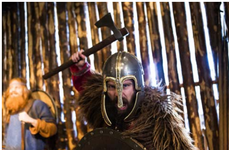
Meðal sýningargripa má nefna Hrafna-Flóka og Egil Skallagrimsson.

„Einnig verður tónlist og leikir en leikjameistari mætir til að sýna krökkunum hvernig víkingabörnin léku sér.“