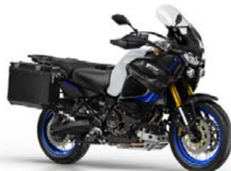
SUPER TÉNÉRÉ RAID