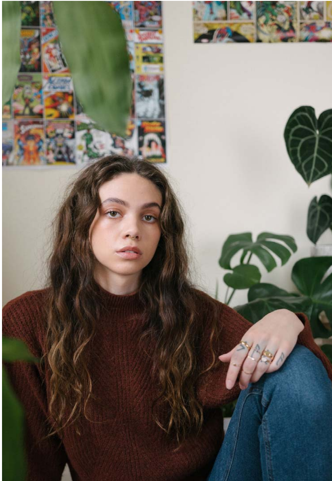
Glowie er á góðum stað í lífinu og segist aldrei hafa verið jafn hamingjusöm og nú.

„Nú er rúmt ár liðið og þetta er nákvæmlega sú sem ég er og hvernig ég lifi lífi mínu í dag. Ég hef