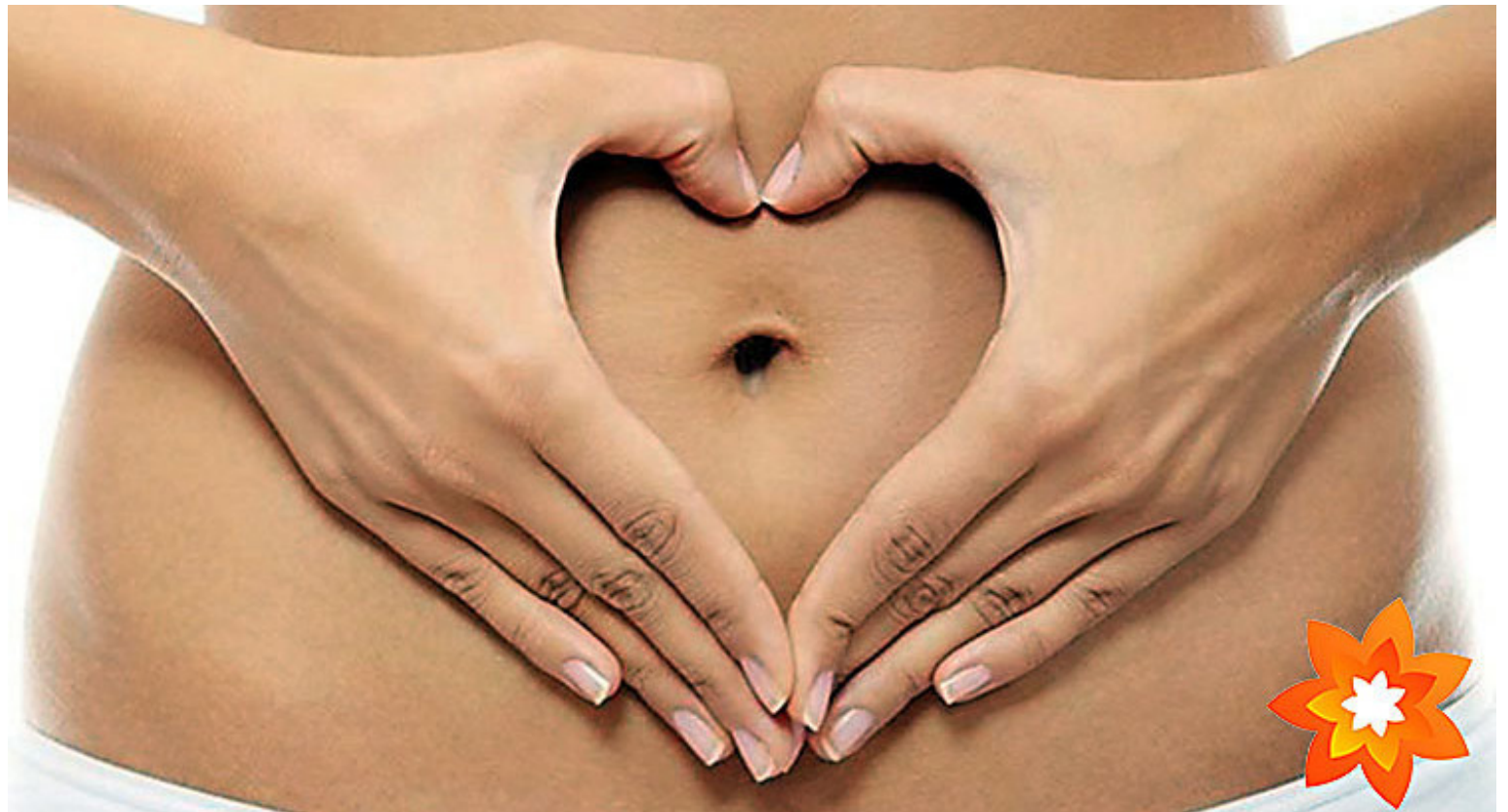
Fjölmargar rannsóknir sýna fram á kosti þess að taka inn Bio-Kult Original gegn hinum ýmsu kvillum.

„Vísindalegum rannsóknum á þarmaflóru okkar manna