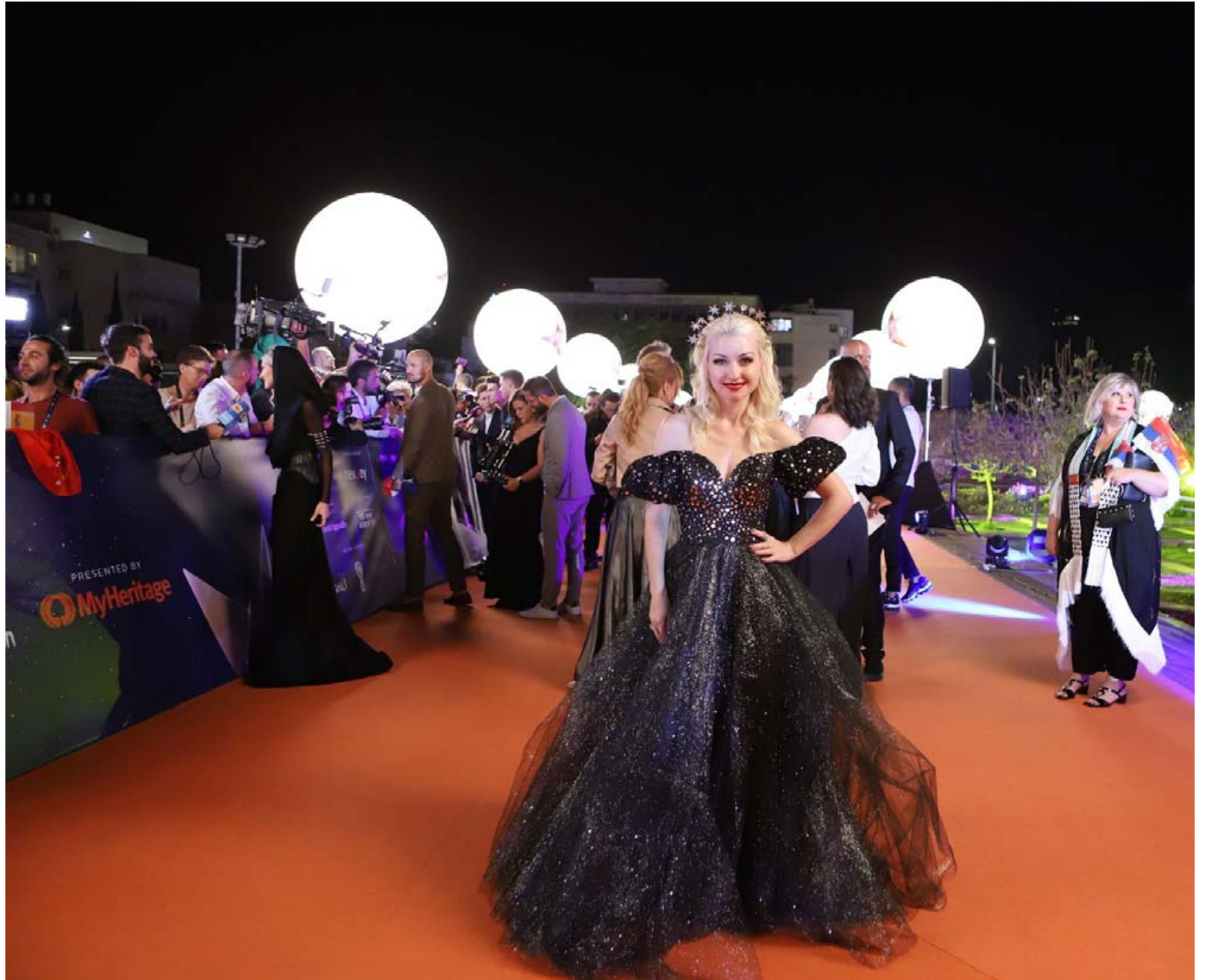
Kate Miller-Heidke var glæsileg á rauða dreglinum á laugardag en hún mun stíga á svið á undan Hatara í kvöld.

Miller-Heidke samdi lagið með manninum sínum en þau hafa unnið lengi saman að tónlist.