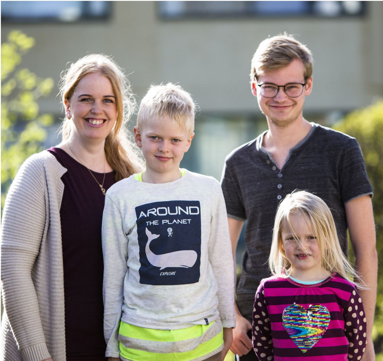
Skiptineminn verður hluti af daglegu lífi fjölskyldunnar. Börnin hafa verið afar hænd að skiptinemasystkinum sínum.