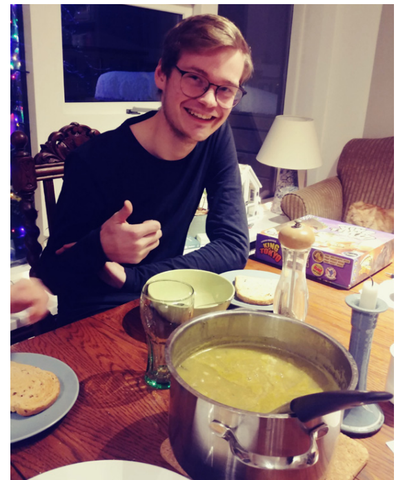
Door er afar lunkinn í eldhúsinu og hefur galdrað fram einstaklega ljúffengar súpur, kjötrétti og kökur á árinu.

Sandra Guðrún Guðmundsdóttir sandragudrun@frettabladid.is