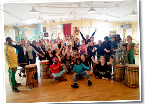
Í Afródans tímunum er dansað í takt við trommuslátt.

unum og þeir fá orku frá okkur, það á sér alltaf stað eitthvert samtal þarna á milli." Eina undantekningin eru Afró workout, tímar sem eru haldnir á laugardögum og eru aðeins ódýrari.