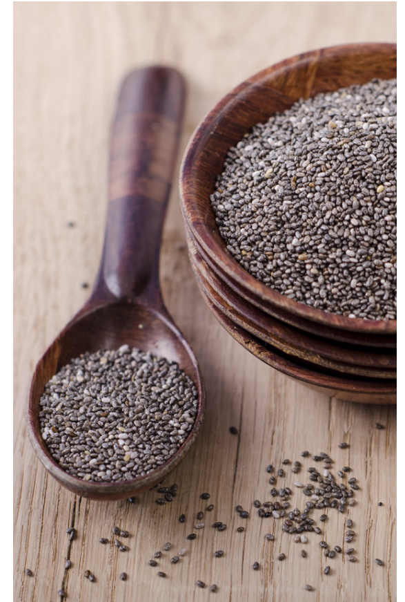
Chia-fræ eru ein vinsælasta heilsufæða um heim allan.

Banar eru frábær viðbót út í grautinn, jógúrtið, múslið og hræringinn.