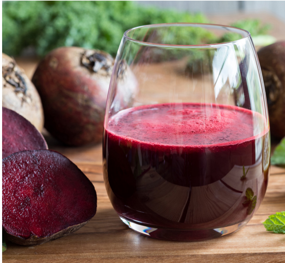
Gott er að drekka rauðrófusafa 2-3 tímum fyrir æfingu.

Chia-fræ eru einstaklega næringarrík fæða og flokkast sem ofurfæða. Þessi agnarsmá fræ eru orðin ein vinsælasta heilsufæða um allan heim. Þau eru rík af omega-3 fitusýrum, andoxunarefnum, próteínum, aminosýrum og auðmeltum trefjum. Chia-fræin er mjög saðsöm og orkan úr þeim fer hægt út í líkamann, sem heldur því blóðsykrinum stöðugum og veitir líkamsorkunni meira jafnvægi. Þar af leiðandi eru chia-fræin frábær fæða fyrir íþróttafólk. Líkt og með rauðrófurnar eru chia-fræ ekki bara ætluð íþróttafólki en fræin get haft einstaklega góð áhrif á heilsu allra. Þau stuðla að heilbrigðari húð, draga úr öldrun, styðja hjarta og meltingarveginn og styrkja beinin.