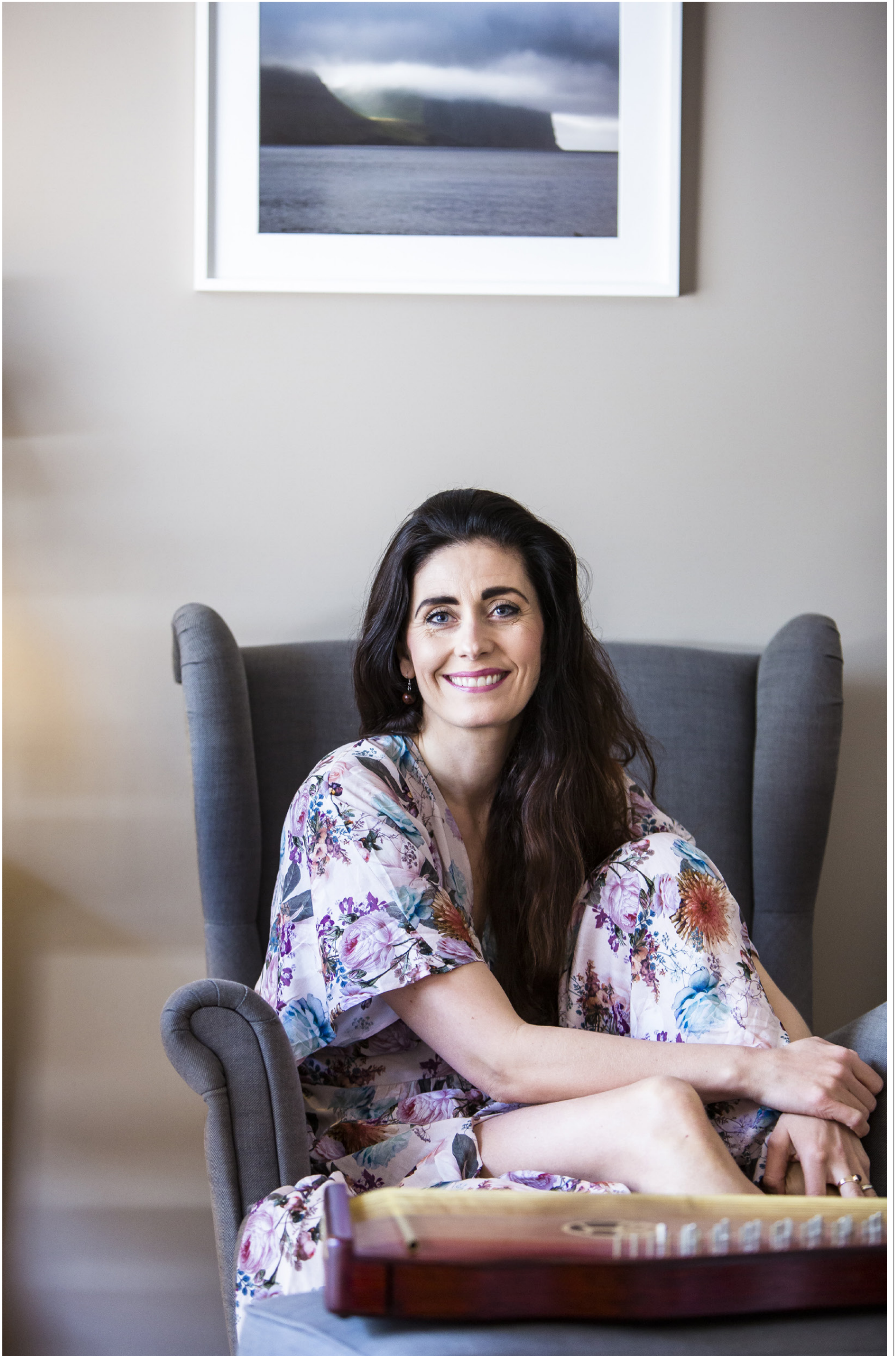
Laufey í stofunni heima. Fyrir ofan hana hangir ljósmynd sem var brúðkaupsgjöf og er eftir Önnu Mariu Sigurjónsdóttur.