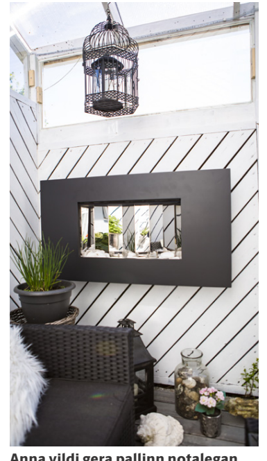
Anna vildi gera pallinn notalegan enda nota hjónin hann mjög mikið.