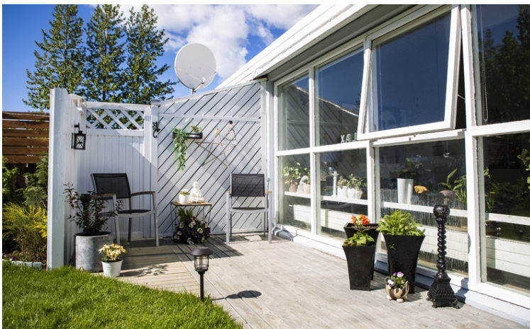
Það eru nokkur góð horn í garðinum þar sem er hægt að hafa það notalegt.