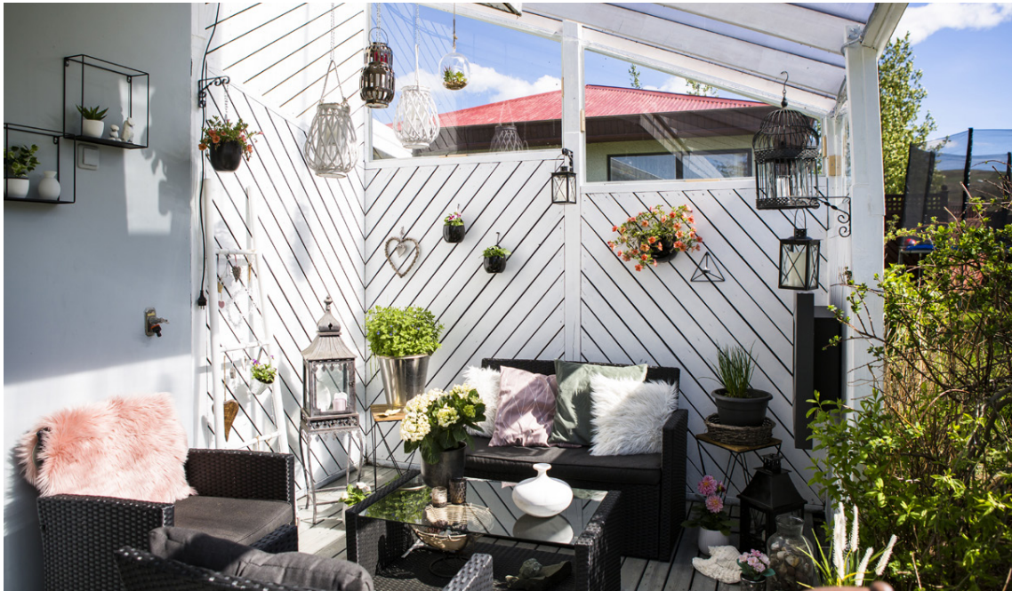
Pallurinn er framlenging af stofunni og er mikið notaður eftir að byggt var yfir hluta hans.

Þau hjónin hafa verið að stækka pallinn hjá sér og byggðu yfir hann að hluta. „Í framtíðinni ætlum við