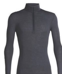
Everyday hálfrennd herra 10.990 kr.

Smíðjuvegur 8, Græn gata 200 Kópavogi, sími: 571 1020 www.ggsport.is