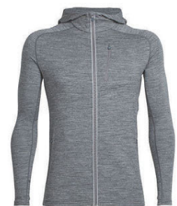
Quantum rennd hettupeysa herra 23.990 kr.