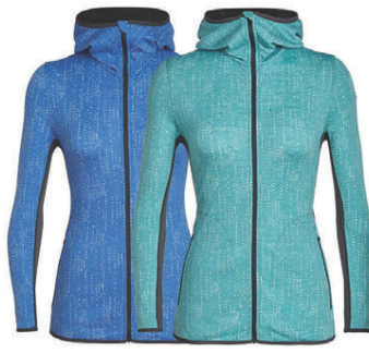
Away rennd hettupeysa dömu 25.990 kr.