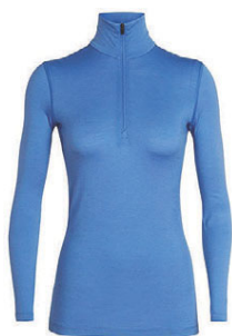
Oasis hálfrennd dömu 13.990 kr.