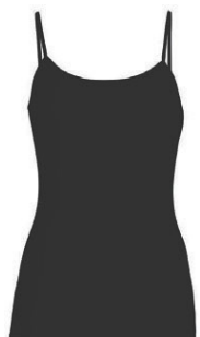
Everyday Cami dömu 6.990 kr.