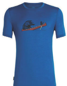
Tech Lite herra 9.990 kr.