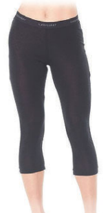
Oasis Legless dömu 10.990 kr.