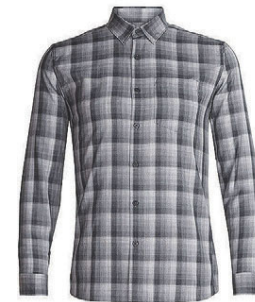
Departure skyrtta herra 18.990 kr.

Icebreaker Merino ull - fyrir alla þá sem vilja hlýjan ullarfatnað sem stingur ekki og dregur ekki í sig lykt.