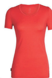
Tech Lite dömu 9.990 kr.