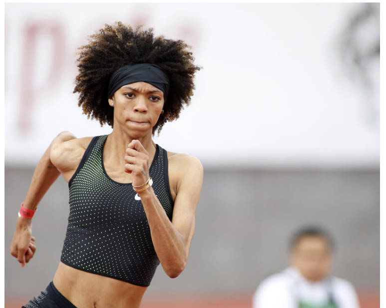
Íþróttatoppur eru ómissandi á æfingum og í keppnum.

Stundum var ég í tveimur íþróttatoppum, með púðum og böndum til að geta liðið þægilega. Ef ég gleymdi toppnum var ekki séns að ég gæti tekið þátt.