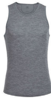
Anatomica Rib Tank herra 7.990 kr.