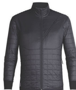
Helix jakki herra 31.990 kr.