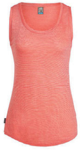
Sphere Tank dömu 8.490 kr.