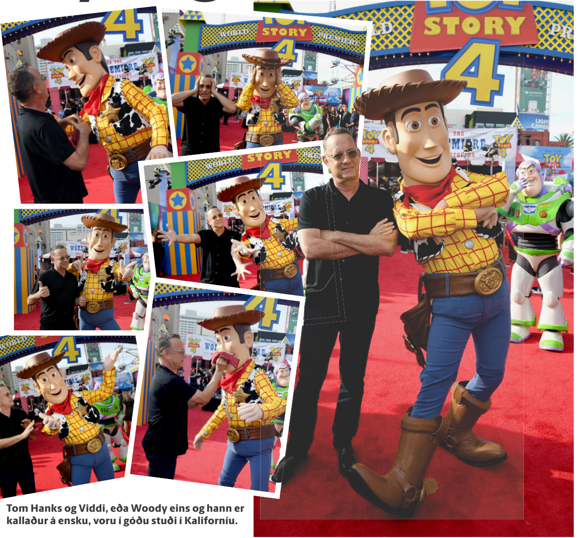
Tom Hanks og Viddi, eða Woody eins og hann er kallaður á ensku, voru í góðu stuði í Kaliforníu.