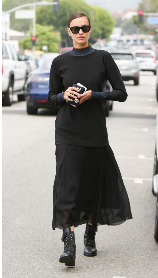
Róleg á götum Los Angeles þar sem þau hjónakornin bjuggu. Í öllu svörtu en samt svo falleg eins og alltaf.