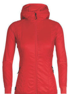
Helix jakki m/hettu dömu 34.990 kr.