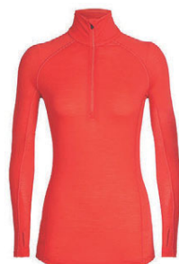
Zone hálfrennd dömu 11.990 kr.