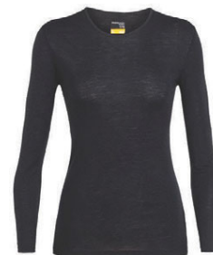
Everyday Crewe dömu 9.990 kr.