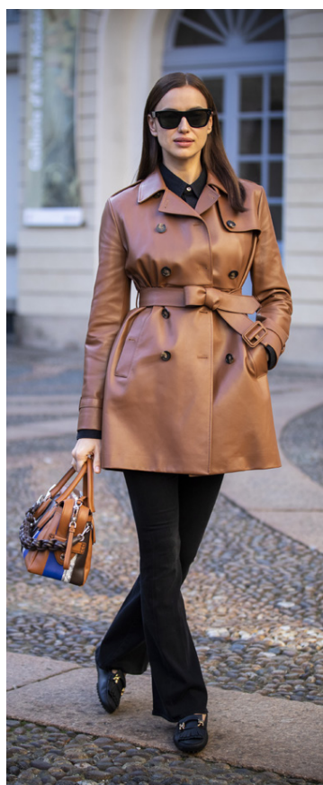
Eftir tiskuvíkuna í Milanó skellti hún sér aðeins út í borgina í þessum lekkera ljósbrúna leðurjakkka.