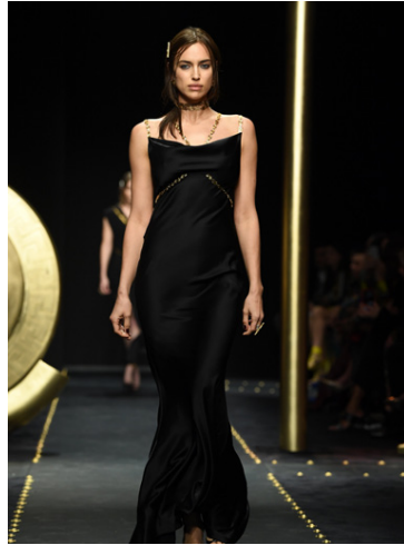
Á tiskupallinum í Milanó þar sem hún sýndi fyrir Versace og vakti eðlilega mikla athygli.

Íslandsvinurinn Irina Shayk hefur gengið eftir tiskupöllum í fjölmörg ár enda talin vera ein fegursta kona heims og með puttana á tiskupúlsinum.