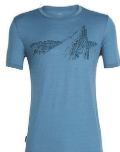
Tech Lite herra 10.990 kr.