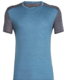
Amplify herra 9.990 kr.