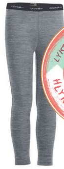
Oasis Leggings barna 5.990 kr.