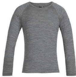
Oasis Crewe barna 5.990 kr.