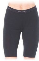
Zone Short dömu/herra 7.990 kr.