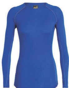
Zone Crewe dömu 9.990 kr.