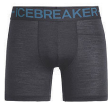
Anatomica Zone Boxers herra 6.590 kr.