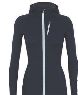
Quantum rennd hettupeysa dömu 23.990 kr.

Fjölbreytt úrval lita og mismunandi þykktir