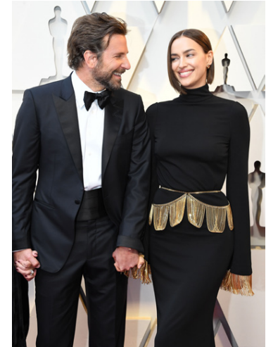
Bradley Cooper og Irina Shayk virtust hamingjusöm þegar þau komu á Óskarsverðlaunahátíðina í febrúar. En nú er úti ævintýri og leitaði hún sér huggunar hér á landi.