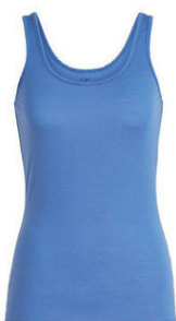
Siren Tank dömu 6.990 kr.