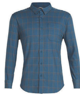
Compass Shirt herra 19.990 kr.