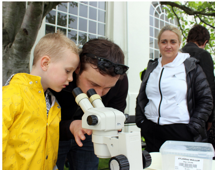
Þödduskoðun með viðsjá.