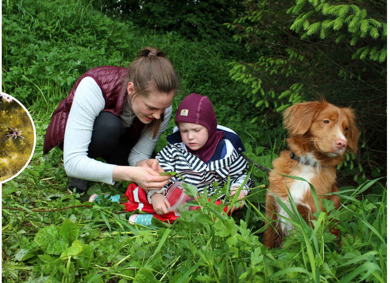
Skordýraskoðun er fyrir alla fjölskylduna.

Það eru alltaf að berast ný skordýr sem verða húsdýr. Þau koma yfirleitt með matvöru og eru oftast ekki hættuleg.