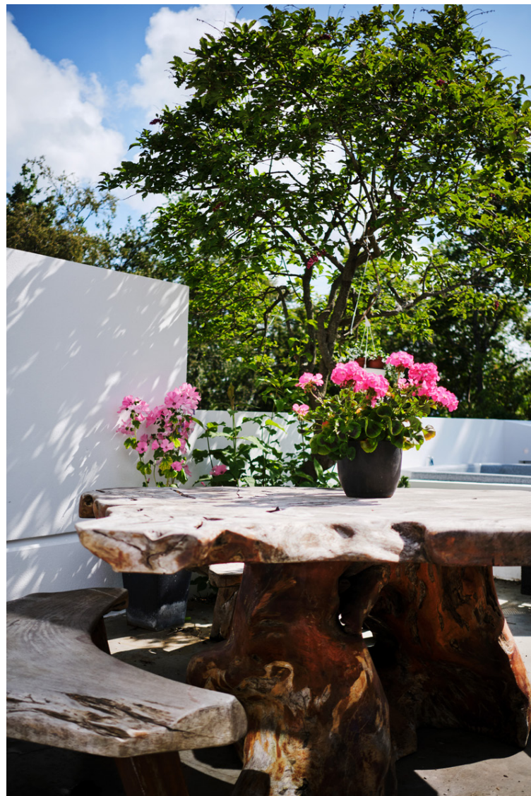
Garðsettið keypti Þórunn notað en það var flutt inn frá Tailandi. Það er niðrþungt og hefur Þórunn því lofað hjálpuðum vinum sínum að flytja ei meir.

stuttri fræðslumynd sem hún fékk líka styrk til að gera. „Það verður því mikið að gerast í mömmu- og pabbastólunum á næstunni," segir Þórunn og hlær sínum dillandi hlátri.