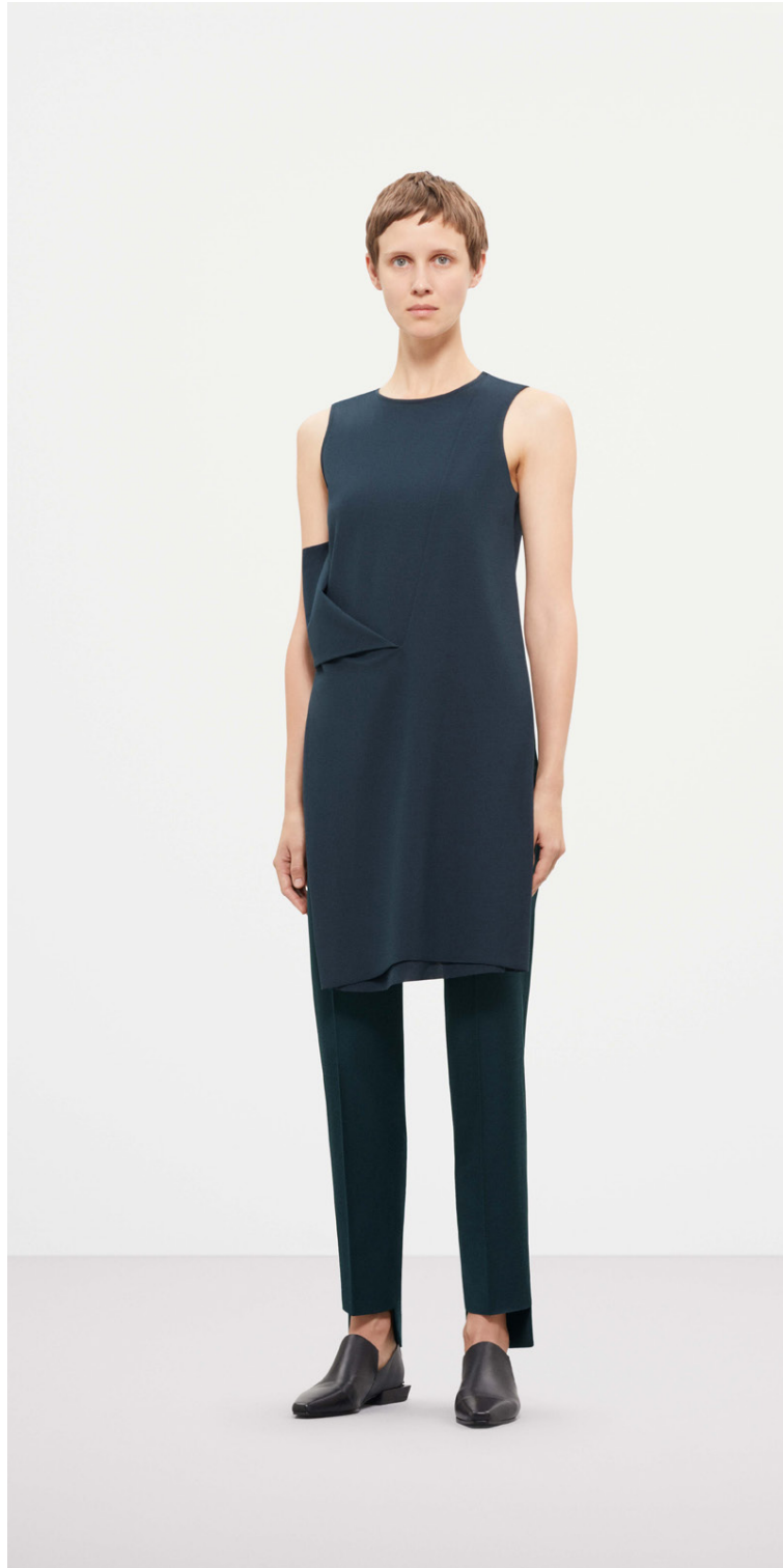
Mildir tónar og einfaldar litapallettur einkenna flestar flikur frá COS.

Við fáum innblástur frá arkitektúr, hönnun, list og náttúrunni. Við erum stöðugt að leita að hugmyndum frá hröðum heiminum í kringum okkur þar sem við sækjum listasöfn, sýningar og skoðum fallegar byggingar. Þegar teymið hefur sankað að sér innblæstri og hugmyndum þá förum við yfir það í sameiningu og myndast fara að myndast fyrir komandi línur. Í kjölfarið hefst svo hönnunarferlið.