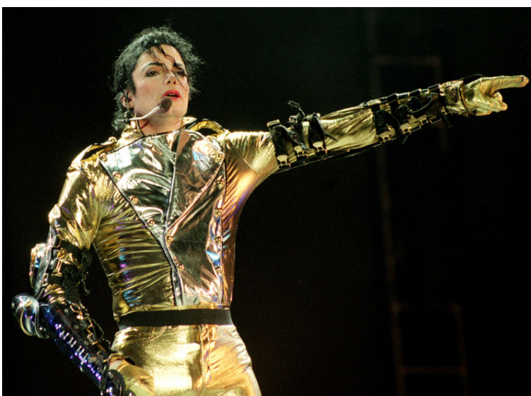
Kóngurinn í gulli að syngja á sviði í Ástralíu 1996.

Superbowl-frammistaða hans árið 1993 er ekkert minna en góðsagnakennd. Ótrúleg í alla staði. Íklæddur svörtum jakka-fötum með gull-slegna borða.