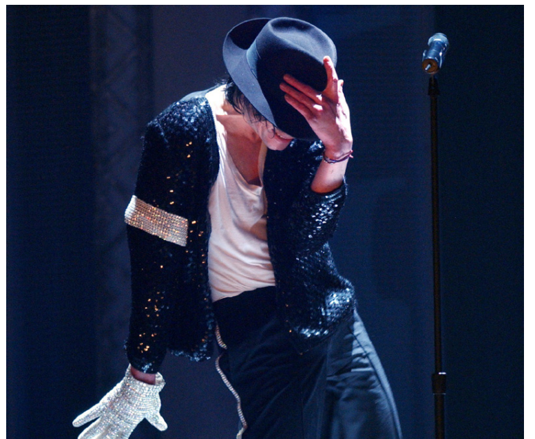
Hatturinn, jakkinn og hvítur rifinn bolur undir. Lúkk sem lifir góðu lífi.