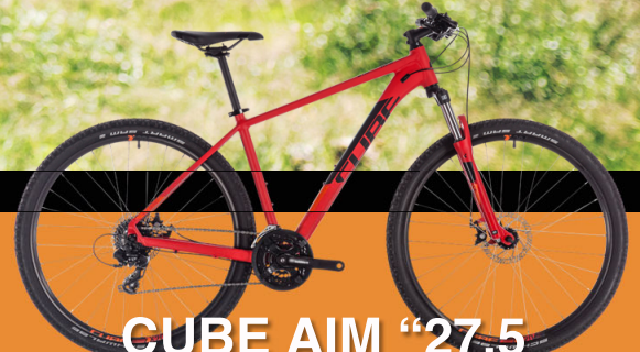
CUBE AIM "27.5"