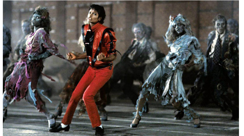
Rauði jakkinn úr Thriller er enn flottasti rauði jakki sem gerður hefur verið.

25. júní lést Jackson á heimili sínu í Beverly Hills.