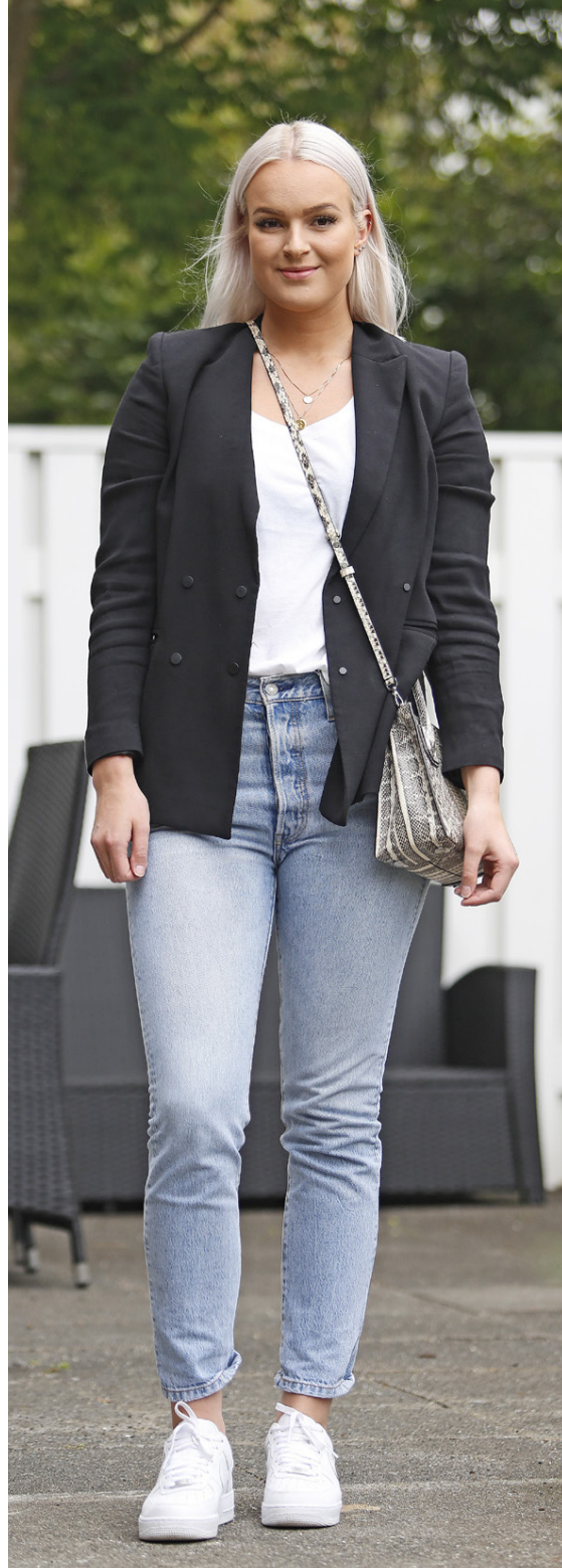
Kjöll úr 17, jakki úr Lindex og skór úr Air. Svartur blazerjakki úr Mango, Levi's-buxur og taska frá Michael Kors.