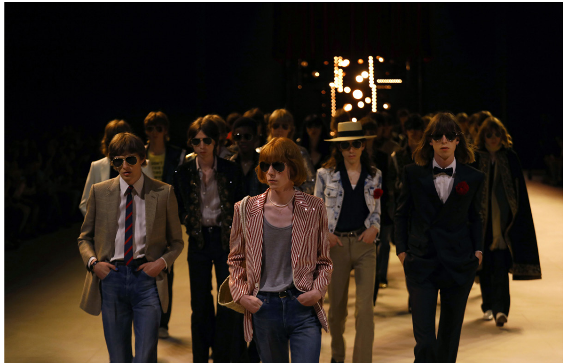
Fyrirsæturnar á sýningarpallinum á sýningu Celine tiskuhússins.

Það er óhætt að segja að París sé þekktasta tiskuborg í heimi og því er mikill heiður að fá að sýna hönnun sína á þessum stórvíðburði.