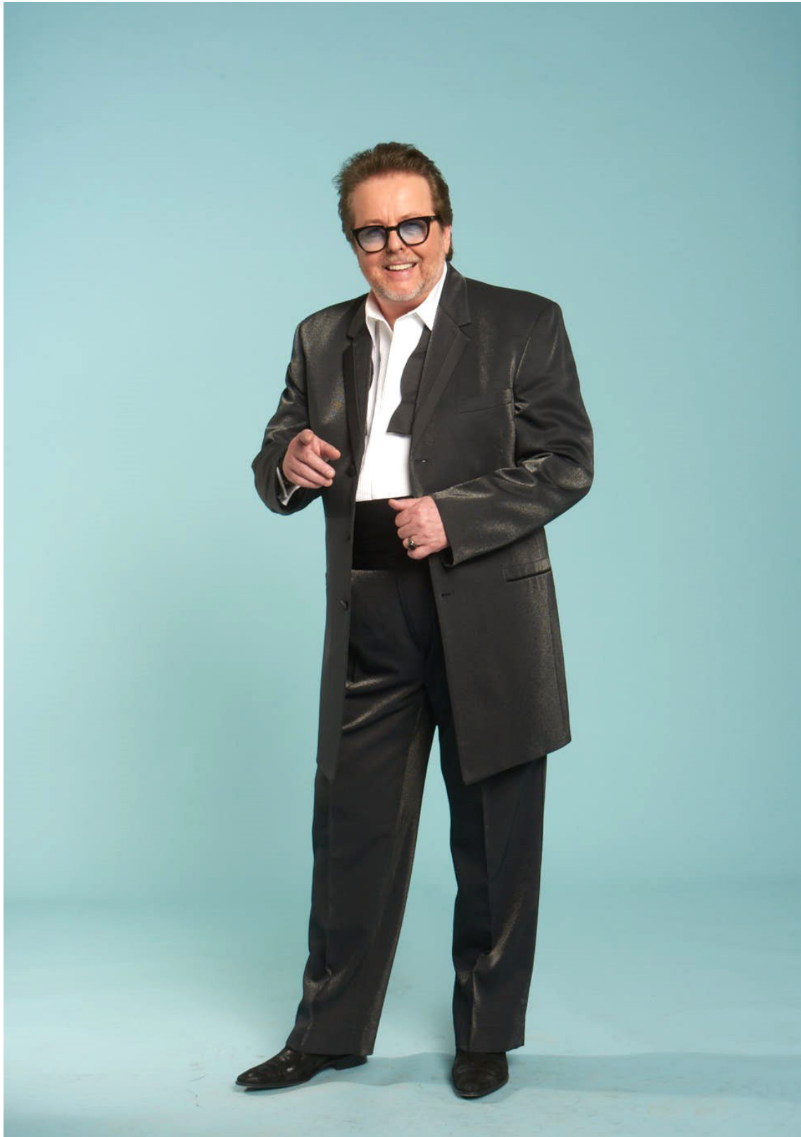
Björgvin er hin eina sanna poppstjarna Íslands. Í september verða 50 ár frá popphátíðinni í Laugardalshöllinni.