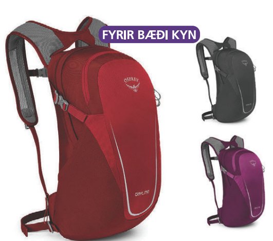
Daylite Alhliða bakpoki 9.990 kr.