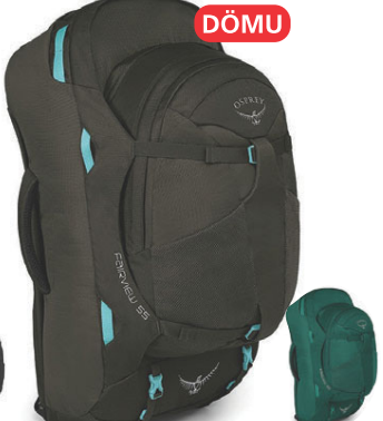
Fairview 55L Heimsreisubakpoki 28.990 kr.