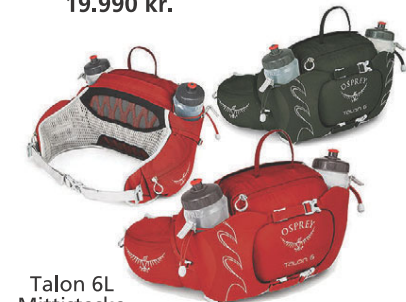
Talon 6L Mittistaska 12.990 kr.