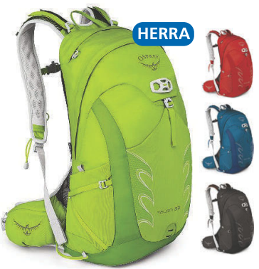
Talon 22L Léttur göngubakpoki 19.990 kr.