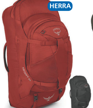
Farpoint 55L Heimsreisubakpoki 28.990 kr.