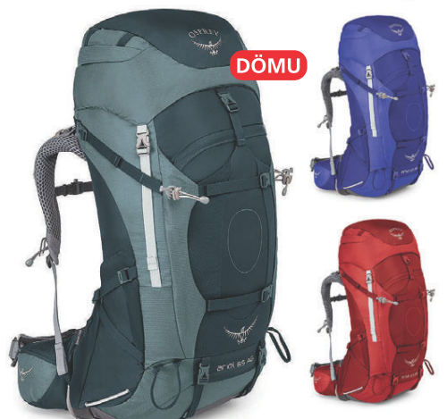
Ariel 65L Burðarbakpoki 43.990 kr.