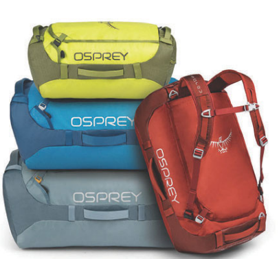
Transporter dufflar Verð frá 21.990 kr.