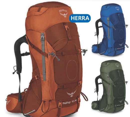
Aether 70L Burðarbakpoki 43.990 kr.