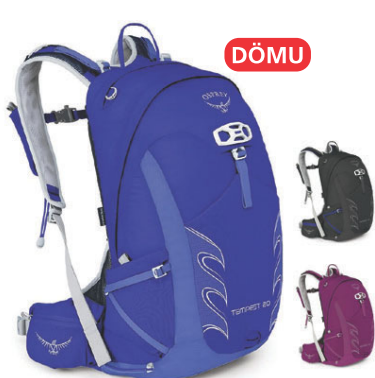
Tempest 20L Léttur göngubakpoki 19.990 kr.