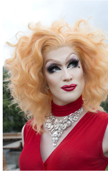
Stærsti áhorfendahópur Drag-Súgs er ungar konur.

Gógó hefur fundið fyrir því að viðhorf almennings til drags hefur breyst mikið. „Fólki fannst þetta vera bara eitthvert kynferðislegt partístand til að byrja með. Maður