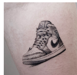
Nike-skór eftir Brynjar er gott dæmi um fingerðan stíl húðflúra sem verður æ vinsælli.