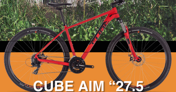
CUBE AIM "27.5"