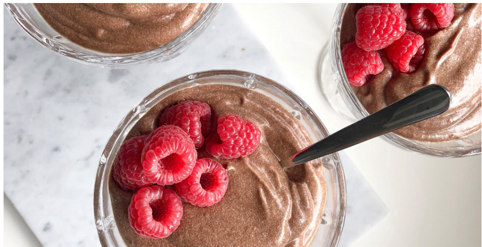
Avokadó-súkkulaðimús sem hefur slegið rækilega í gegn.