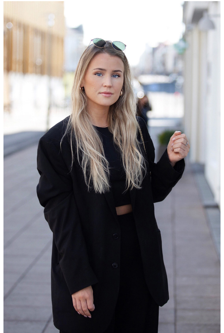
Hildur er dugleg að deila ýmsum uppskriftum á bloggsíðunni Trendnet.