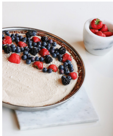
Einstaklega falleg og ljúffeng hráfæðiskaka.