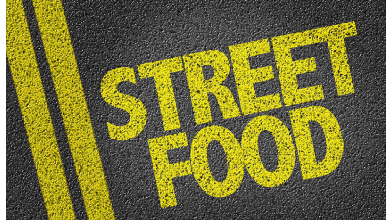
Mikið úrval og góð stemning á Miðbakknum um helgina.

Fritt er inn á hátíðina og allir velkomnir.