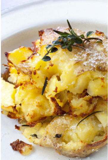
Æðislegar parmesan kartöflur með grillmatnum um helgina.