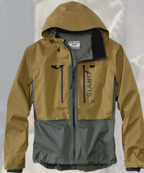
Veiðijakkar mikið úrval