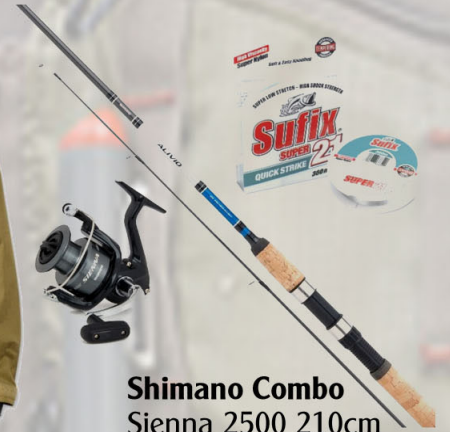
Shimano Combo Sienna 2500 210cm 7fet Junior sett