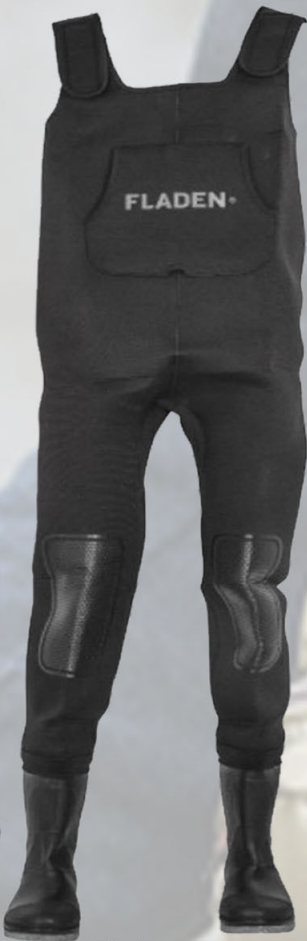
Fladen Neoprene vöðlur