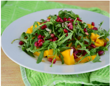
Sumarlegt, hollt og gott salat.

Skerið ávextina í bita, setjið allt í blandara og maukið. Neytið strax.