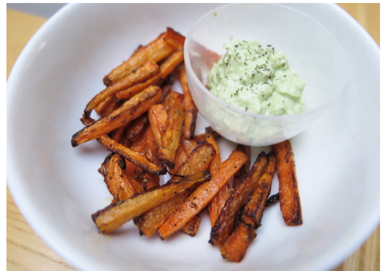
Gulrótarfranskar ásamt vegan ídýfu.

verið mjög matvönd og foreldrar mínir hafa oft verið í vandræðum með að gefa mér að borða en einmitt þess vegna fannst mér skipta máli að dóttir mín myndi fljótt venjast fjölbreyttri fæðu til að reyna að koma í veg fyrir það,“ segir hún.