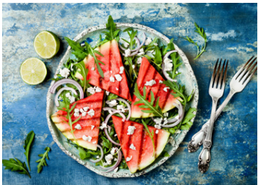
Æðislegt grilluð vatnsmelóna.

Skolið salatið og þurrkið. Skerið mangóið í bita. Ristið möndlurnar. Setjið klettsalat á disk og raðið mangó og berjum. Mega vera alls konar ber, eftir smekk. Dreifið möndlum yfir og loks jógúrt. Í staðinn fyrir möndlur má nota hnetur. Salat er hægt að gera á svo marga vegu ef maður leyfir hugmyndafluginu að ráða.