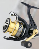
Shimano veiðihjól mikið úrval mikil gæði