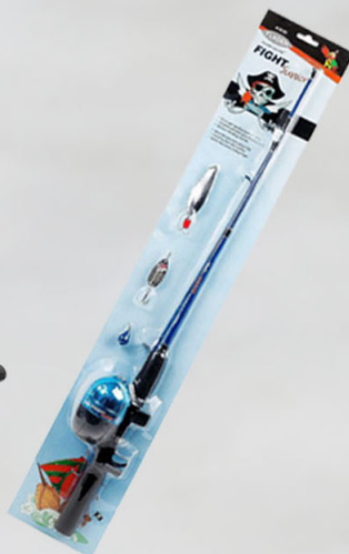
Stöng Lína á hjóli 0,28 mm Lokað kasthjól Spúnn fylgir.