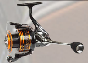
Fladen Maxximus F13 13 kúlulegur Aukaspóla