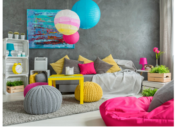
Hér fá litirnir að njóta sín.

alltaf hægt að bæta við litum með því að nota litrík teppi eða púða á sófann, litríkan borðdúk í eldhúsið og setja upp litríkar stytur og skrautmuni í glugga og hillur. Svo er hægt að skella fallega mynstruðu teppi á gólfid. Þá má líka skella upp gardinum í glaðlegum litum eða fjárfesta í litríkum sófa. Svo er um að gera að leita eftir hugmyndum á netinu og leyfa sköpunargleðinni að njóta sín.