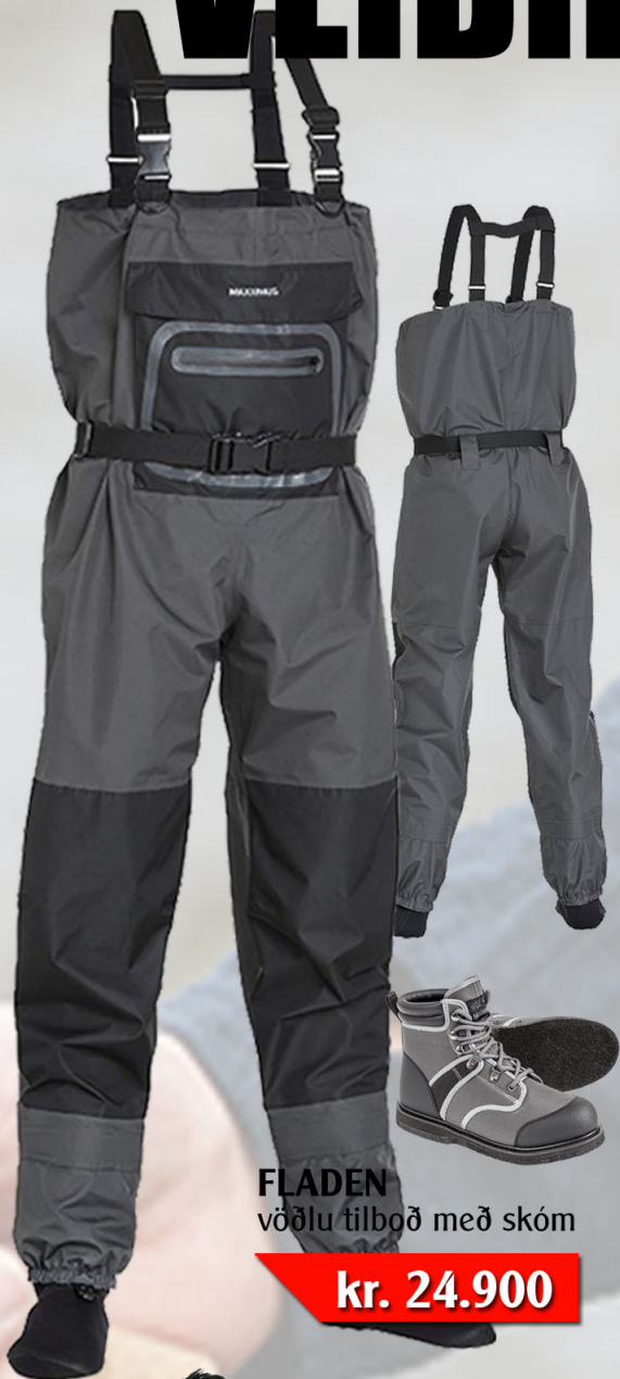
FLADEN vöðlu tilbøð með skóm