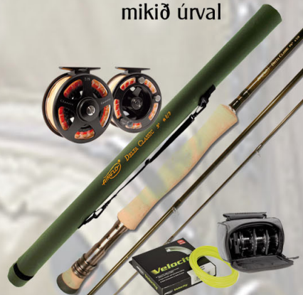
Airflo Delta Classic fluguveiðisett