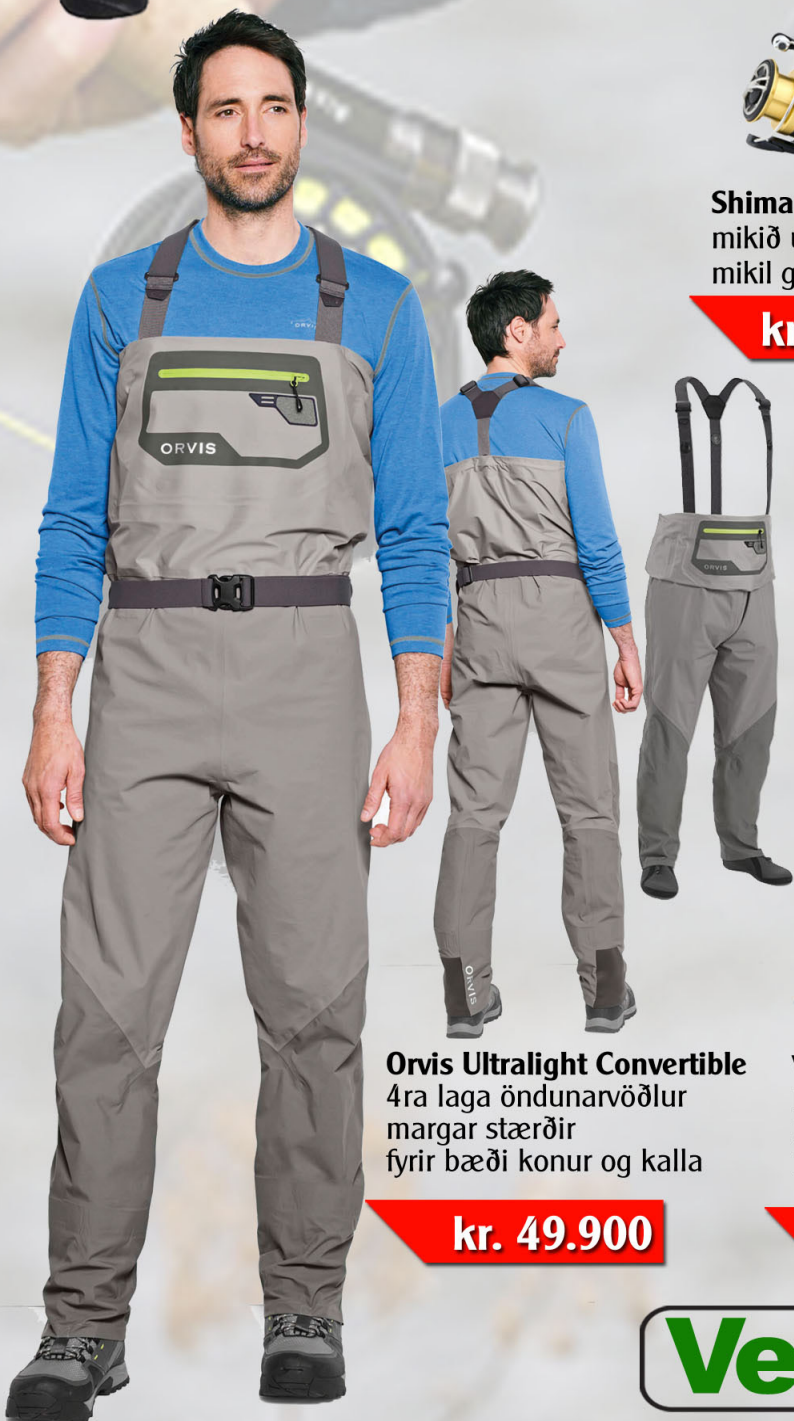
Orvis Ultralight Convertible 4ra laga öndunarvöðlur margar stærðir fyrir bæði konur og kalla