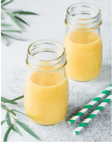
Hressandi drykkur í góðu veðri.