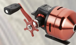
Abu Garcia Abumatic 170i