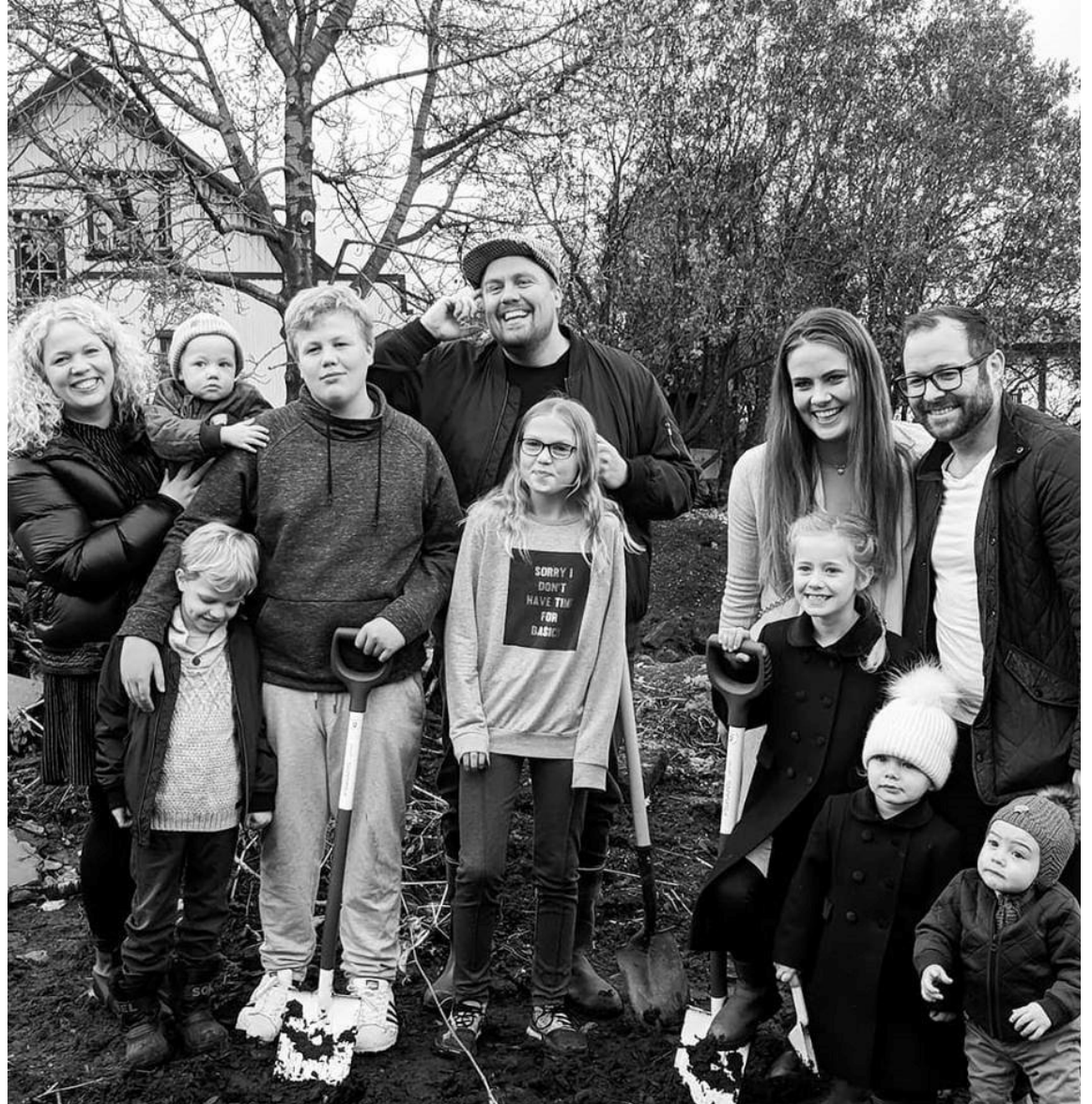
Fjölskyldurnar saman á lóðinni þar sem húsíð mun rísa.