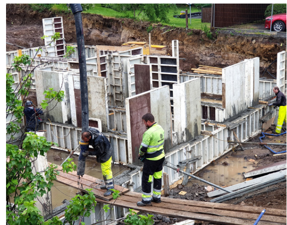
Verktakar að störfum við húsbygginguna.