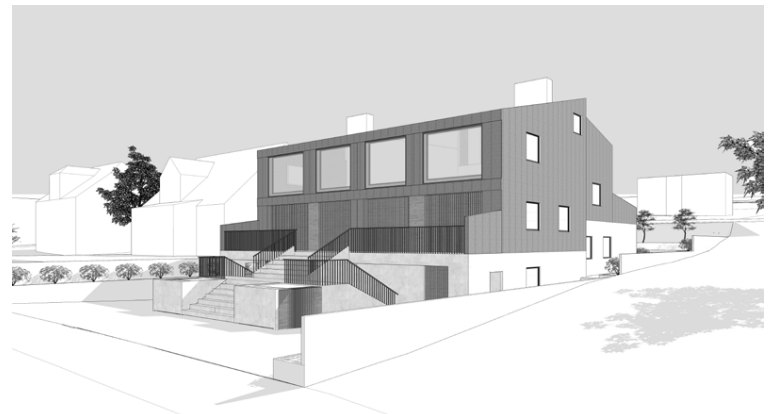
Tölvuteikning af endanlegu útliti hússins. MYND/TRÍPÓLÍ ARKITEKTAR

Fólk er kynningarblað sem býður auglýsendum að kynna vörur og þjónustu í formi viðtala og umfjallana. Í blaðinu er einnig hefðbundin ritstjórnarefni. Blaðið fylgir Fréttablaðinu daglega.