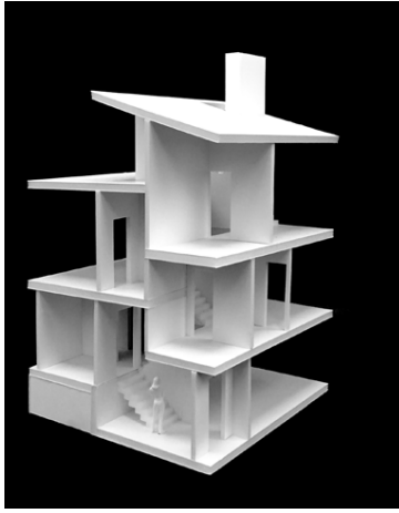
Þrívíddarteikning af húsínu að innan. MYND/TRÍPÓLÍ ARKITEKTAR

„Það er mikið sem þeir spá í sem aðrir gera ekki. Eins og birtuskilyrði til dæmis. Svo eru mjög skemmtilegar stigapælingar inni í húsínu. Það er svo margt sem gerir húsíð okkar sérstakt og að okkar