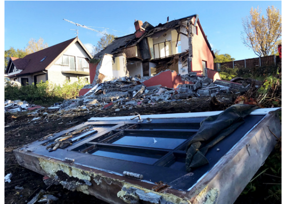
Hér er niðurrífið komið vel af stað.

„Þetta hefur gengið ótrúlega vel. Vinskapurinn er orðinn betri ef eitthvað er og það verður bara geggjað að búa hlið við hlið,“ segir Emíliá.