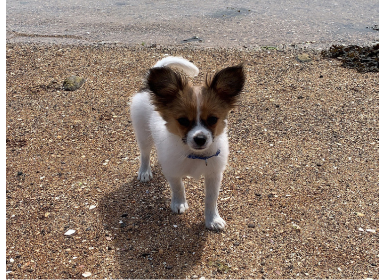
Hundurinn Óliver er nýjasti fjölskyldumeðlimurinn.