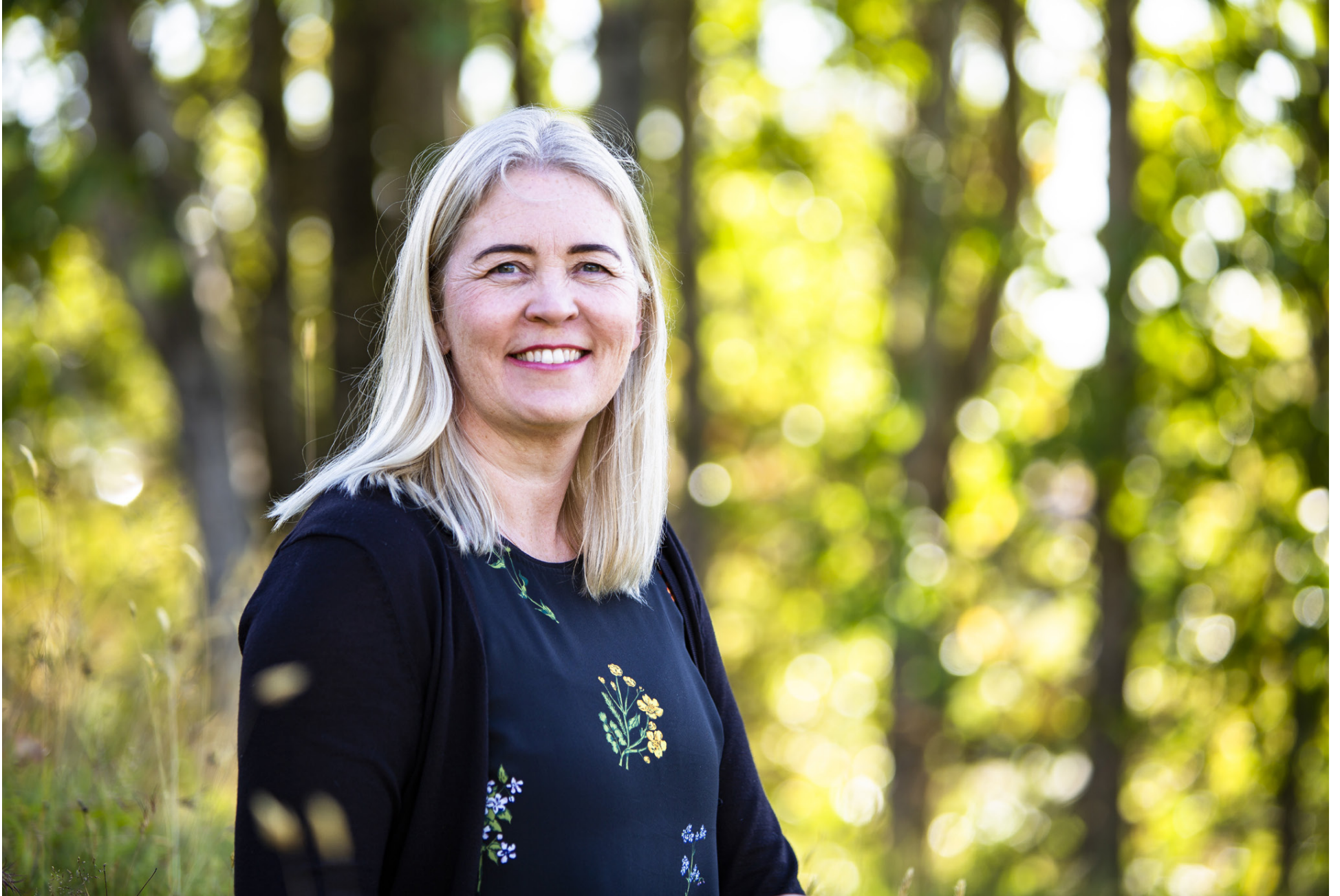
Rakei segir að þegar fólk kynnist styrkleikum sínum átti það sig betur á því hvernig sé best hægt að nýta þá.