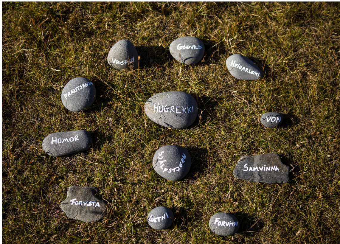
Í næstu viku fer af stað nýtt námskeið með áherslu á styrkleika mannsins. Styrkleikarnir sem hafa verið skrifaðir á þessa steina eru einungis hluti af þeim fjölmörgu sem mannfólkið býr yfir.

„Námskeiðið tengir saman styrkleika okkar og núvitundarþjálfun á skemmtilegan hátt, sem styður okkur í að springa út og blómstra, bæði í einkalífinu og starfi. Það er aldrei of seint að