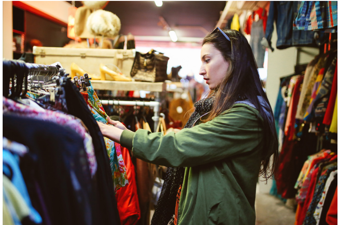
Úrval verslana með notaðan fatnað hefur aukist.