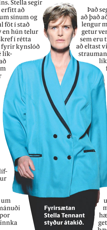
Fyrirsætan Stella Tennant styður átakið.

Ef fólk kaupir minna af nýjum fötum er minna framleitt af þeim og færri flikur enda sem landfylling. Plastagnir úr gerviefnum eins og pólýester enda síður í sjónum og skaða lífríkið þar. Það er því um að gera að hugsa sig tvisvar um áður en ný fót eru keypt. Er það virkilega þess virði? Það er spurning sem fólk mætti gjarnan spyrja sig að.