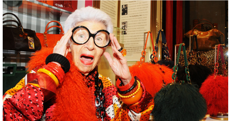
Tiskudrottningin Iris Apfel, sem hélt upp á 98 ára afmælið um helgina, er ein þeirra sem hafa mótað afatísku.