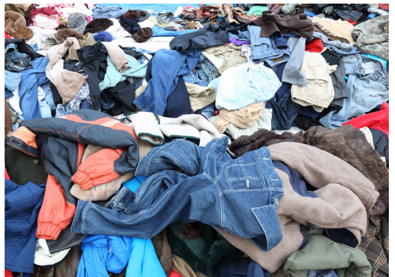
Gífurlegt magn af fötum endar sem landfylling ár hvert.

Til að minnka fatakaup er mikilvægt að nota hverja flik lengur og gera við flikur í stað þess að henda þeim. Áætlaður líftími hvers flikur er 2,2 ár. Með því að lengja líftímann um ekki nema þrjú mánuði myndi kolefnisspor hvers flikur minnka um 5-10%.