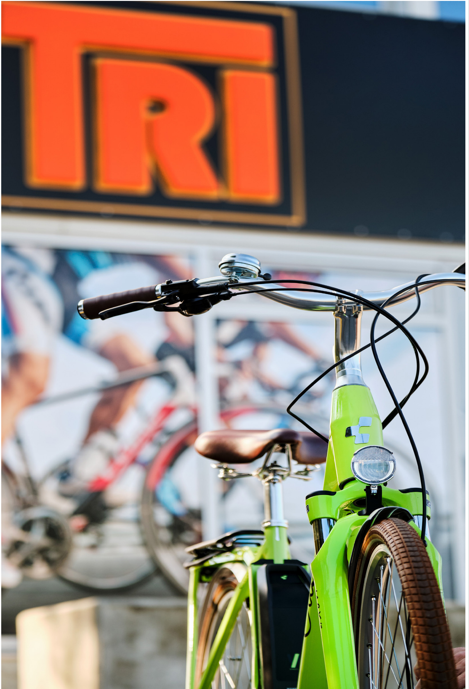
TRI-verslun býður upp á mikið úrval af fallegum og vönduðum rafmagnshjólum frá CUBE. Hjól af þessu tagi gætu spilað lykilhlutverk í því að draga úr umferð.