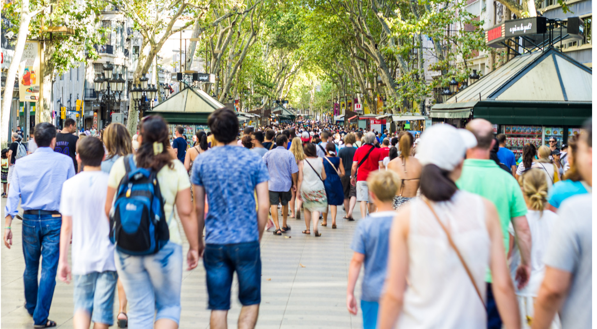
Það er alltaf mannþröng á Römlunni í Barcelona. Betra er að hafa varann á gagnvart vasapjófum.