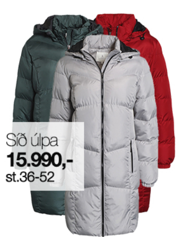
Síð úlpa 15.990,- st.36-52