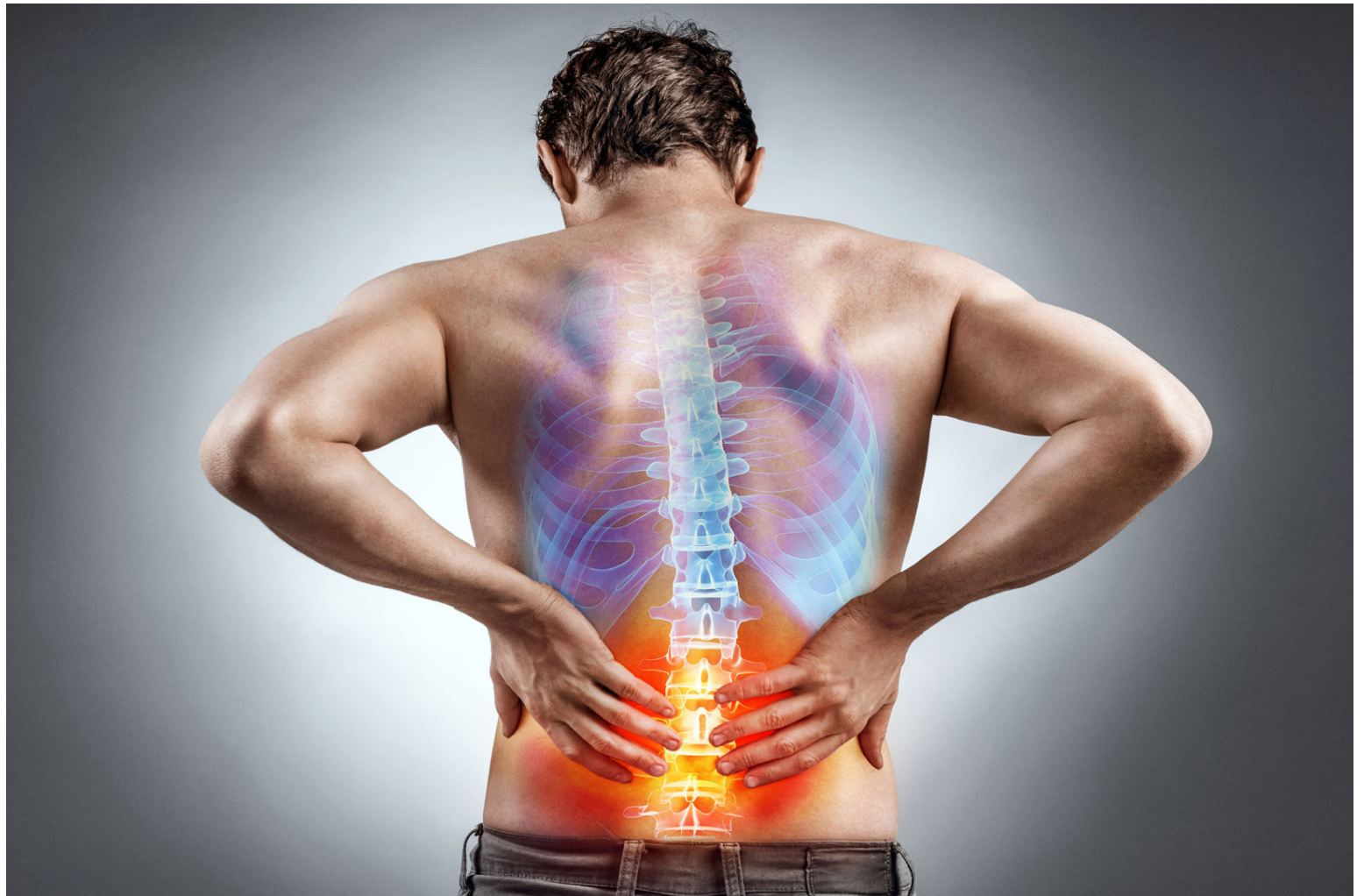
Glúkósamín er nú loksins leyft í lausasölu hér á landi en fjölmargir lækna hafa um langa hríð mælt með því fyrir bættu liðheilsu.

Glucosamin & chondroitin complex frá Natures Aid er magnað liðbættiefni þar sem tekið er á fjölmörgum þáttum sem tengjast liðverkjum. Auk glúkósamíns inniheldur þetta bættiefni kondrotín sulfat sem er byggingarefni brjósks og eru þessi tvö efni því afar góð blanda fyrir liðina en dagskammtur inniheldur 1000 mg af glúkósamíni og 200 mg af kondrotíni ásamt engifer, túrmerik, C-vítamíni og rósaldíni (rosehips).