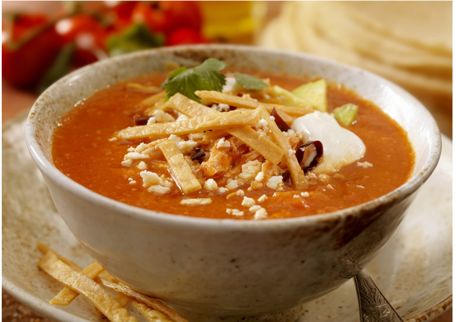
Þessi súpa er fullkomin á köldum haustdögum. Þá er hún einnig laus við allar dýraafurðir og því kjörin fyrir alla fjölskylduna.

Bætið við hökkuðum tómötum úr dós, grænmetissoði, salsasósu og blaðlauk, þá er líka gott að bæta við hvítlauk á þessum tímamarki fyrir þá sem vilja.