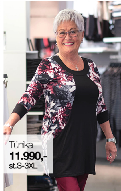
Túnika 11.990,- st.S-3XL