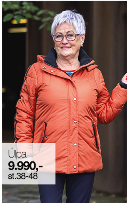
Úlpa 9.990,- st.38-48