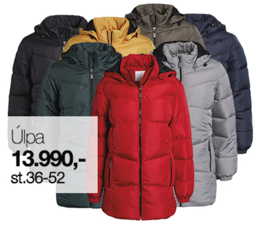
Úlpa 13.990,- st.36-52