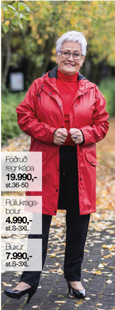
Fóðruð regnkápa 19.990,- st.36-50