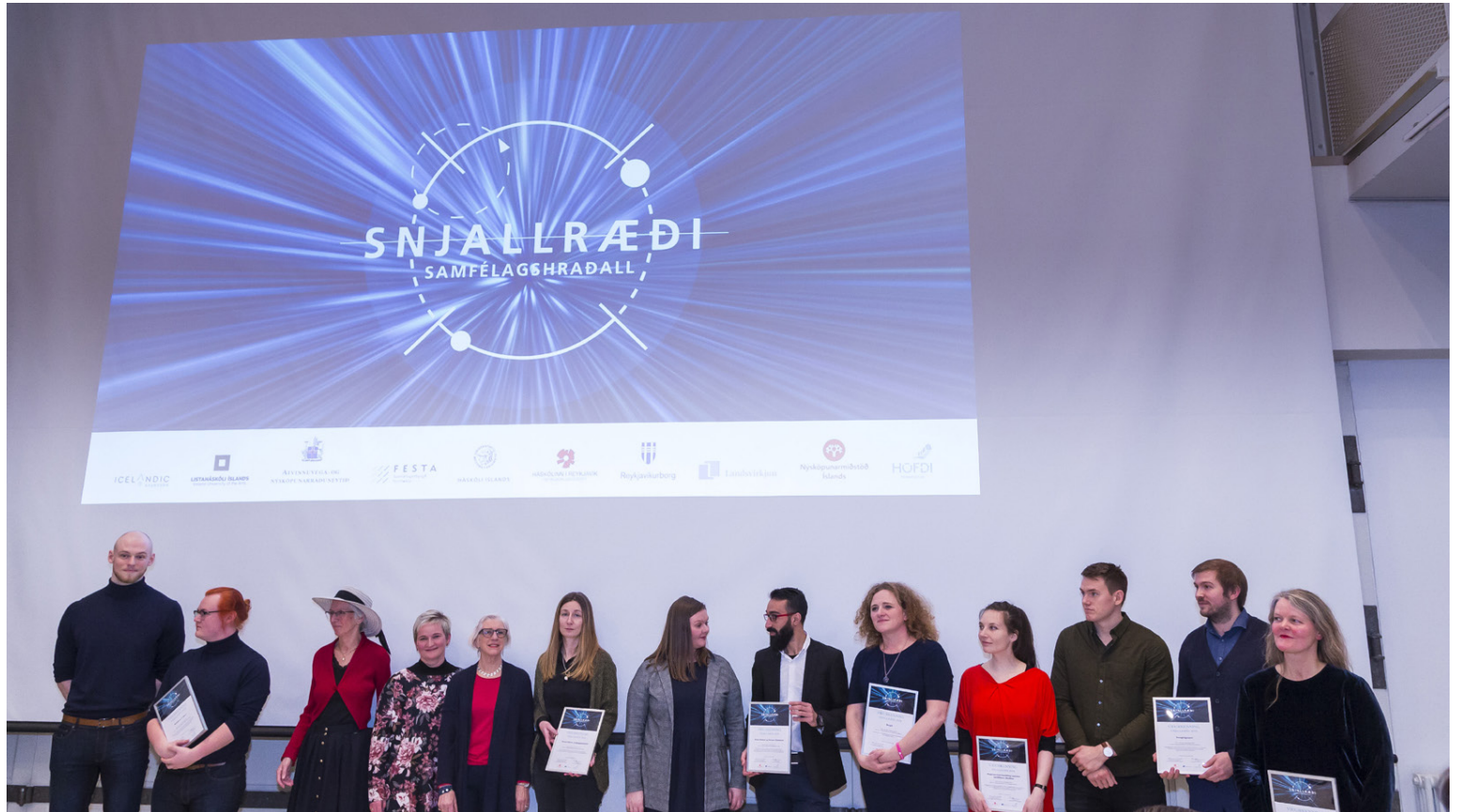
Þátttakendur í Snjallræði 2018.

Á viku tímabili munu teymin í Snjallræði fá að kynna nýjustu nálgunum á sviði samfélagslegrar nýsköpunar og frumkvöðlastarfsemi og öðlast tækifæri til þess að sannreyna eigin hugmyndir og kryfja þær til mergjar í krefjandi vinnustofum sem byggðar verða