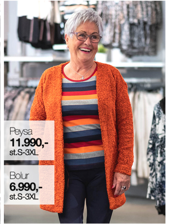
Peysa 11.990,- st.S-3XL