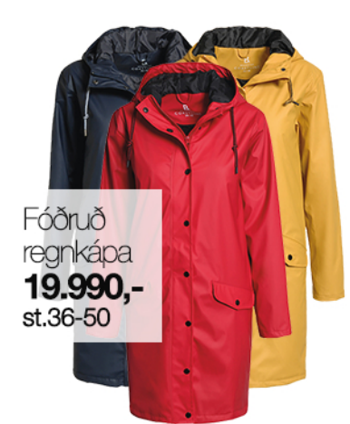
Fóðruð regnkápa 19.990,- st.36-50