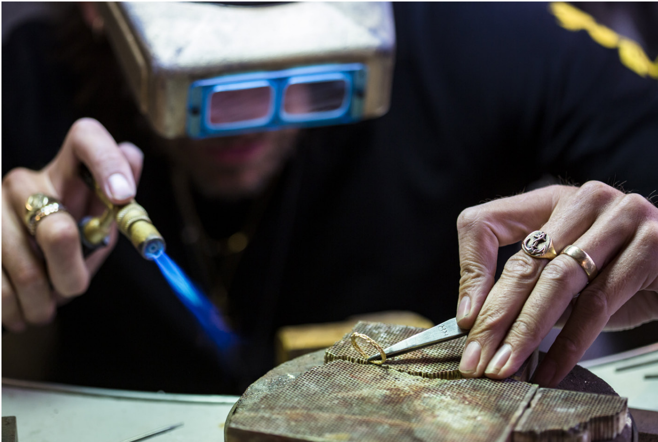
Verkstaðið er í sama rými og verslunin, í huggulega kjallarárými á Skólavörðustígnum.