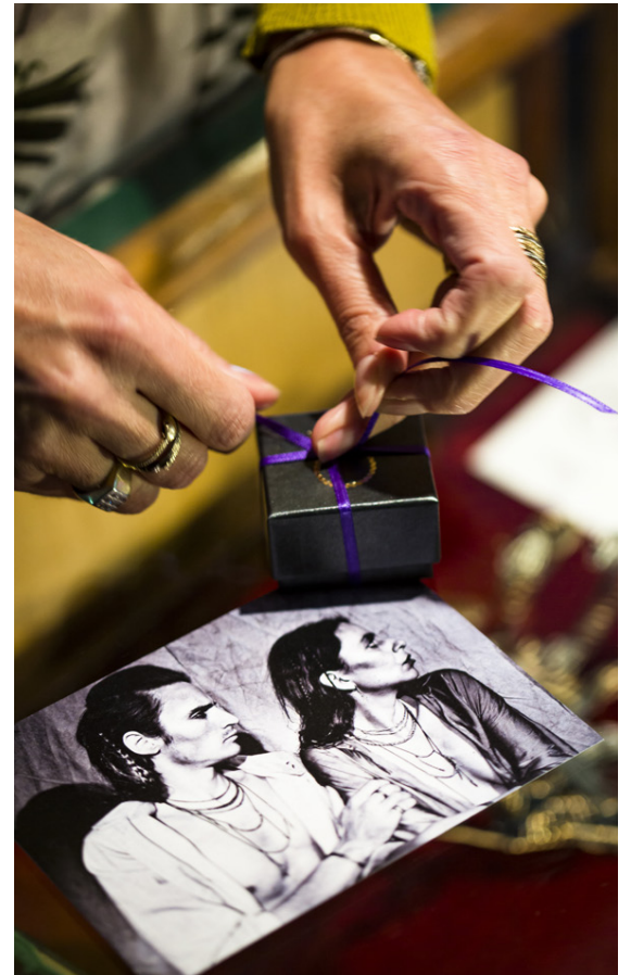
Þegar keyptur er skartgripur í Orrifinn fylgir sagan með.