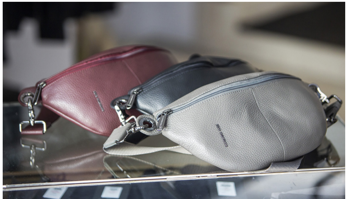
Gullfallegar leður bumbags frá Mandarina Duck hafa slegið í gegn hjá íslenskum nútímakonum.

unarrektur eigi eftir að byggjast upp aftur í miðbænum og nú þegar eru margir kröftugir hönnuðir að poppa upp, ásamt fullt af spennandi listagalleríum, skartgripabúðum og síðast en ekki síst öll dásamlegu kaffi- og veitingahúsin. Það er endá skemmtileg og hressandi upplifun að ganga um götur gamla miðbæjarins sem hefur fengið á sig ferska mynd og þá er