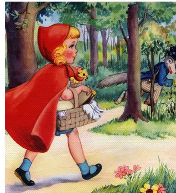
Ævintýrið um Rauðhettu er sígilt.

Það eru þó ekki allir jafn hrifnir af hettunni. Til dæmis eru kennarar almennt ekki miklir aðdáendur hettunnar, né lögreglu- eða afgreiðslufólk og eru dæmi um að notkun hettupeysa hafi verið bönnuð í verslunarmiðstöðvum og skólum.