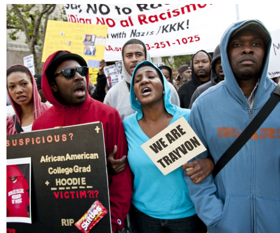
Hettupeysan varð að sameiningartákni í morðmáli Trayvon Martin í Bandaríkjunum árið 2010.