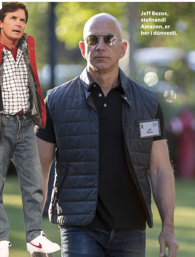
Jeff Bezos, stofnandi Amazon, er hér í dúnvesti.