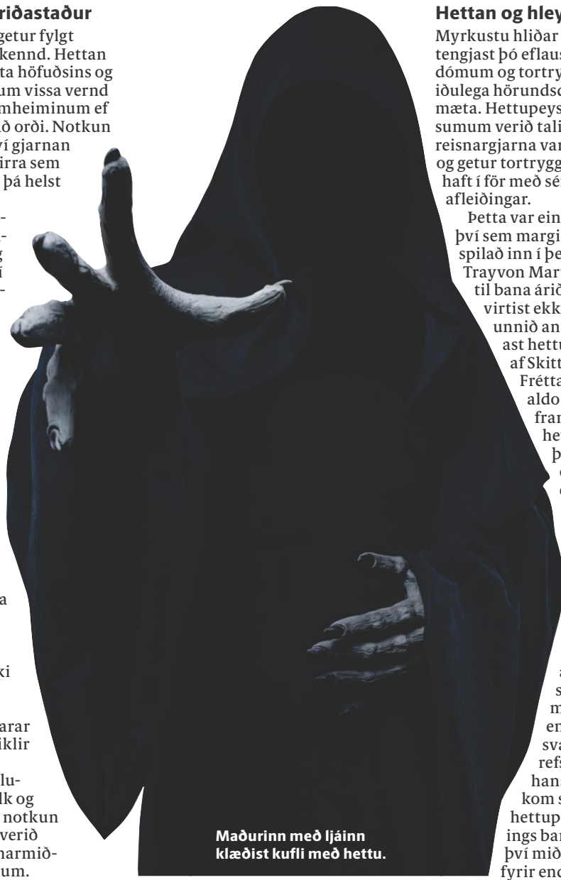
Maðurinn með ljáinn klæðist kufli með hettu.

Hettupeysan varð í því tilfalli að eins konar sameiningartákni meðal mótmælenda sem kröfðust svara og videigandi refsingar morðingja hans. Fjöldi fólks kom saman, iklætt hettupeysum, til stuðnings baráttu sem virðist því miður ekki enn sjá fyrir endann á.