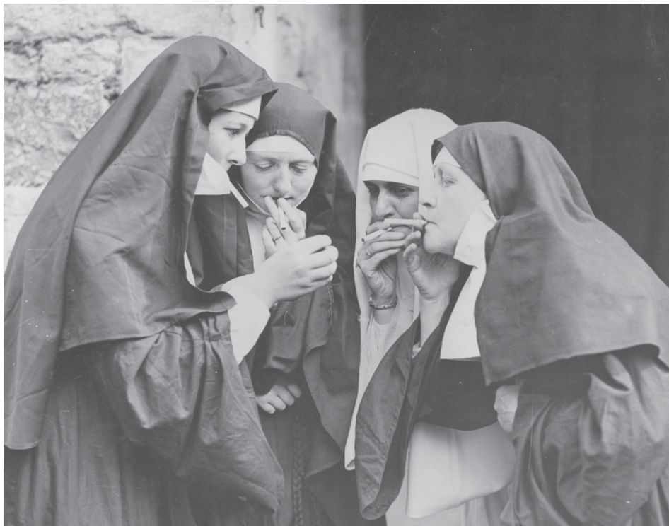
Hettan er órjúfanlegur hluti hefðbundinna nunnuklæða.

Á áttunda áratugnum var hettupeysan svo gerð ódaudleg í myndunum um hnefaleikakappann Rocky. Þá hefur hún einnig lengi notið vinsælda í hjólabretta-