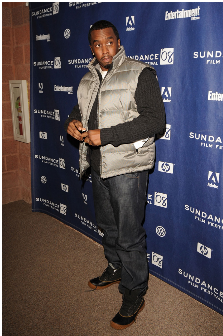
Tónlistarmaðurinn Sean John Comes einnig þekktur sem P. Diddy, Puff Daddy eða Love, notar oft dúnvesti.

Það muna eflaust margir eftir rauða dúnvestinu hans Marty McFly.