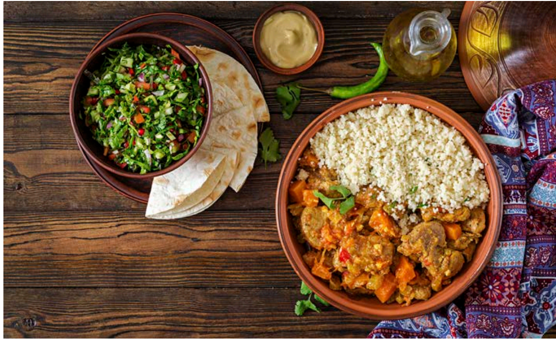
Æðislegur lambapottréttur ættaður frá Marokkó.

4 grilluð kjúklingalæri með legg 200 g sveppir