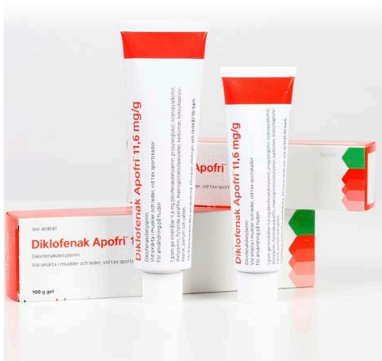
Diklofenak Apofri hlaup er bólgueyðandi lyf sem fæst á góðu verði.

Sjá nánari upplýsingar um lyfið á www.serlyfjaskra.is .