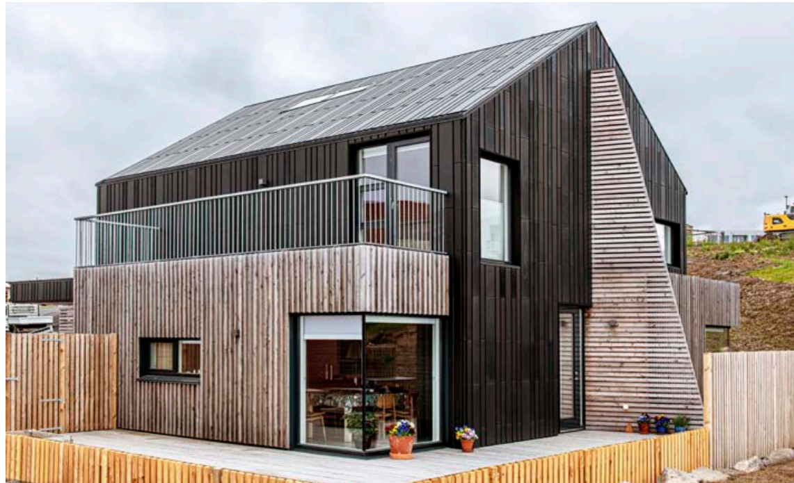
Hjónin ákváðu að byggja flott hönnunarhús til að sýna að það sé hægt að byggja fallett og umhverfisvænt gæðahús.

„Þegar við höfðum ákveðið að ráðast í verkefnið töluðum við við hvern aðilann á fætur öðrum til að fá hjálp. Við fengum ýmsa ólíka fagaðila til að vinna með okkur að hönnun og byggingu hússins, því við kunnum ekki að byggja hús, en