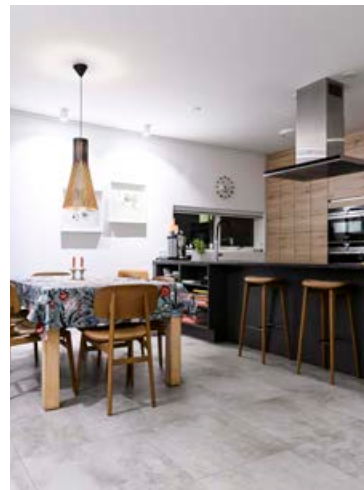
Á vefsíðunni visthus.is eru allar upplýsingar um verkefnið, byggingarefnin og aðferðirnar.