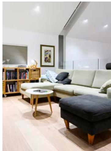
Hjónin segja ótrúlega gott að búa í húsi þar sem þau vita í hjartanu að þau séu að gera rétt.