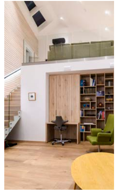
Húsið er búið loftræstikerfi sem endurnýtir hitann í húsinu, minnkar orkunotkun um 30-40% og bætir loftið.