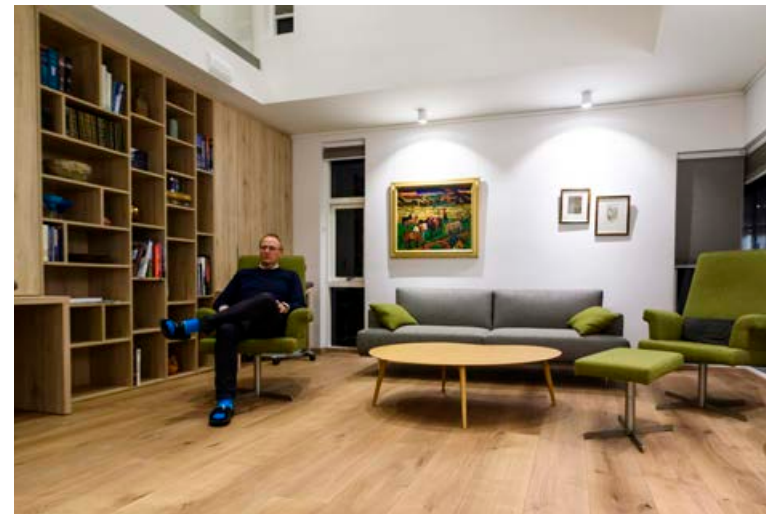
Finnur segir að það hafi tekið tíma að brjóta niður fordóma fagaðila gagnvart því að byggja hús á þennan hátt.

„Byggingarkostnaðurinn við húsið var um 500 þúsund krónur á fermetra, en þetta er hönnunarhús með ýmsar hönnunarlausnir,