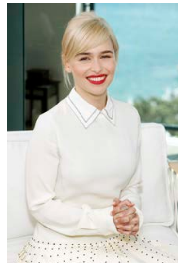
Leikkonan á margt sameiginlegt með persónunni sem hún leikur í Last Christmas.

Fyrir utan Game of Thrones og Last Christmas lék Emilia Clarke nýlega í spennutryllinum Above Suspicion og stjórnustríðsmyndinni Solo: A Star Wars Story. Það verður áhugavert að sjá hvaða hlutverk þessi hæfileikaríka unga leikkona mun taka að sér í framtíðinni.