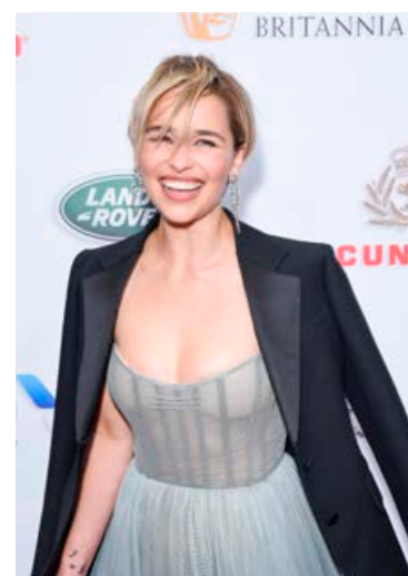
Leikkonan hefur gengið í gegnum erfiða lífeyrslu sem hún nýtti til góðs.