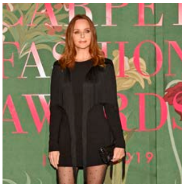
Stella McCartney notar ekki leður í hönnun sína.