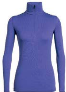
Tech hálfrennd dömu 15.990 kr.