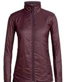
Helix Jakki dömu 34.990 kr.

Smíðjuvegur 8, Græn gata 200 Kópavogi, sími: 571 1020 www.ggsport.is