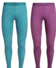
Oasis Leggings dömu 12.990 kr.