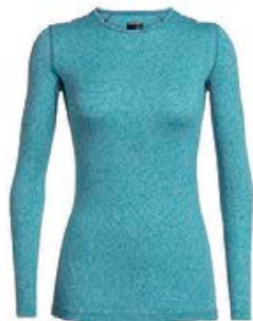
Oasis Crewe dömu 14.990 kr.