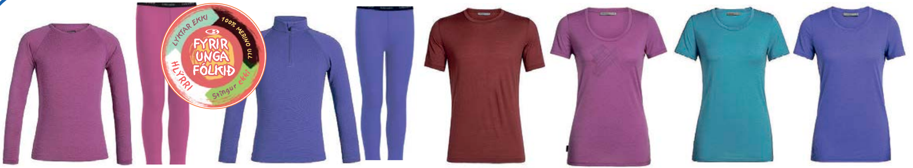
Oasis Crewe barna 6.990 kr.