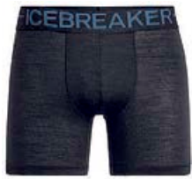
Anatomica Zone Boxers herra 6.590 kr.