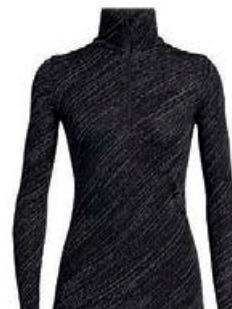
Vertex hálfrennd dömu 18.990 kr.