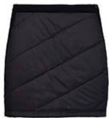
Helix pils dömu 14.990 kr.