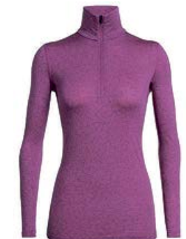
Oasis hálfrennd dömu 15.990 kr.