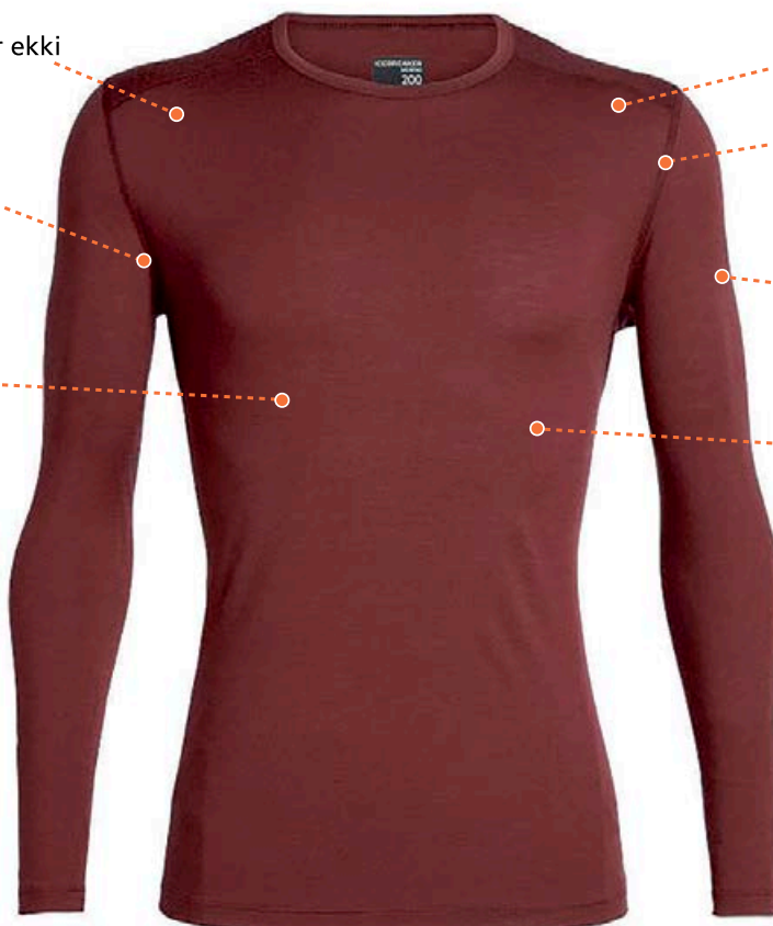
Oasis Crewe herra verð frá 13.990 kr.