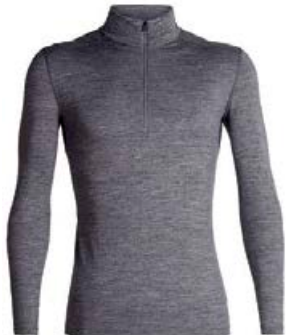
Oasis hálfrennd herra 14.990 kr.