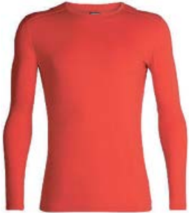
Oasis Crewe herra 13.990 kr.