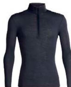
Everyday hálfrennd herra 12.990 kr.