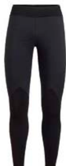
Tech Trainer leggings dömu 23.990 kr.