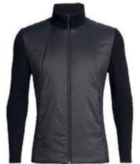
Lumista Hybrid peysa herra 42.990 kr.