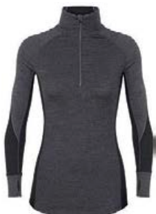
Zone hálfrennd dömu 18.990 kr.