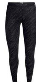
Vertex leggings dömu 15.990 kr.