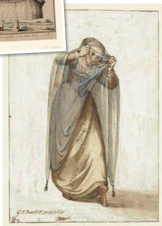
„Chopines“ skór voru um tíma vinsælir í Fenejnum.

hvorki meira né minna en þjár milljónir dollara.