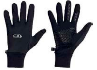
Hanskar með vindvörn 7.490 kr.

Icebreaker Merino ull - fyrir alla þá sem vilja hlýjan ullarfatnað sem stingur ekki og dregur ekki í sig lykt.