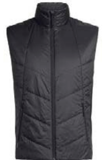
Helix vesti herra 26.990 kr.

Fjölbreytt úrval lita og mismunandi þykktir