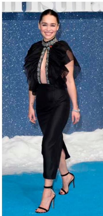
Emilia Clarke í Prada-kjól á frumsýningu Last Christmas í London.

Emilia Clarke fékk blæðingu inn á heila meðan hún lék í Game of Thrones og þurfti að fara í tvær heilaskurðaðgerðir. Hún var 24 ára þegar hún veiktist fyrst en