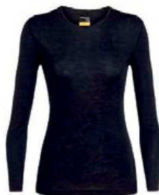
Everyday Crewe dömu 11.990 kr.