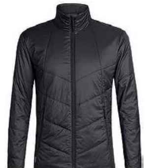
Helix Jakki herra 34.990 kr.