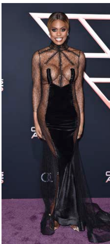
Laverne Cox hefur ekkert að fela.

M edvitund um umhverfis-áhrif og sjálfbærni hefur aukist í tiskuheiminum enda er það þekkt að kolefnis-spor iðnaðarins á heimsvísu er gríðarlegt. Stella McCartney hefur verið með fatalínu undir eigin nafni síðan árið 2001. Hún hefur næmt auga fyrir sterkum sniðum og gæðaflikum sem geta gengið fyrir hvaða árstíð sem er. Eins og flestir vita er hún grænmetisæta og notar því ekki leður í hönnun sinni. Til að stuðla að sjálfbærni notar hún lifræna bómull, þræði sem stuðla ekki að eyðingu skóga, endurunnið pólýester og endurnýtt kasmírull í þau fót sem hún hannar.