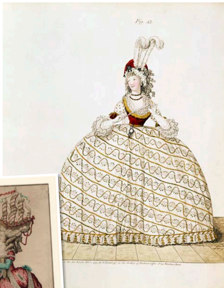
„Pannier“ kjólar voru ansi breiðir.