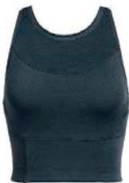
Sport Bra long 9.990 kr.