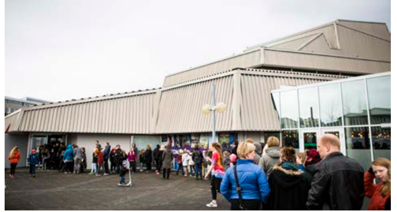
Sýningarnar verða í Borgarleikhúsinu.

Í dag, 16. nóvember, og mánudaginn 18. nóvember verða sýningarnar á íslensku. Á morgun, 17. nóvember, og mánudaginn 25. nóvember verða sýningarnar á ensku. Með því vonast leikhópurinn til að ná til innflytjenda, og allra þeirra sem hafa ekki þau tæk á íslensku að þau treysti sér í leikhús. Ókeypis er inn á allar sýningarnar.