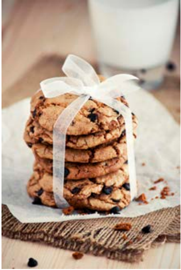
Heimagerðar súkkulaðibitakökur eru uppskrift að hamingju.