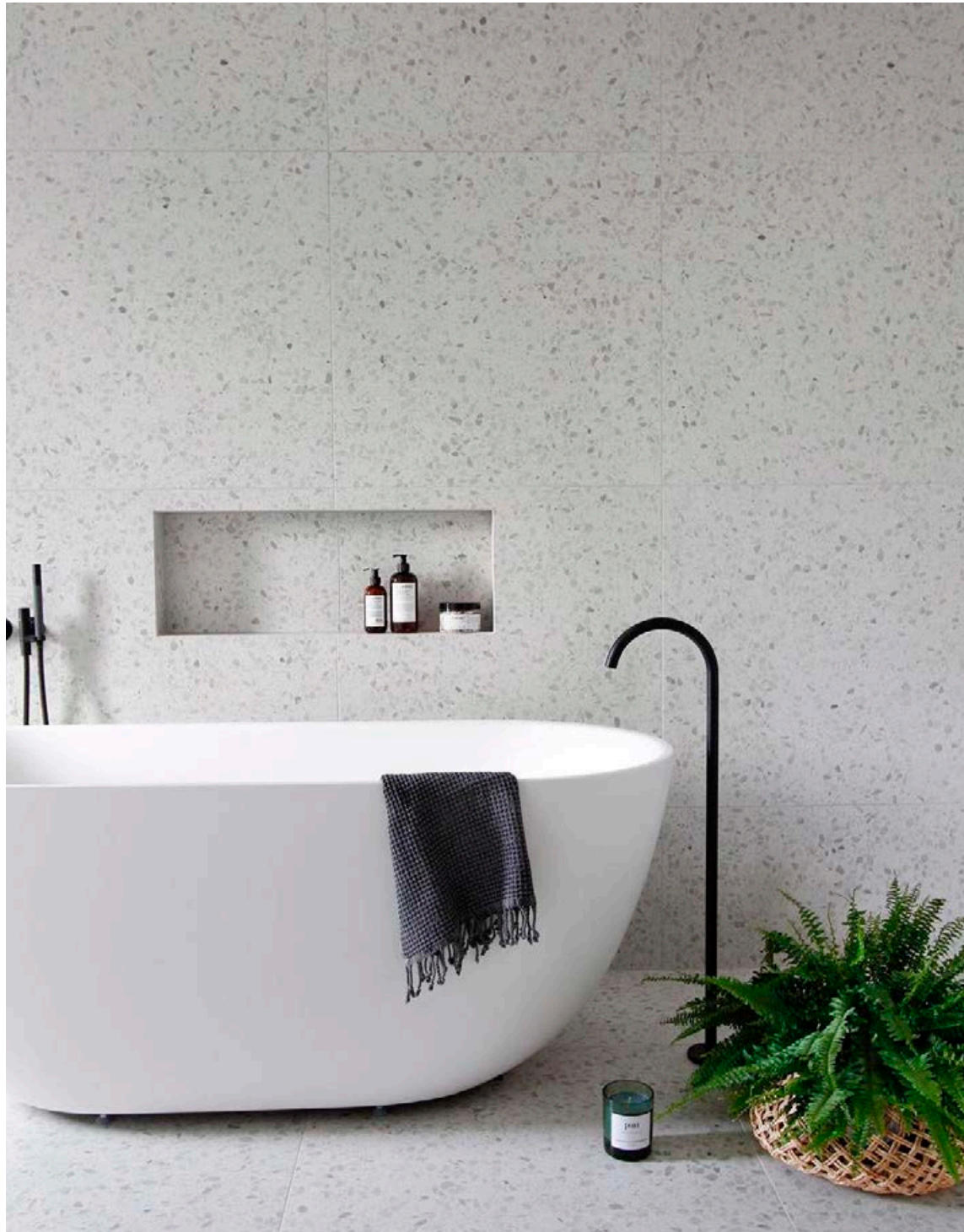
Þær eru glæsilegar ítölsku flísarnar frá Florim; terrazzo-flísarnar La Veneziane Castello.

Birgisson er í Ármúla 8. Sími 516 0600. Netfang: birgisson@birgisson.is. Sjá nánar á birgisson.is.