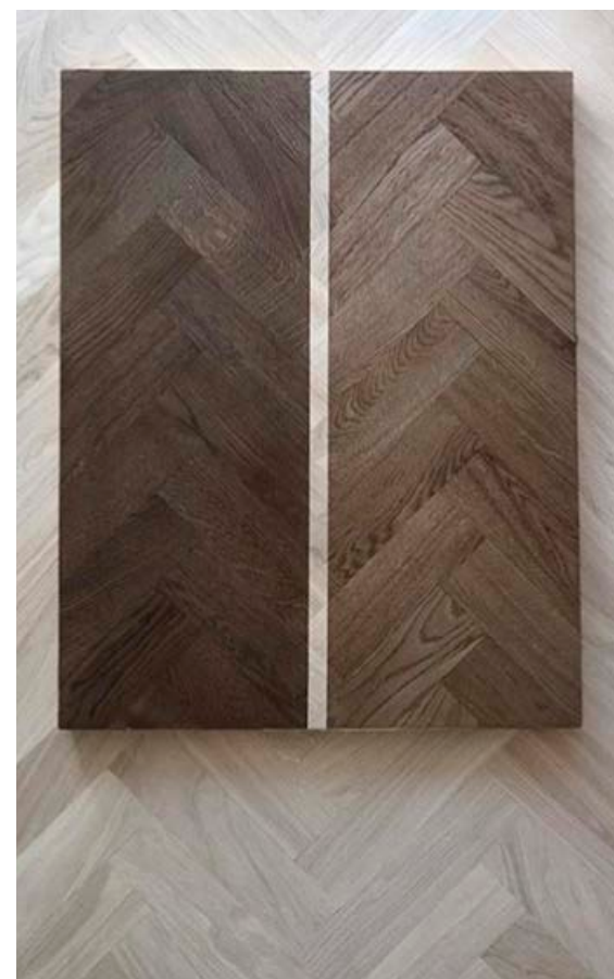
Gegnheil eik meðhöndluð með Osmo-efnum.

” Við erum þekkt fyrir að vera með gríðarlega mikið vöruúrval og þá sérstaklega í harðparketinu.