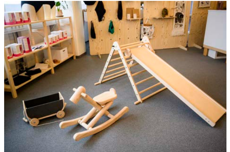
Ákveðið var að bjóða upp á sérstakt leikrými fyrir litla fólk í versluninni.

Tíminn hafi verið af skornum skammti og einfaldleikinn því í fyrirrúmi. „Við vildum halda hlutunum einföldum, þá bæði svo að vörurnar fái að njóta sín og vegna þess að tíminn til að græja rýmið var naumur. Hluta verslunarinnar