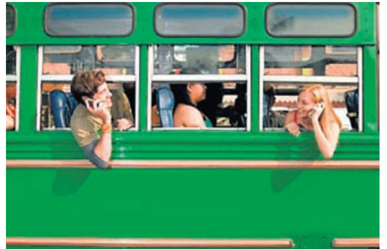
Árið 2015 verður símnn ekki bara nauðsynlegur ferðafélagi heldur eina tækið sem þú þarft á að halda.

ig fleygja fram; í framtíðinni mun símnn þinn láta þig vita ef þú ert nálægt hamborgarastað eða kaffihúsi og bjóðast til að borga reikninginn fyrir þig. Og með framförum í sendingum milli síma verður ekkert mál að horfa á beina upptöku af fót-boltaleik sem vinur þinn á vellinum tekur upp og sendir þér. Auk þess verður hægt að senda allar þær kvikmyndir sem hefur verið hlaðið niður í