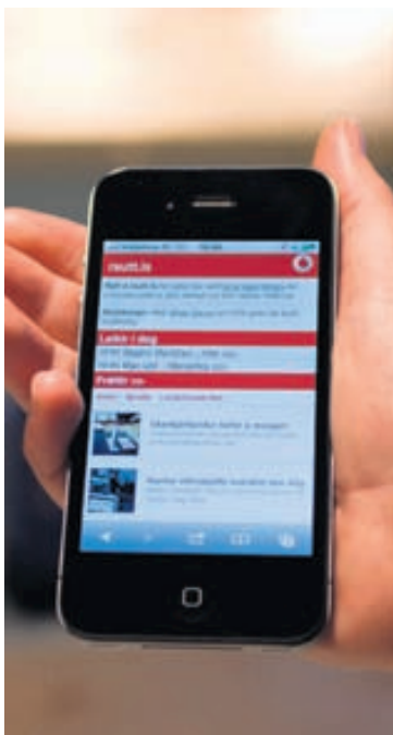
Hægt er að fá upplýsingar um næstu fótboleiki, veðrið víða um lönd og fleira.

Forritið ScanLife er eitt þeirra forrita sem eru til fyrir allar tegundir snjallsíma og það má nota til að lesa úr hraðkóðum.