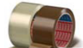
Pökkunarlímband kr. 299,-