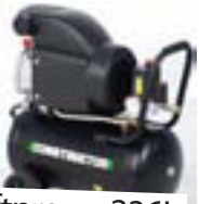
Loftpressa 236L 24L kútur 8Bör Kr 26.995,-