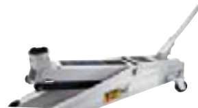
Gólftrökur 2,25T Lyftihæð 53,5cm kr. 19.995