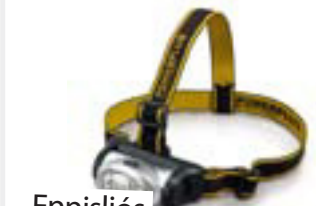
Ennisljós Kr. 995,-