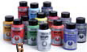
Akrýllitir 400ml kr. 1.540,-