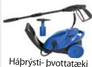
Háprýsti-þvottatæki kr. 15.750,-