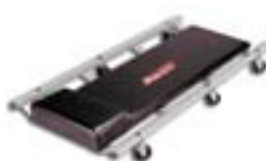
Legubretti Kr. 11.995,-