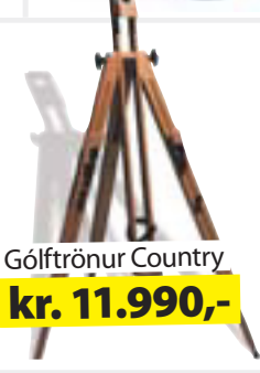
Gólftrökur Country kr. 11.990,-