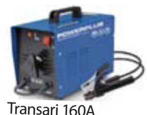
Transari 160A kr. 22.995,-