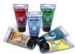
Akrýllitir 75ml kr. 480,-