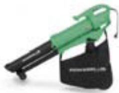
Laufsugur 2400W kr. 9.600,-