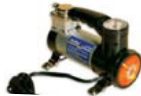
Loftdæla 12V 30L kr. 8.995,-