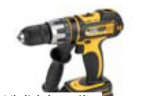
Hleðsluborvélur, fjölmargar gerðir Frá kr. 3.995,-