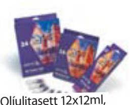
Olíulitasett 12x12ml, 18x12ml og 24x 12ml Frá kr. 1.245,-