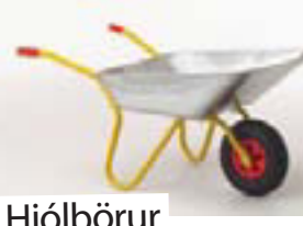
Hjólbörur kr. 5.985,-