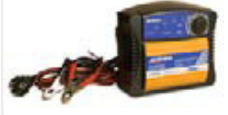
Hleðslutæki 12V 2-6A kr. 12.995,-