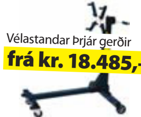
Vélastandar þrjár gerðir frá kr. 18.485,-