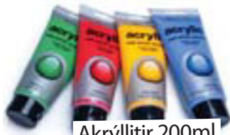
Akrýllitir 200ml kr. 985,-