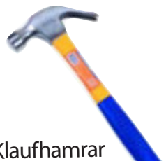
Klaufhamrar Frá kr. 560,-