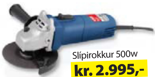
Slípirokkur 500w kr. 2.995,-