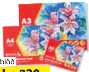
Skissublöð Frá kr. 320,-