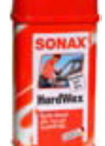
Hard Wax 500ml kr. 1.550,-