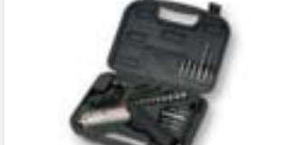
Hleðsluskrúfjárn kr. 2.370,-