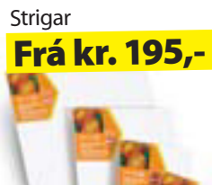
Strigar Frá kr. 195,-