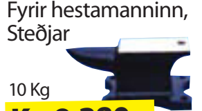
Fyrir hestamanninn, Steðjar 10 Kg Kr. 9.380,- 25 kg Kr. 22.145,-