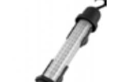
Ljósahundur, hleðslu 60LED 12/230V Kr. 4.995,-