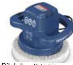
Bílabónvél 110W 240mm kr. 4.995,-