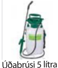
Úðabrúsi 5 lítra kr. 2.695,-