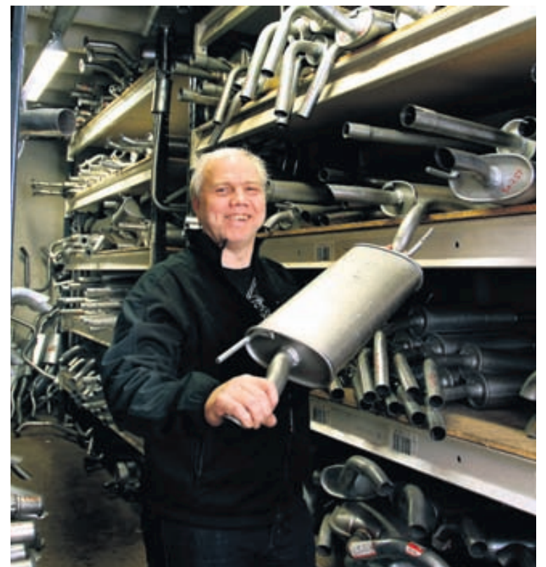
Vel er tekið á móti viðskiptavinum Kvikk þjónustunnar.

Kvikk þjónustan rekur nú tvö verkstæði, eitt að Bíldshöfða 18 í Reykjavík og annað að Drangahrauni 1 í Hafnarfirði. „Á hvorum stað erum við með góðan lager af þústkerfum, sem við höfum innflutning á fyrir átta árum til að auka samkeppni á þeim markaði, og pöntum við eftir þörfum,“ útskýrir hann og segir starfsmenn taka vel á móti viðskiptavinum. „Við leggjum metnað í þjónustu