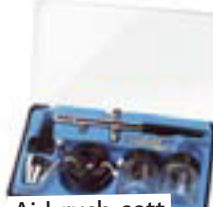
Airbrush-sett Kr. 4.995,-