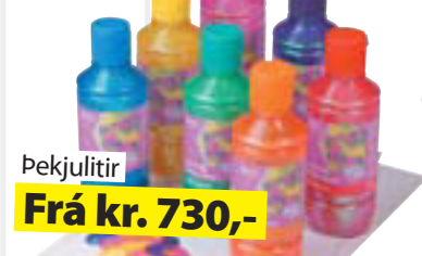
Pekjulitir Frá kr. 730,-