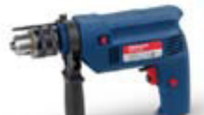
Höggborvél 500w kr. 2.395,-