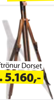
Gólftrökur Dorset kr. 5.160,-