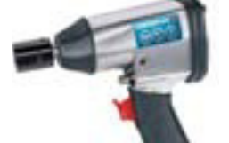
Loftlykill 1/2" m/ 11 toppum Kr. 11.995,-