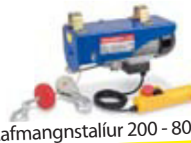
Rafmangnstaliur 200 - 800 kg Frá kr. 22.995,-