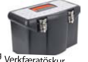
Verkfæratoöskur frá kr. 480,-