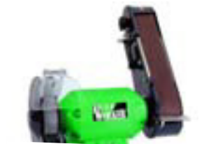
Smergel + Bandslípivél kr. 9.895,-