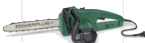
Keðjusög 2000W kr. 16.995,-