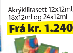
Akrýllitasett 12x12ml, 18x12ml og 24x12ml Frá kr. 1.240,-