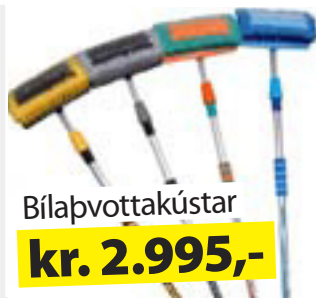
Bílapvottakústar kr. 2.995,-