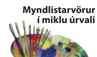
Myndlitarvörur í miklu úrvali