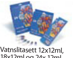
Vatnslitasett 12x12ml, 18x12ml og 24x 12ml Frá kr. 1.240,-