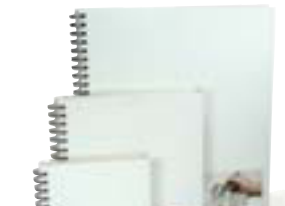
Skissubækur Frá kr. 685,-