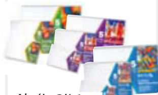
Akrýl-, Olíulita- og Vatnslitaspjöld Frá kr. 335,-