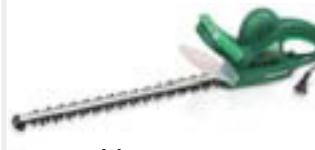
Hekklippur kr. 7.995,-