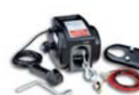
Dráttarspil 12V kr. 43.695