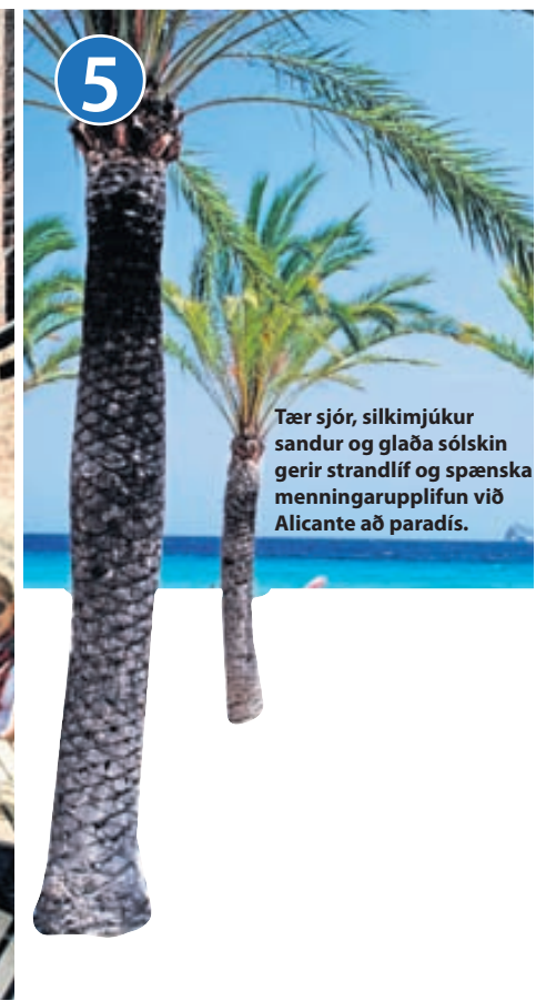
5 Tær sjór, silkimjúkur sandur og glaða sólskin gerir strandlíf og spænska menningarupplifun við Alicante að paradís.

og því hægt að slaka á í áhyggjulausu fríi.