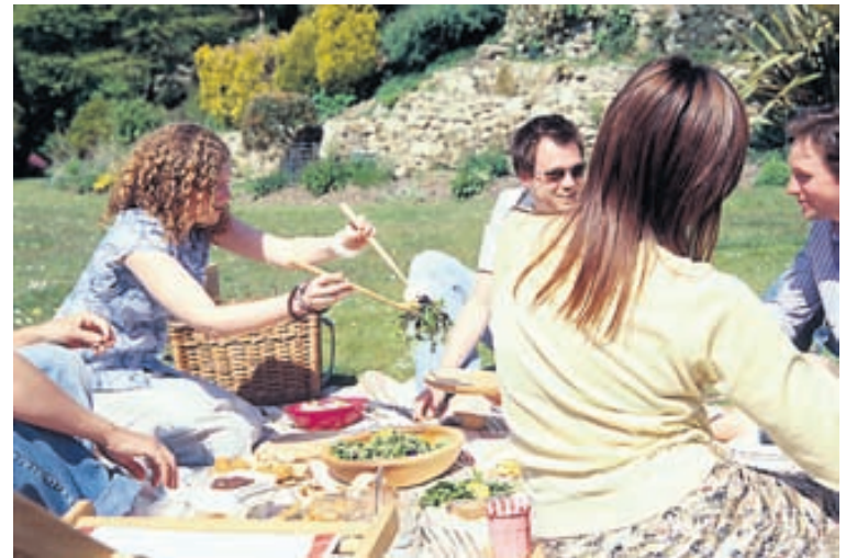
Lautarferð í almenningsgarði með heimagerðum kræsingum getur verið ódýrari kostur en að kaupa máltíð á veitingastað.

Sjá einnig frekara úrval ferða á FERDIR.IS Ferðaskrifstofa Guðmundar Jónassonar Borgartún 34, 105 Reykjavík, S: 511 1515