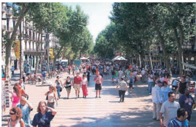
Ramblan í Barcelona er vinsæl meðal ferðamanna.