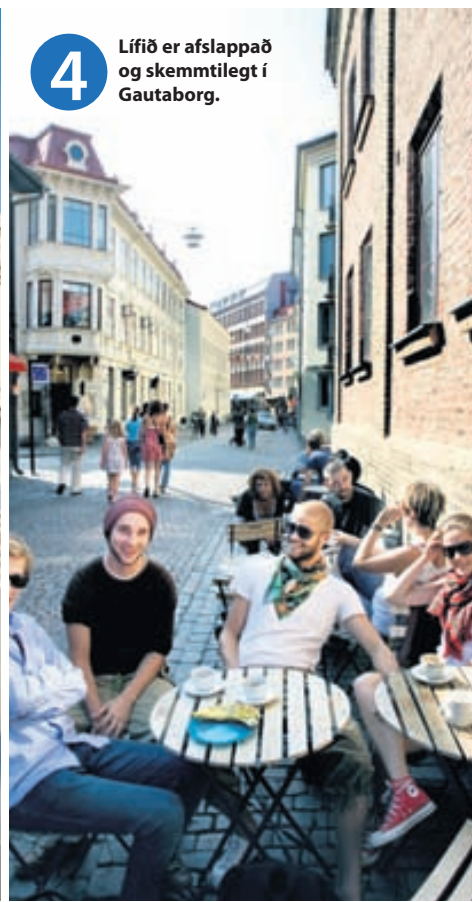
4 Lífið er afslappað og skemmtilegt í Gautaborg.