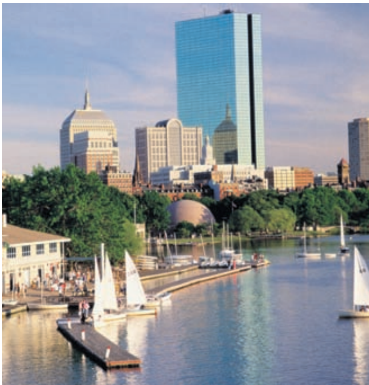
Boston er nýr áfangastaður Iceland Express og bjóða Expressferðir flug og gistingu á hagstæðu verði í sumar.