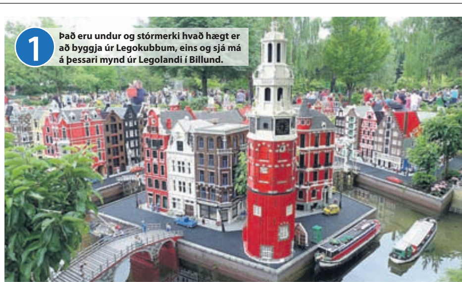
1 Það eru undur og stórmerki hvað hægt er að byggja úr Legokubbum, eins og sjá má á þessari mynd úr Legoland í Billund.

Washington er ein af merkilegustu borgum veraldar með fjölda sögufrægra staða og óendanlega marga viðburði. Þar er ljúft að ganga um söguslóðir í Georgetown og njóta lífsins á börum og veitingahúsum á árbakkanum. Helstu söfn, minnismarki og veitingastaðir eru á tiltölulega litlu svæði