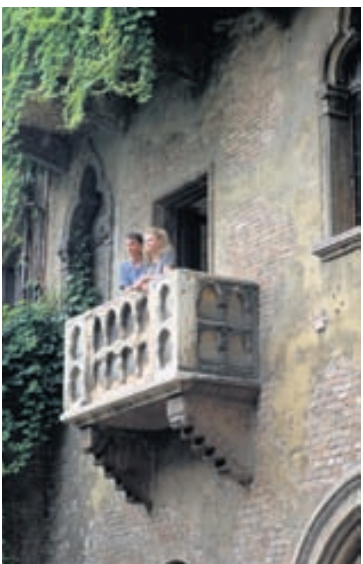
Hver gæti neitað bónorði sem borðið væri upp við svalirnar á húsi Júlíu í Veróna?

Fáir staðir í veröldinni eru þó eins fasttengdir rómantíkinni og Veróna á Ítalíu. Borg Rómeós og Júlíu höfðar sterkt til elskenda á öllum aldri og alrómantískasti og vinsælasti staðurinn til að falla á kné og stama út úr sér ástarjárnungum er að sjálfsögðu undir svölunum á húsi Júlíu. Það er varla hugsanlegt að fá neitun á slíkum stað.