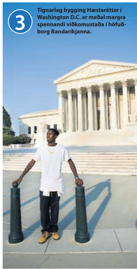
3 Tignarleg bygging Hæstaréttar í Washington D.C. er meðal margra spennandi viðkomustaða í höfuðborg Bandaríkjana.