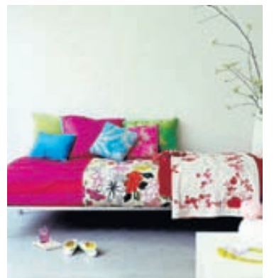
Sófinn til reiðu fyrir forvitna ferðalanga sem vilja kynna landi og þjóð gegnum „couchsurfing“.

Utanlandsferðir geta komið við þyngjuna og ekki er á allra færi að gista á fimm stjörnu hótélum og borða margréttað á kvöldin. Hér eru nokkur atriði sem geta lækkað ferðakostnað verulega.