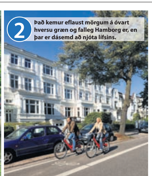
2 Það kemur eflaust mörgum á óvart hversu græn og falleg Hamborg er, en þar er dásæmd að njóta lífsins.