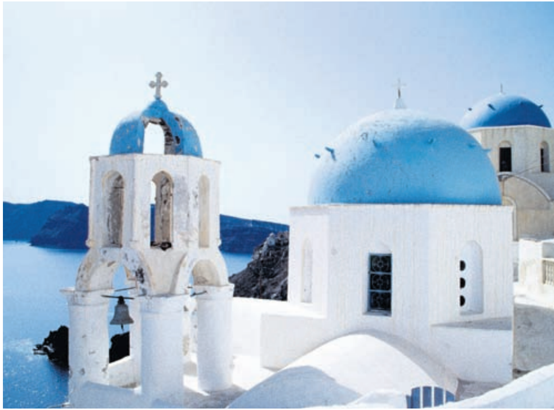
Auk sólarferða og borgarferða býður Úrval-Útsýn upp á Ævintýraferðir þar sem leiðin liggur um ókannaðar slóðir, meðal annars í Marokkó, Andalúsíu og í siglingum um heimsins höf.