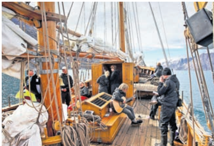
Norðursigling býður ævintýrasiglingu til Grænlands í sumar. Hún verður með þægilegu móti og ætti að henta öllum aldurshópum.

Boðið er upp á tvær brottfarir í sumar. Sú fyrri er 20. ágúst og síðari þann 27. „Farþegar fljúga frá Reykjavík og beint til til Constable Point sem er lítill flugvöllur í vestanverðum Hurry-firði í Jameson Land. Þar eru þeir síðan teknir um borð í Hildi og lagt í viku ferðalag. Farþegarnir sigla því ekki á milli landa heldur koma