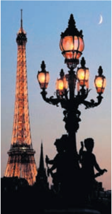
Eiffel-túrninn er einn vinsælasti bónorðsstaður veraldar.