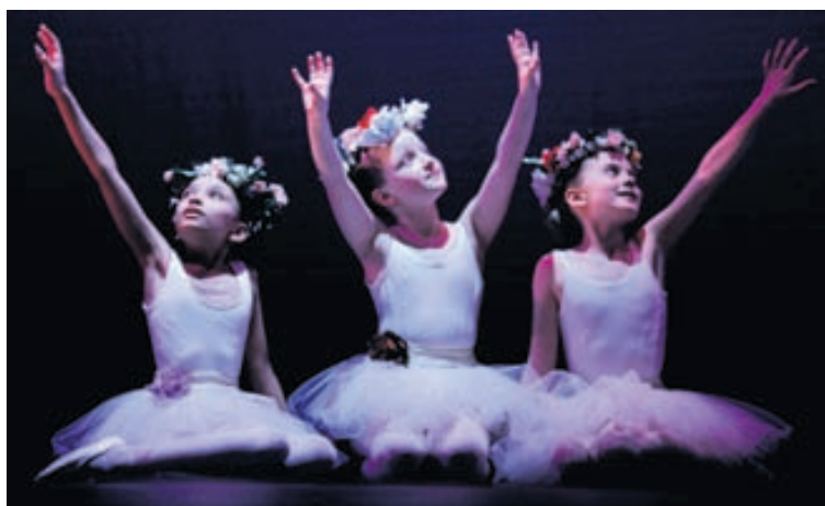
Úr Gæsamömmusvítu. Atriði yngstu nemendanna úr vorsýningu Listdansskólans 2011 í Þjóðleikhúsinu.

Listdansskóli Íslands hefur sýnt fram á að hann hefur um árabil byggt upp hæfileikaríka og sterka atvinnudansara. Nemendur