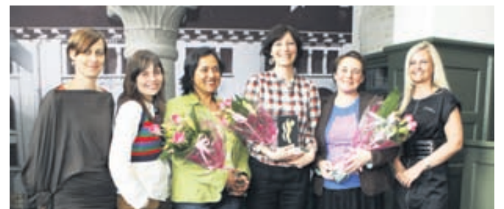
Frá verðlaunaafhendingu á síðasta ári.

Listdansskóli Íslands setur upp þrjár nemendasýningar á ári í atvinnuleikhúsum, bæði á haustönn og vorönn. Með því að sýna fyrir áhorfendur öðlast nemendur mikilvæga reynslu í því að koma fram og fá að njóta sín á stóru sviði. Nemendasýningar Listdansskólans hafa verið einstaklega metnaðarfullar og glæsilegar og er það gleðiefni að samvinna við íslensk tónskáld og hljóðfæraleikara hefur aukist síðustu ár. Þá hefur samstarf við Sinfóníuhljómsveit Íslands eflst enn frekar og verða nemendur Listdansskólans með á jóla- og vortónleikum sveitarinnar í Hörpu 2011-2012. Listdansskóli Íslands mun setja upp veglega afmælissýningu árið 2012 í tilefni þess að 60 ár eru frá stofnun hans.