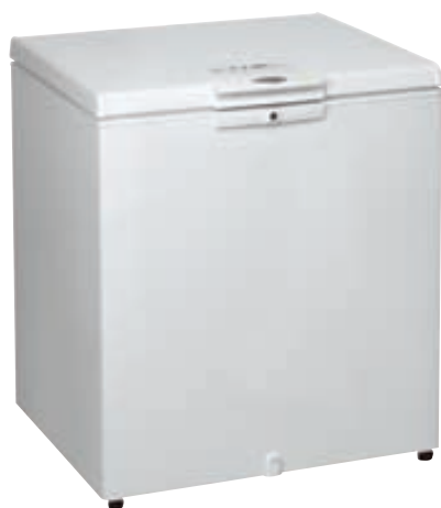
FRYSTIKISTUR Verð frá kr. 49.995