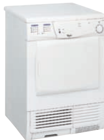
BARKALOUSIR ÞURRKARAR Verð frá kr. 69.995