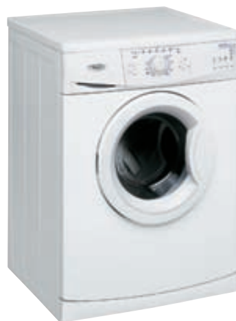
ÞVOTTAVÉLAR Verð frá kr. 74.995