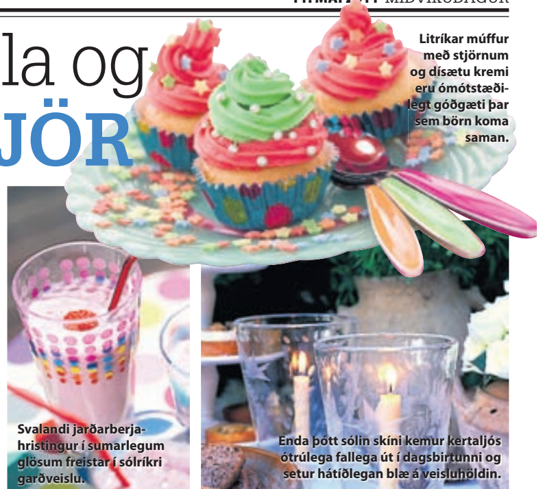
Svalandi jarðarberjahristingur í sumarlegum glösum freistar í sólríkri garðveislu.

Garður er sönn paradís þeim sem hann eiga og draumastaður fyrir samfundi og hvers kyns veisluhöld þegar sumarið yljár líkama og sál. Barnaafmæli eiga þar sérstaklega vel heima og í raun óhugsandi að ætla smáfólki að hanga inni þegar sólin skín og útileikir kalla. Þá þykir börnum hreinasta hátið að borða kökur undir bláhimni og sötra litskrúðuga afmælisdrykki.