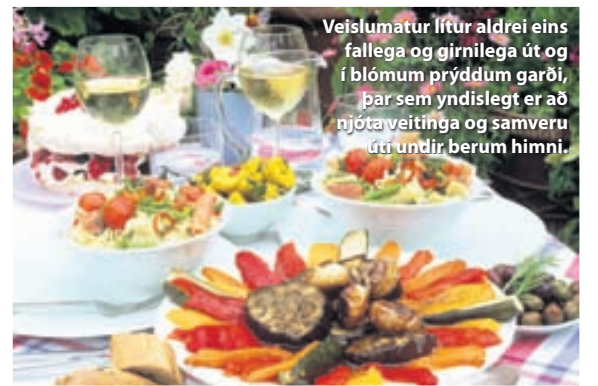
Veislumatur lítur aldrei eins fallega og gjarnlega út og í blómum prýddum garði, þar sem yndislegt er að njóta veitinga og samveru úti undir berum himni.

Tilboðs dagar 20-30% afsláttur af öllum vörum