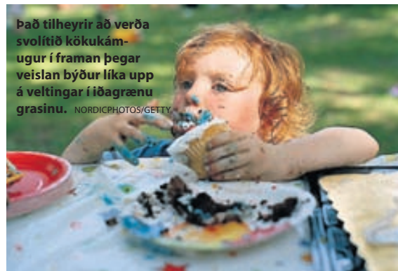
Það tilheyrir að verða svoltið kökukámuur í framan þegar veislan býður líka upp á veltingar í iðagrænu grasinu.