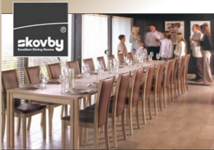
Afar vandað staekkanlegt borð fyrir 6-20 manns. Ljós eik, massív sápuþvegin eik, kirsuber,tekk og hnota Hönnuður: Per Hansbæk

Tilboðs dagar 20-30% afsláttur af öllum vörum