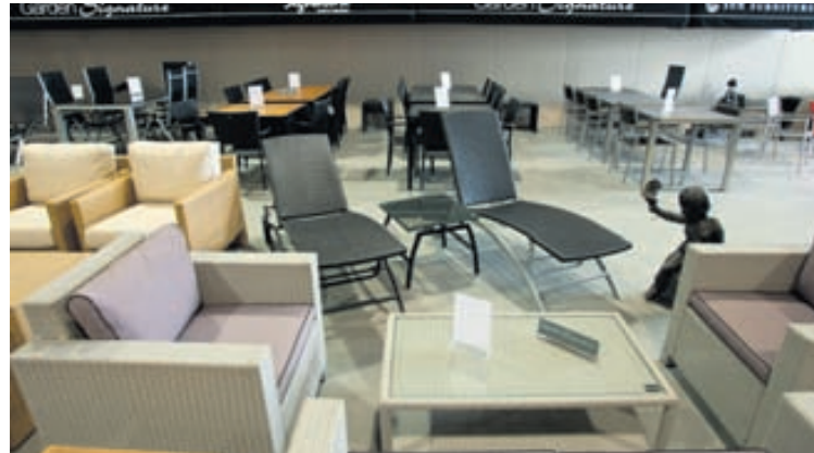
Séð yfir verslun Signature húsgagna í Kaupþúni 3.

Meðal fylgihluta má nefna sóhlífur, sessubox, rólur, hitalampa, útipotta og ker, gasgrill, grasklippur, hekk-klippur og sláttuorf ásamt mörgu öðru sem viðkemur garðinum.