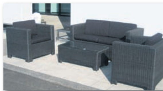
Á mynd: Tetris sett

Nokkar gerðir og litir. Glæsileg og vonduð vara.