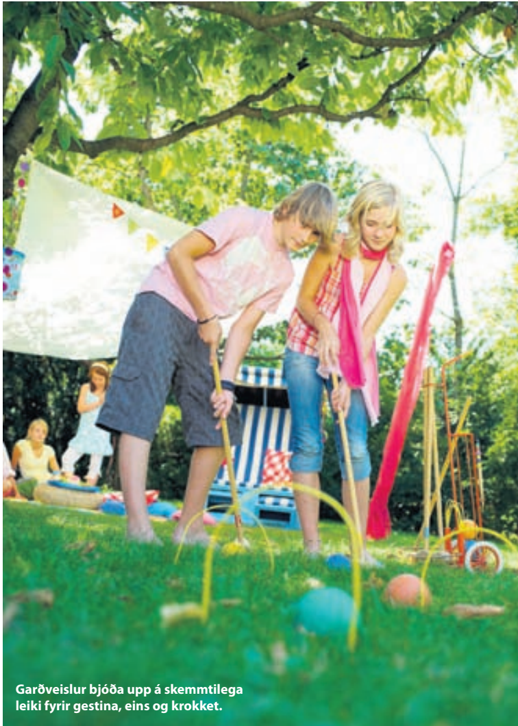
Garðveislur bjóða upp á skemmtilega leiki fyrir gestina, eins og krocket.