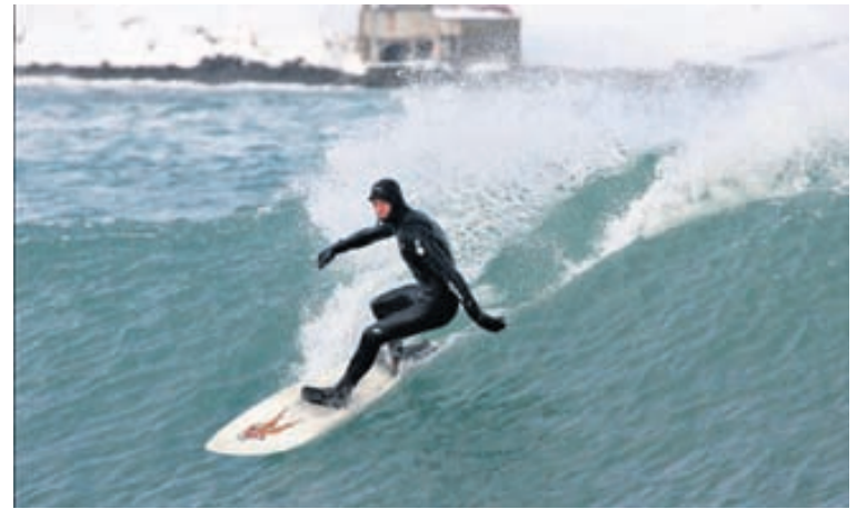
Með góðri æfingu er hægt að sörfa með stæl við Íslandsstrendur.

„Þar er gott að byrja, botninn er mjúkur og allt í lagi að detta. Við byrjum í fjörinni á að kenna að standa og róa og förum yfir öryggisatriði, færum okkur svo í flæð-