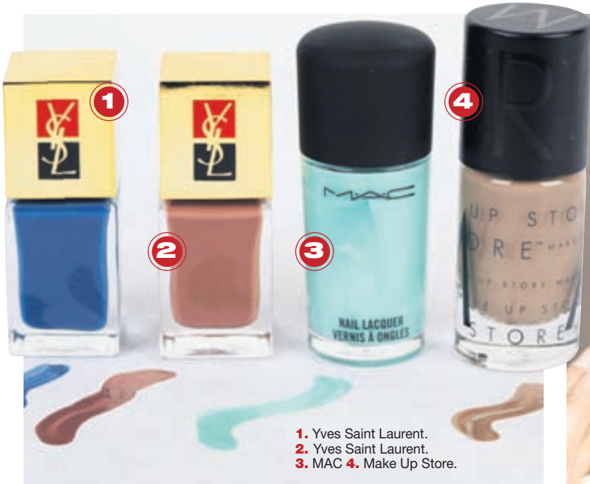
1. Yves Saint Laurent. 2. Yves Saint Laurent. 3. MAC 4. Make Up Store.

Litagleðin verður allsráðandi í sumarförðuninni: