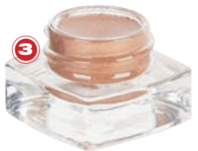
1. Make Up Store. 2. Make Up Store. 3. Bobbi Brown frá Lyfjum og heilsu.