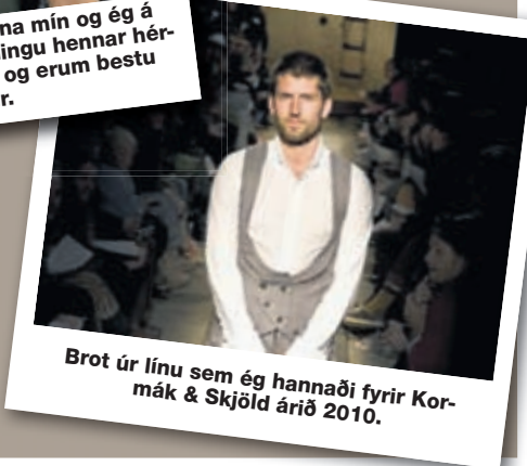
Brot úr línu sem ég hannaði fyrir Kormák & Skjöld árið 2010.