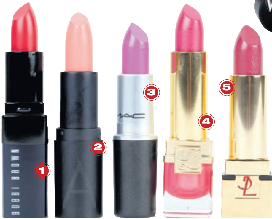
1. Bobbi Brown frá Lyfjum og heilsu. 2. Make Up Store. 3. MAC. 4. Helena Rubinstein. 5. Yves Saint Laurent.