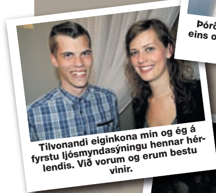
Tilvondandi eiginkona mín og ég á fyrstu ljósmyndasýningu hennar héraendis. Við vorum og erum bestu vinir.