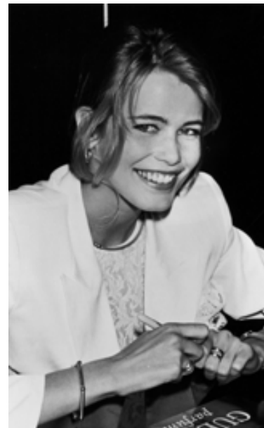
Eins og kvikmyndastjarna Schiffer árið 1990 að kynna ilmvatnið New Guess. Hún hefur ávallt þótt sláandi lík Brigitte Bardot.