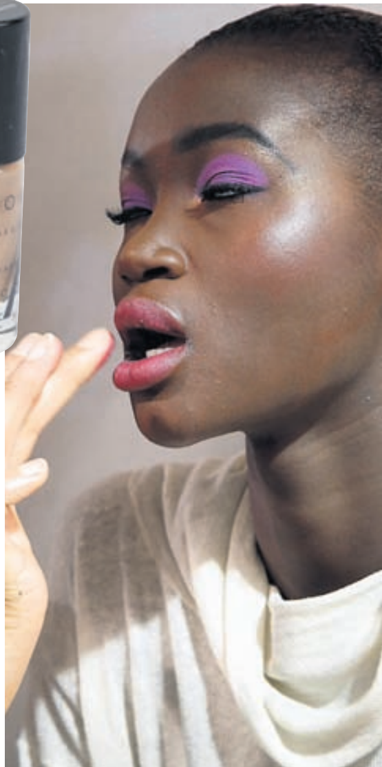
Christian Dior Förðunin á sýningu Dior í haust þótti litrík og líflæg. Fjólubláir tónar verða áberandi í sumarlíðunni.

fallega lit. Látlaus og náttúruleg förðun verður einnig vinsæl í sumar og þar koma appelsínugulu tónarnir sterkir inn, enda sérstaklega frískandi og fallegir. Litaglaðar dömur þurfa þó ekki að örvænta því skærlytar varir og neglur og sterkir augnskuggar verða líka áberandi í sumartískunni líkt og hjá hönnuðinum Derek Lam.