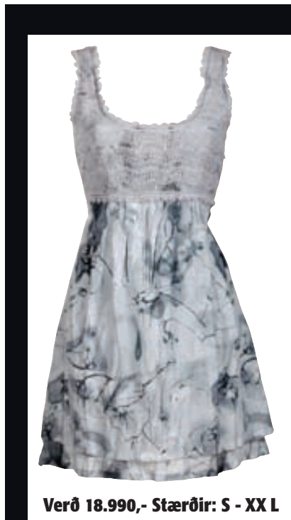
Verð 18.990,- Stærðir: S - XX L

Guðmundur hefur verið duglegur við að fá þjóðþekkta karl-