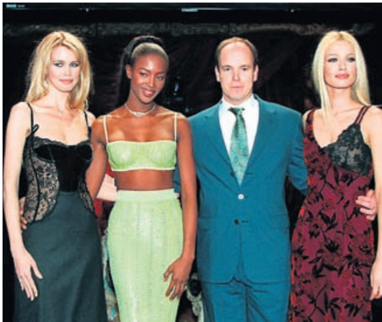
Ofurfyrirsætur Prins Albert af Mónakó ásamt ofurfyrirsætunum Schiffer, Naomi Campbell og Karen Mulder árið 1996.