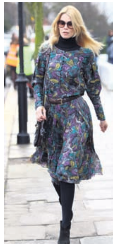
Hundelt Schiffer er enn hundelt af ljósmyndum.