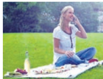
Það tilheyrir fögnum sumardögum að setjast flötum beinum á grasbala borgarinnar og skapa með því tilefni til hvunnagsveislu.

Það er fátt unaðslegra í sumartilverunni en ilmur af nýslegnu grasi og ekkert sem toppar þá upplifun að lifa og leika sér berfættur í grasgrænni, dúnmjúkri ábreiðu náttúrunnar.