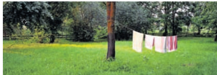
Á sumrin er blátt áfram skylda að þurrka þvottinn úti á snúru og brakandi ferskt ævintýri að leggjast til hvílu í grasilmandi sængurfötum.