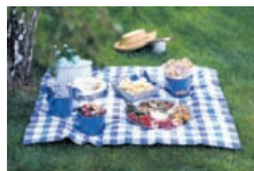
Nestisferð með uppdukuðu veisluborði í iðagrænu grasi er himnesk upplifun og gefur öllu ferskara bragð.