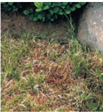
Mörgum leiðist mosinn en til eru nokkur heimilissráð til að losna við hann.

Best er að miða við að börn yngri en fimm ára séu höfð inni og undir eftirliti annarra þegar garðurinn er sleginn enda börn á þeim aldri óútreiknanleg. Best er að ganga alltaf þannig frá garðsláttuvél að hún sé geymd þar sem börn ná ekki til.