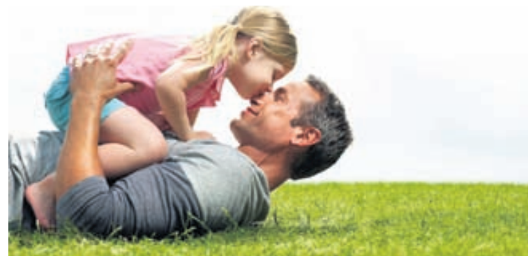
Hamingjan á heima í grasinu, þar sem foreldrar breytast aftur í börn og leika glöð við afkvæmi sín í faðmi móður jarðar.