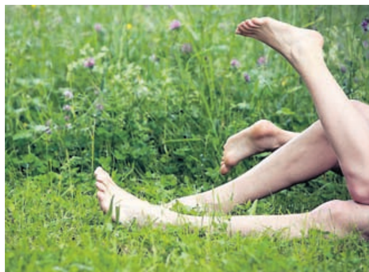
Kelerí er náttúrulegur gjörningur og hvergi eins viðeigandi að veltast um í faðmlögum og á grænum grasbölum, enda grasangan í senn tælandi og alltumlykjandi.

Útgefandi: 365 miðlar ehf., Skaftahlíð 24, s. 512 5000 Ábyrgðarmaður: Jón Laufdal jonl@365.is s. 512 5449 Umsjónarmaður auglýsinga: Ívar Örn Hansen ivarorn@365.is s. 512 5429.