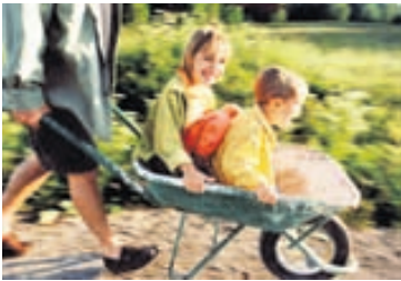
Börn skulu aldrei vera að leik í námunda við garðsláttuvél, hvort sem hún er í gangi eður ei.