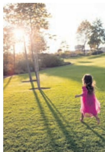
Börn breytast í mannlega grasmaðka þegar sól skín í gegnum strá og fyllast óheftri frelsistilfinningu og vilja hlaupa um mjúk og nýslegin tún.