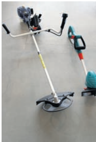
Sláttuorff, hekkklippur, mosatætarar og fleira í garðverkin fæst einnig í BYKO.

nóg að eiga klippur sem ganga fyrir rafmagni, þær eru léttari en hinar og meðfærilegri. Muna þarf bara að smyrja hnífina reglulega með þar til gerðri olíu, sem fæst að sjálfsgöðu hjá okkur. Svo erum við einnig með kerrur fyrir jeppa eða fólksbíl þegar flytja þarf garðúrgang eða tæki. Í leigumarkaði BYKO er einnig hægt að fá flestar vélar á leigu og margir nýta sér það í stað þess að kaupa vélar sjálfir. Ég vil einnig ráðleggja fólk að geyma sláttuvélar inni í upphitðu þurru rými og þegar sláttutímabilinu líkur að tappa bensíni af vélunum. Rafmagnsvél má hengja upp á vegg í geymslunni, eins og önnur garðverkfæri, á milli þess sem hún er í notkun.“