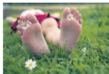
Náttúran nærir okkur með ólgandi krafti sínum í formi grass og blóma, og einskær orkuáfylling að baða kroppinn í litríku sumarskrauti hennar.