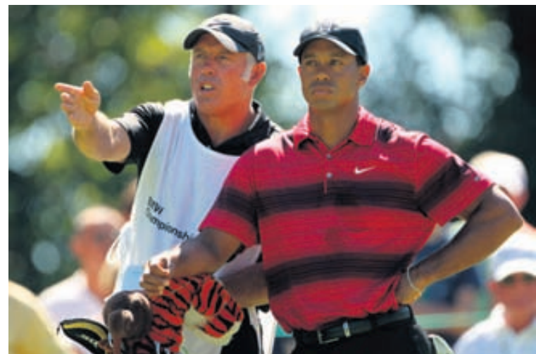
Steve Williams hefur verið kylfusveinn Tigers Woods á þrettán stórmótum, en er nú tímabundið genginn til samstarfs við Adam Scott.