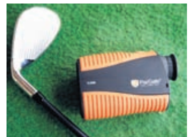
ParGate PG 1500 CX er búinn ýmsum góðum eiginleikum.