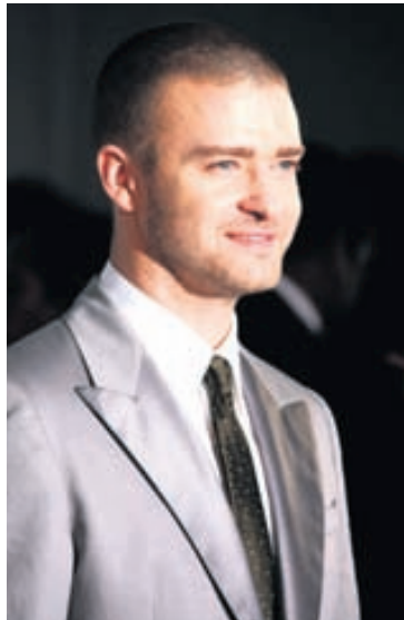
Timberlake segir golfið skemmtilegt á tónleikaferðalögum.