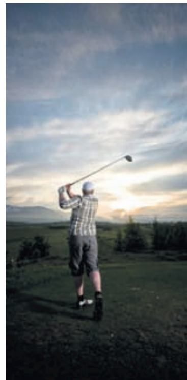
Til að ná góðum tókum á golfíþróttinni skiptir máli að gefa sér tíma og spila í rólegheitum, sérstaklega til að byrja með.