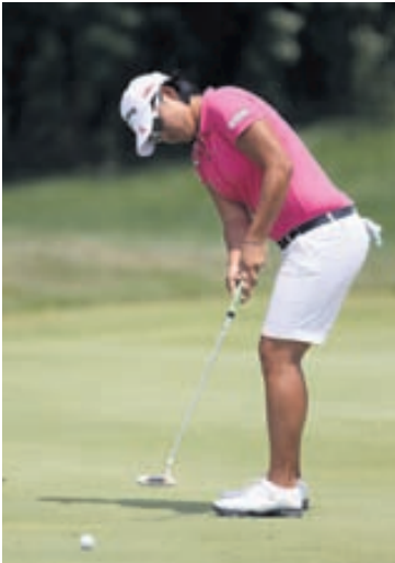
Yani Tseng er 22 ára og situr á toppi heimslista kvenna í golfi.