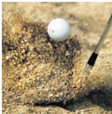
Arctic Open verður haldið á Akureyri helgina 23. til 25. júní.