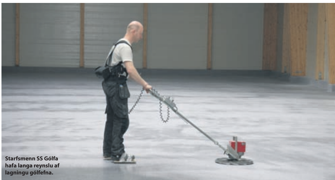
Starfsmenn SS Gólfa hafa langa reynslu af lagningu gólfefna.