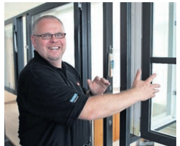
Gluggarnir, sem eru úr tré, eru klæddir með áli.

Sigurður segir Velfac góðan kost fyrir þá sem vilja skipta út gluggum fyrir nýja og