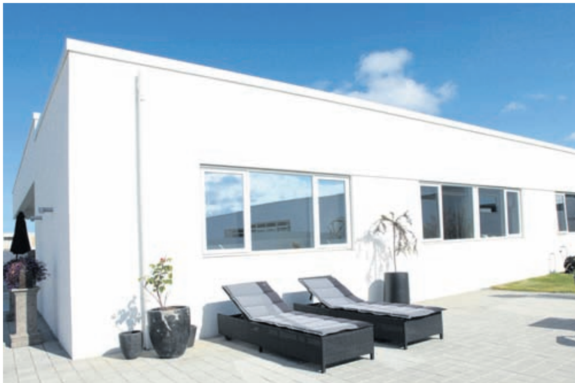
PRO TEC hentar líka í einbýlishús í funkís stíl.

Allar nánari upplýsingar er hægt að nálgast á heimasíðu www.bmvalla.is .