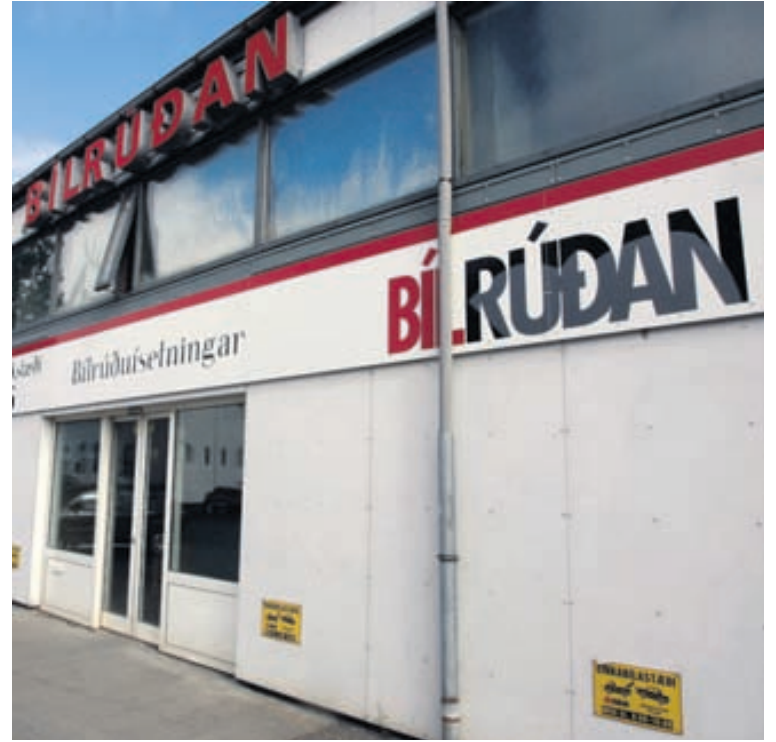
Bílrúðan er fjörutíu ára gamalt fyrirtæki sem er við Grettisgötu í Reykjavík og er nóg af bílastæðum hjá fyrirtækinu.