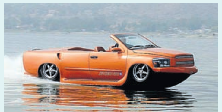
Þessi siglir og keyrir hraðar en aðrir bílabátar.