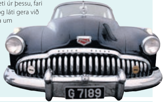
Með tíð og tíma slitnar framrúðan þó hún brotni kannski aldrei.

Framrúður geta enst jafn lengi og bíllinn sjálfur. Vitanlega ætti þó að skipta reglulega um framrúður því með tímanum slitna þær líkt og dekk, bremsur og púst. Eftir tvö til þrjú ár hefur ryk og sandkorn slípað eitthvað til yfirborð glersins, auk þess sem rúðupurrkur auka slit en allt á þetta sinn þátt í að byrgja öikumönnum sýn. Stundum er erfitt að greina slit af þessu tagi í framrúðunni, nema þegar skært ljós skín inn um rúðuna. Þess má geta að á síðustu árum hafa margir trassað bílrúðuviðgerðir og -skipti hérlendis þar sem þeir hafa einfaldlega ekki haft efni á að halda bílnum sínum við. Með batnandi hag er vonandi að sem flestir bæti úr þessu, fari með bíllinn í skoðun og láti gera við bílrúðurnar eða skipta um eins og með þarf.