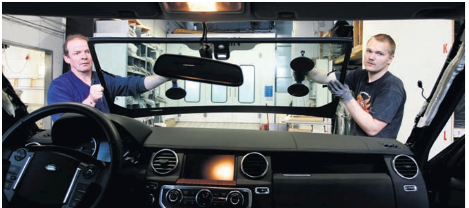
Bílrúðan flytur inn bæði framrúður og afturrúður ásamt því að gera við rúður.

Bílrúðan flytur inn bæði framrúður og afturrúður ásamt því að gera við rúður. „Við erum með rúður á lager í allar bíltegund-