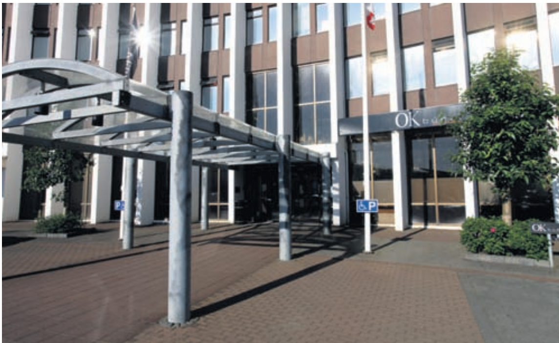
Opin kerfi og OK-búðin eru til húsa í glæsilegu húsnæði að Höfðabakka 9.