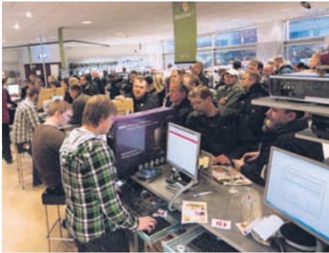
Það er alltaf í nógu að snúast í verslunum Tölvuteks

USB GLINGUR Vorum að fá fjöldann allan af USB glingri frá Satzuma en þar eru skemmtilegar nýjungar eins og Plasma Orb galdrakúla, Retro bílamús, 4 porta USB hauskuðu hub, USB ísskápur fyrir kókdós, USB skotpallur og margt fleira.