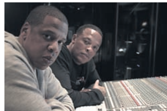
Rapparinn og upptökustjórinn Dr. Dre með tónlistarmanninum Jay Z sem er einn margra í fremstu röð sem nota Beats-hljóðkerfi doktorsins.

„Árið 2008 hóf Dr. Dre samstarf við Monster Cables sem sérhæfir sig í framleiðslu kapla og annars búnaðar fyrir fagaðila í tónlistarbransanum. Fyrsta afurðin var Beats-heyrnatól, því eins og Dr. Dre orðaði það sjálfur voru flott heyrnatól rusl og gæðaheyrnatól eins útlítandi og gömlu heyrnatólin hans pabba. Því hannaði hann töff heyrnatól með bestu fánlegu hljómgæðum og fór tveimur árum síðar í samstarf við HP um að koma hljómgæðum sínum enn betur fyrir í tölvum með Beats-hljóðstýringu, hátölurum