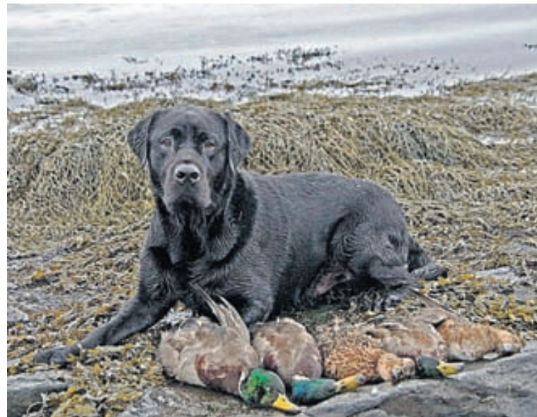
Nói, labradorhundur Alberts, er betri en enginn þegar kemur að því að sækja bráð og finna.